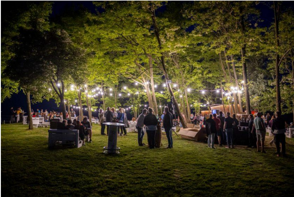
Slika 3 Mađerkin breg kao atrakcija