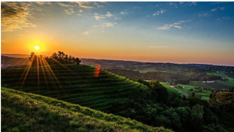
Slika 2 Mađerkin breg u Štrigovi