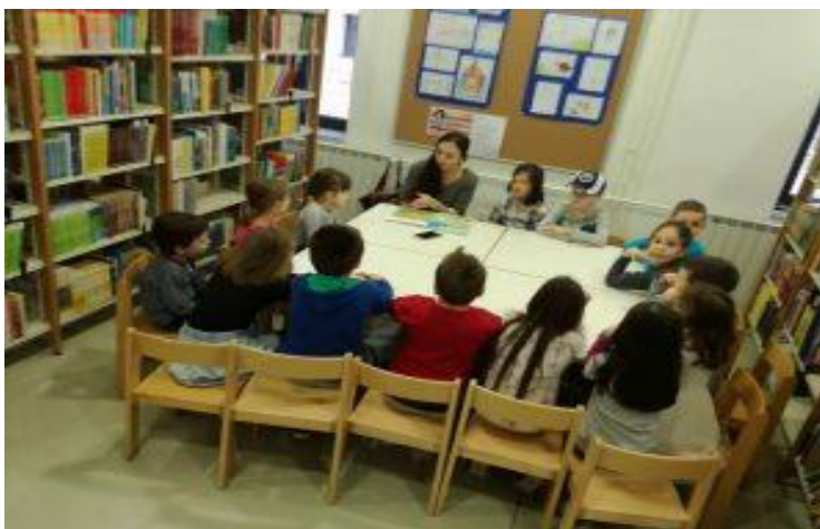
Slika 3. Radionica za djecu u sklopu programa „Čitajmo za djecu“ II.