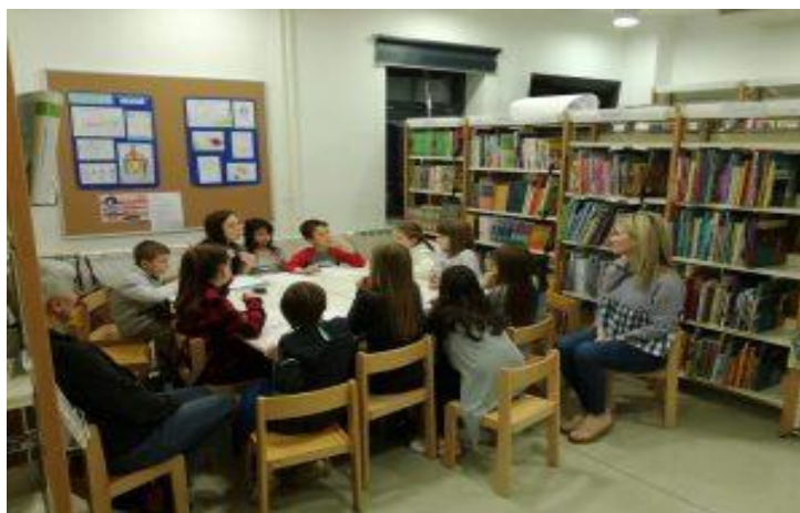
Slika 2. Radionica za djecu u sklopu programa „Čitajmo za djecu“ I.