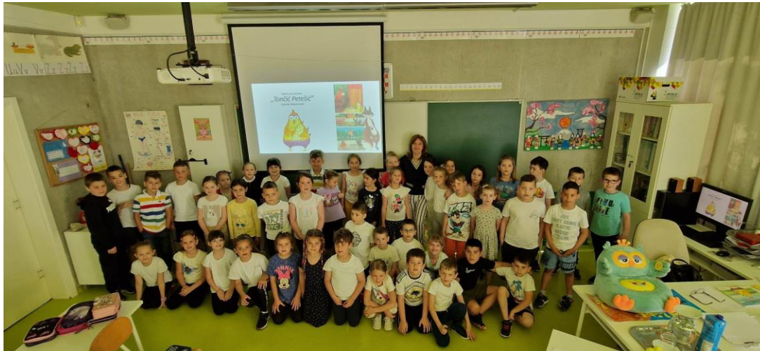
Slika 3 do 4: Crteži prvašića na temu slikovnice Tončić Petešić (Dostupno na: http://os-veli-vrh-pu.skole.hr/?news_id=2463 ; Pristupljeno: 16. kolovoza 2023.)