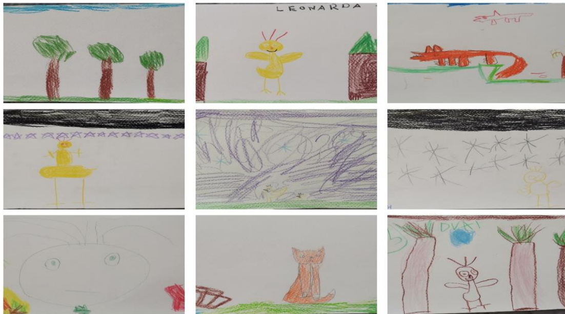
Slika 13: Crteži djece u dobi od 3 do 7 godina

Treći dio metodičke obrade slikovnice Tončić Petešić , koji se odnosi na dramaturgiju teksta, mogao bi se provesti sljedeći dan ili za nekoliko dana a u svim segmentima sadržavala bi sadržaje iz navedene slikovnice. Prije same dramaturgije potrebno je s djecom izraditi lutke, scenu, kazalište, osmisliti što je sve potrebno za realizaciju dramske igre. Kartoni i kutije koje će oslikati djeca mogu poslužiti za izradu lutkarskog kazališta, a razne tkanine, štapovi i kuhače za izradu lutke. Potrebno je samo malo mašte, kreativnosti i suradnje. Moguće je s djecom na temu slikovnice napraviti i poticaje koje bi djeci bile ponuđene tokom boravka u skupini (memory kartice s motivima iz slikovnice, razne lutke koje bi izradila djeca uz pomoć odgojitelja, društvene igre, izrada kokošinjca, farme, razne igre i sl.). Sve se radi u suradnji s djecom, njihovim željama i interesima. Crteže koji su prethodno nacrtala djeca mogu poslužiti za izradu vlastite slikovnice koje će oni sami prepričavati i tako razvijati govorno izražavanje, prepričavanje, pamćenje, suradnju i kreativnost, te si time stvaraju kvalitetne temelje za dramaturgiju određenog književnog djela.