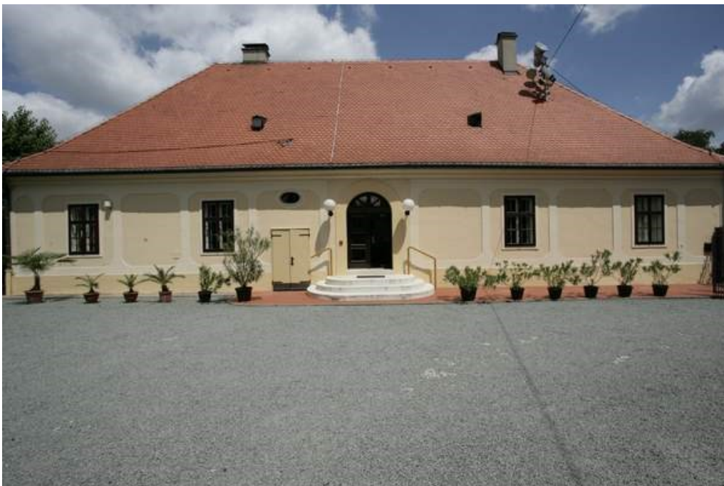
Slika 16. Muzej Josipa Jurja Strossmayera, izvor: https://djos.hr/spomen-muzej-biskupa-josipa-jurja-strossmayera/

Spomen-muzej biskupa Strossmayera osnovan je 1991., a smješten je u kanoničnoj kuriji neposredno uz katedralu, na ulazu u ulicu Hrvatskih velikana (Korzo). Muzej u prizemlju ima svoj stalni postav na kojem su radili stručnjaci HAZU, Povijesnog muzeja Hrvatske, Regionalnog zavoda za zaštitu spomenika kulture i Biskupije đakovačke i srijemske. Izloženi su eksponati vezani uz Strossmayera, od njegovog krsnog lista do portreta na odru. Tu su izloženi dokumenti, knjige, predmeti i umjetničke slike. Potkrovlje Muzeja adaptirano je u izložbeni prostor, gdje se često održavaju različite likovne izložbe.