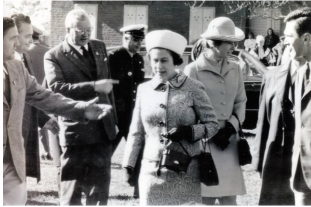
Slika 14. Posjet kraljice Elizabete II. đakovačkoj ergeli 1972.

Sveti Otac Ivan Pavao II. u pratnji državnog tajnika Svete stolice Angela Sodana i suradnika posjetio je Đakovo 2003., kada je treći put pohodio Hrvatsku. Papamobilom se iz Osijeka dovezao u Đakovo, prolazeći kroz sva naselja koja povezuju ta dva grada, diveći se ljepoti ovoga kraja. Poznate su njegovi riječi tim povodom: „Divim se ljepoti slavonske ravnice – žitnici Hrvatske“. Pomolio se i razgledao katedralu baziliku sv. Petra te obišao biskupski dom, sjedište đakovačkih biskupa i biskupije. 18