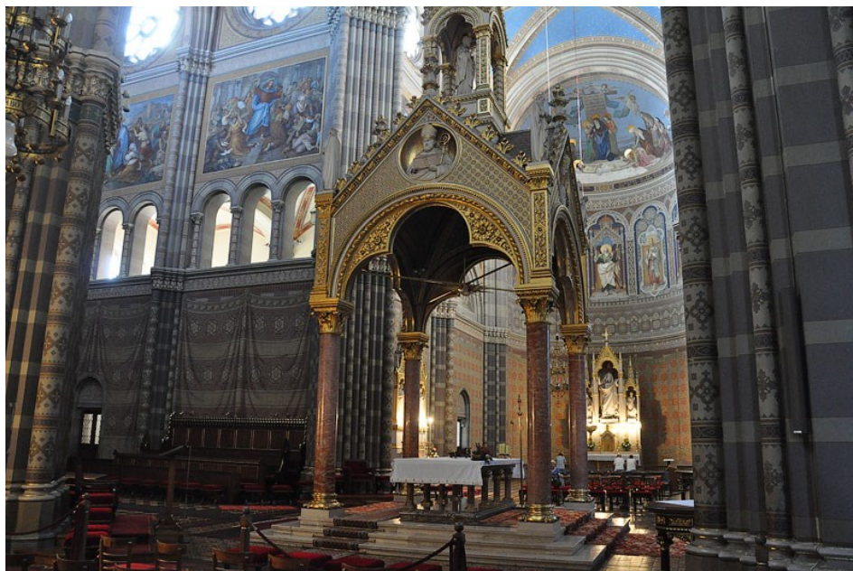
Slika 10. Glavni oltar u katedrali Svetog Petra