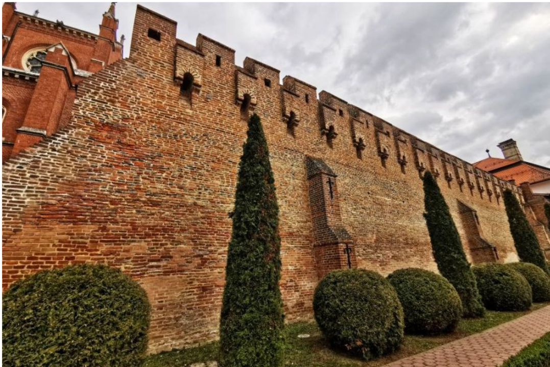
Slika 4. Đakovačke zidine koje datiraju iz 13. stoljeća, izvor: https://moje-djakovo.com/dakovacke-zidine-kao-dio-bogate-povijesti-града/

God. 1252. u Đakovu je izdan biskupski dokument koji je napisan u mjestu koje se zove Đakovo, ispred kuće biskupa bosanskog. U ispravi se nalazi prvi spomen mjesta, ali također saznajemo i da se u njemu nalazi biskupova kuća, što znači da on tada boravi na tom području. Ono ima svojeg kapelana, dakle mora imati kapelu, odnosno crkvu. Mjesto se dalje razvijalo te se u njemu gradi kastrum unutar kojeg se smješta katedrala i dvor. Godine 1347. odobrio je papa Klement VI. podizanje franjevačkog samostana. Tijekom 14. i 15. stoljeća isprave razlikuju castrum Diako , tj. biskupski grad s katedralom i civitas (forum) Dyako(w), tj. varoš ili trgovište Đakovo. To su dokazi da je proces koji je započeo s dolaskom biskupa u mjesto završio pretvarajući Đakovo u središte većeg posjeda agrarne okolice u kojem se nalazio forum, tj. trg. 7