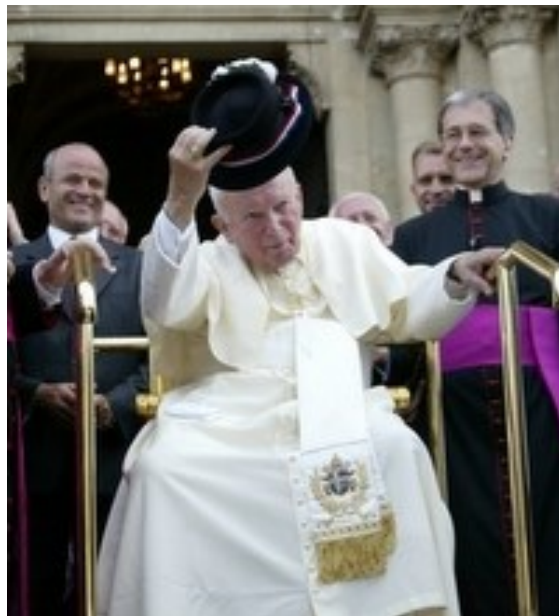
Slika 15. Posjet Ivana Pavla II. Đakovu 2003.

Sveti Otac Ivan Pavao II. u pratnji državnog tajnika Svete stolice Angela Sodana i suradnika posjetio je Đakovo 2003., kada je treći put pohodio Hrvatsku. Papamobilom se iz Osijeka dovezao u Đakovo, prolazeći kroz sva naselja koja povezuju ta dva grada, diveći se ljepoti ovoga kraja. Poznate su njegovi riječi tim povodom: „Divim se ljepoti slavonske ravnice – žitnici Hrvatske“. Pomolio se i razgledao katedralu baziliku sv. Petra te obišao biskupski dom, sjedište đakovačkih biskupa i biskupije. 18