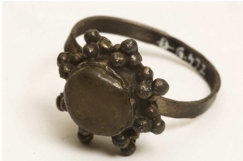
Slika 2. Srebrni prsten u obliku osmerostrane zvijezde s nalazišta Đakovo-župna crkva (12.-13. st.), izvor: https://muzej-djakovstine.hr/zbirke/arheoloska-zbirka/

Za posljednju fazu pokapanja tipični su relativno duboko ukopani grobovi koji redom preslojavaju sve starije grobove. U njima su pronađeni odlično sačuvani kosturi. Orijentacija grobova kroz ovu fazu ostala je gotovo ista. Manjak nalaza glavna je karakteristika ovog prostora. Rijetki nalazi uključivali su lijevane prstene, kopče i pređice, naušnice od žice te gumbice. Predmeti koji su tipični za kasnosrednjovjekovno razdoblje slabo su zastupljeni na groblju. Tako se samo u jednome grobu nalazilo fragmentarno sačuvan vijenac za glavu, tipičan nalaz iz 14. i 15. stoljeća. Pronađena su dva ugarska denara iskovana u vrijeme vladavine kraljice Marije (1382.-1385.) i kralja Vladislava II. (1490.-1516.). Ne zna se točno kada je nastupio prekid pokapanja. Turskim zauzimanjem grada 1536. prorijedilo se kršćansko stanovništvo, ali unatoč tome kršćani čine većinu pučanstva u gradu. 5