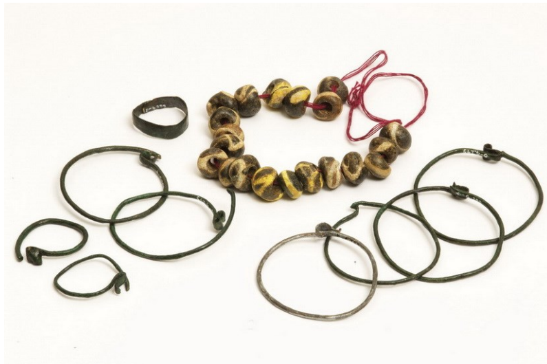
Slika 1. Inventar groba 299 s nalazišta Đakovo-župna crkva (12.-13. st.), izvor: https://muzej-djakovstine.hr/zbirke/arheoloska-zbirka/

Sredinom 12. stoljeća došlo je do promjene koja je za posljedicu imala prestanak širenja groblja na sjever. Uz to što se na istraženoj površini ono suzilo, započelo se s pokapanjem po već zaposjednutom prostoru koji je tada već morao biti napušten. U prvo se vrijeme popunjava prazan prostor između redova grobova čiji su se humci vidjeli na površini, no vrlo brzo počinje i pokapanje preko starijih grobova koji su očito bili zpušteni. U to je vrijeme pored groblja sagrađena crkva kojoj su stanovnici mjesta nastojali primaknuti grobove svojih mrtvih. Način ukopa ni po čemu se ne razlikuje od prethodnog horizonta. Predmeti u grobovima ove faze vrlo su slični onima prethodne, ali su još rjeđi. Pojedini predmeti izrađeni su vrlo kvalitetno, a drugi su pak samo imitacija luksuznog nakita izrađenog u lokalnim radionicama. Kraj druge faze pokapanja na đakovačkom groblju upravo se poklapa s dolaskom bosanskog biskupa u Đakovo. 4