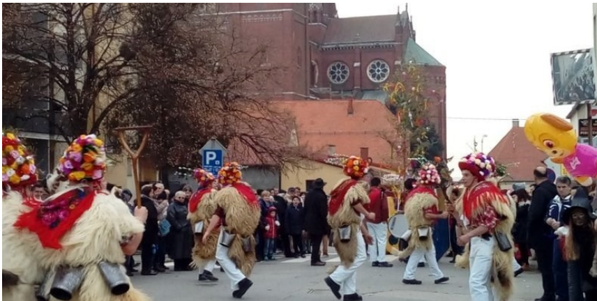
Slika 20. Đakovački bušari

Godine 1994. u Đakovu je osnovan karneval koji nosi ime Đakovački bušari. Naziv buše označuje maskirane ophodnike u pokladama kod Hrvata u hrvatskom i u mađarskom dijelu Baranje te u istočnijem dijelu Slavonije, napose oko Đakova. Zbog značenja i zbog pojedinosti koje na to upućuju predlaže se mogućnost povezanosti naziva buše, bušari s uši bušina (naziv za treći tjedan, nedjelju, pred završne poklade pravoslavnih) i uši bušiti (ušiti, bušiti) u značenju: mrsiti (ne održavati nemrs, post) 20 . Glavni događaj je velika pokladna povorka koja se odigrava na ulicama centra grada. Ispred zgrade Gradskog poglavarstva održava se ceremonijal preuzimanja vlasti, osniva se Bušarska republika, a gradonačelnik predaje ključeve grada Bušarima. Na kraju sve završava plesom pod maskama u velikom pokladnom šatoru. Đakovački su bušari po broju sudionika najveći karneval istočne Hrvatske i član su Saveza hrvatskih karnevalskih gradova.