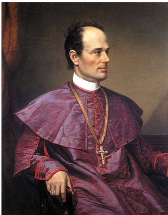
Slika 6. Josip Juraj Strossmayer, izvor: https://www.enciklopedija.hr/natuknica.aspx?ID=58459