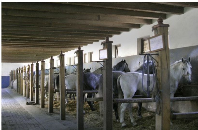
Slika 13. Pastuharna đakovačke ergele, izvor: http://ergela-djakovo.hr/hr/o-ergeli/

Tradicija uzgoja konja u Đakovu počinje s dolaskom biskupa u Đakovo. Pisani tragovi spominju 1374., kada se u Đakovu vjenčao ban Tvrtko s bugarskom princezom Doroteom. Tada je biskupu koji ga je vjenčao dao na dar deset arapskih konja i jednog pastuha. Godina 1506. uzima se kao početak organiziranog uzgoja konja u Đakovu pa se zbog toga ergela svrstava među najstarije u Europi. To je bilo za vrijeme biskupovanja Mije Keserića. Tada je u Đakovu bilo 90 rasplodnih konja. Biskup Strossmayer 1854. dovodi iz Lipice u Sloveniji sedam lipicanskih kobila i jednog pastuha, od kojih su nastali današnji rodovi lipicanskih konja u Đakovu. U sklopu pastuharne u gradu se nalazi hipodrom, a na području Ivandvora, gdje su smještene rasplodne kobile, nalazi se prapovijesni lokalitet. Đakovački lipiscanci prenijeli su glas o Đakovu širom svijeta. Uz brojne nastupe i postignute uspjehe na raznim svjetskim natjecanjima, đakovački četveropreg (fijaker s četiri upregnuta lipicanca) sudjelovao je u ceremonijalnom otvaranju olimpijskih igara u Münchenu 1972. Engleska kraljica Elizabeta II. za vrijeme svojega posjeta Đakovu i Ergeli 1972. divila se ljepoti lipicanskih konja i u četveropregu u pratnji dvadesetak svatovskih zaprega prošla je đakovačkim ulicama do pastuharne. Nakon dugog niza godina i privatnih uzgajivača konja ponovno je sve više. Danas se konji ne uzgajaju kao radna i vučna snaga, nego kao ponos, dio tradicije i ljubavi prema plemenitoj životinji. 16