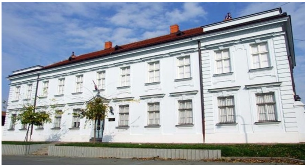
Slika 17. Muzej Đakovštine

je inicijativni odbor građana za osnivanje Muzeja grada Đakova (danas Muzej Đakovštine), a prvi stalni postav otvoren je 1952. Muzej Đakovštine raspolaže s oko 40.000 eksponata u etnološkoj, arheološkoj i povijesnoj zbirici. Smješten je u Ulici Ante Starčevića, nekadašnjoj zgradi starog kotara. 19