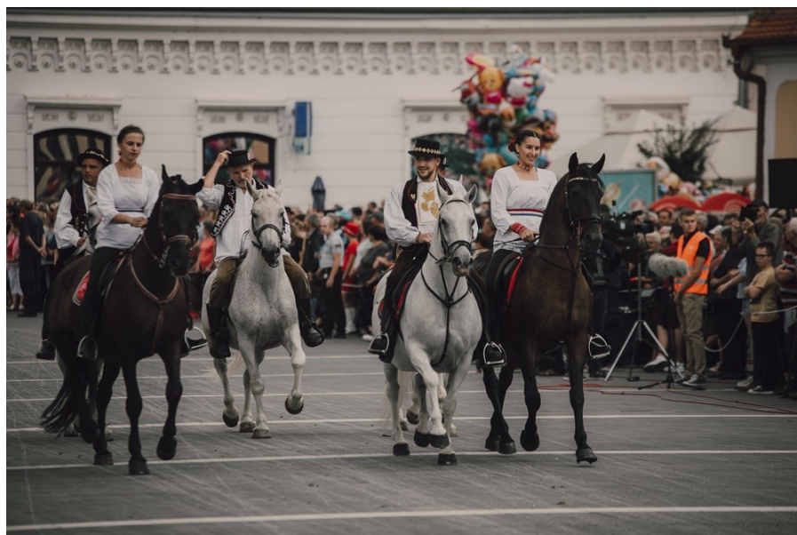
Slike 18. i 19. Svečana povorka povodom Đakovačkih vezova