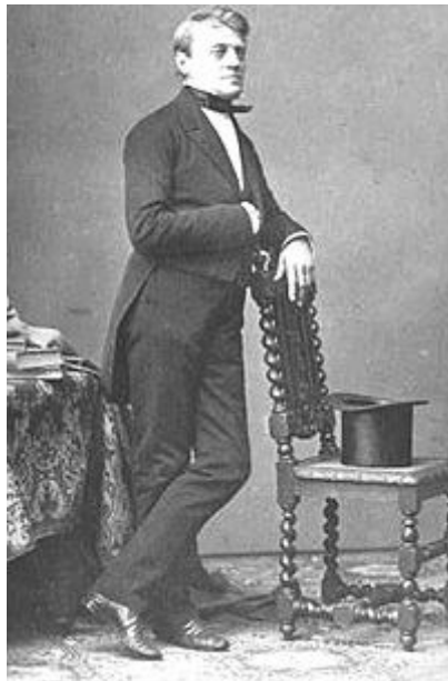
Slika 7. Karl Rösner

ono vrijeme, dopremati iz Istre, Austrije, Mađarske, Italije, Francuske i s drugih strana. 13