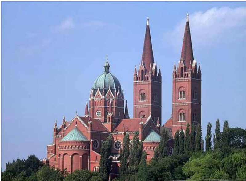
Slika 9. Katedrala Svetog Petra u Đakovu, izvor: https://www.crovista.com/%C5%A1to-raditi/10-katedrala-sv-petra-u-%C4%91akovu

Današnja katedrala sagrađena je u neogotičko-romanskom stilu, kao trobrodna katedrala u obliku latinskog križa. Katedrala je izgrađena od domaće crvene fasadne opeke koja je ispečena specijalno za tu namjenu u biskupskoj ciglani u Đakovu. Prilaz čini široko stubište, a u njezine tri lađe ulazi se kroz tri svečana portala. Crkvu krase dva zvonika s pročelja, a sa začelja kupola.