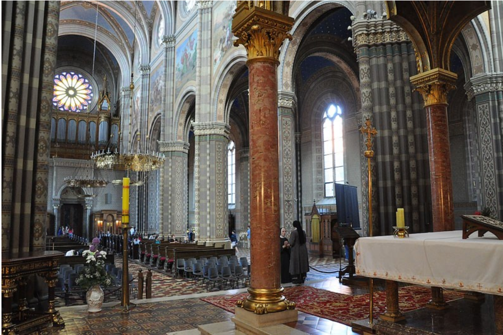
Slika 11. Glavna lađa i orgulje u katedrali Svetog Petra, izvor: https://www.hkv.hr/reportae/lj-krinjar/17894-dakovo-allah-u-strossmayerovoj-katedrali.html