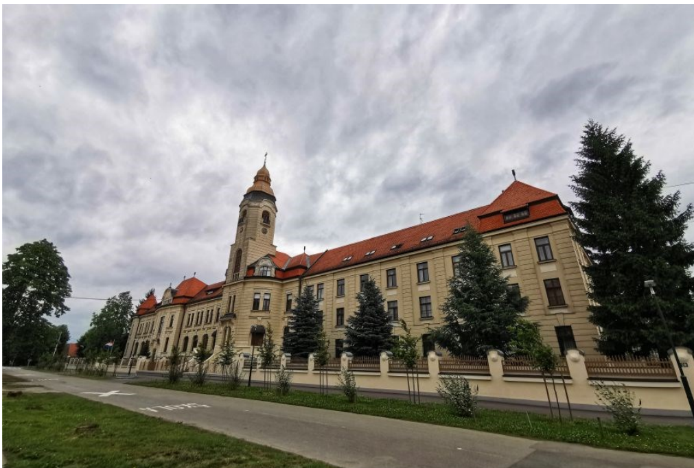
Slika 12. Samostan Milosrdnih sestara svetog Križa, izvor: https://moje-djakovo.com/koronavirus-se-pojavio-u-samostanu-milosrdnih-sestara-svetog-kriza/