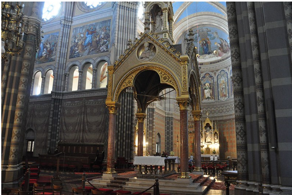
Slika 10. Glavni oltar u katedrali Svetog Petra, izvor: https://www.hkv.hr/reportae/lj-krinjar/17894-dakovo-allah-u-strossmayerovoj-katedrali.html

katedrale ukrašene su bojanim ornamentima vrlo različitih oblika koje su djelo slikara-dekoratera Josipa Voltolinija i njegovih suradnika. Posebna atrakcija su velike orgulje koje se nalaze na pjevačkom koru. Prve orgulje izgorjele su u požaru koji je buknuo 1933. Sadašnje orgulje izradila je poznata slovenska orguljska firma Franca Jenka. Orgulje imaju 73 registra, tri manuala i pedale s 5486 svirala. Ispod glavnog oltara i poprečne lađe nalazi se kripa. Tu su grobnice graditelja, biskupa Strossmayera, i drugih biskupa.