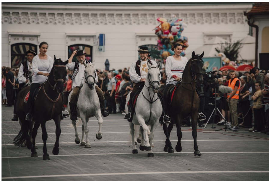
Slike 18. i 19. Svečana povorka povodom Đakovačkih vezova