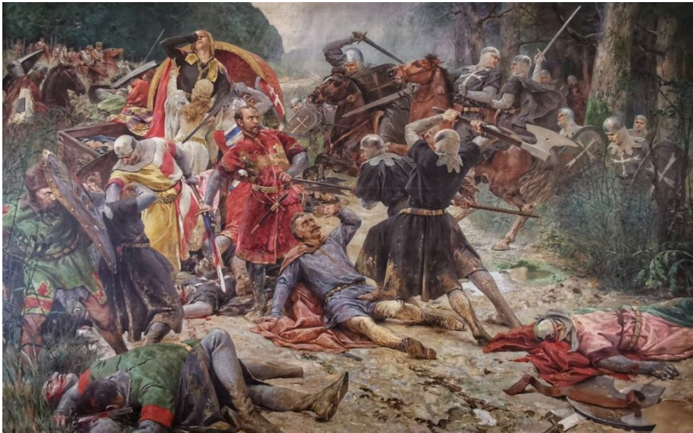
Slika 5. Oton Iveković, Bitka kod Gorjana, izvor: https://moje-djakovo.com/na-danasnji-dan-1386-godine-odvila-se-bitka-kod-gorjana/

Đakovo je 1386. posjetila hrvatsko-ugarska kraljica Marija sa svojom majkom Elizabetom Kotromanić. Došle su u Slavoniju kako bi svladale otpor osvetnika ubijenog Karla Dračkog. 25. srpnja, na putu između Đakova i Gorjana, u Garovom dolu, kraljicu i njezinu svitu napali su nezadovoljni osvetnici pod vodstvom bana Ivana Horvata. Bitka je završila velikom pobjedom ustanika. Poubijali su cijelu kraljičinu pratnju, uključujući Nikolu Gorjanskog, Ivana i Grgura Gorjanskog, Ivana Trentula, Stjepana Koroda i druge, a Mariju i njezinu majku odveli su u zarobljeništvo u Novigradu kod Zadra. 8