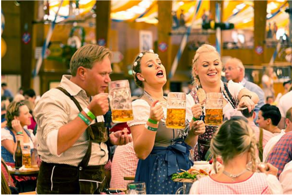
Slika 3. Oktoberfest u Munchenu