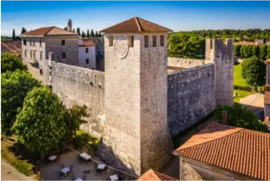
Slika 15. Kaštel Svetvinčentu