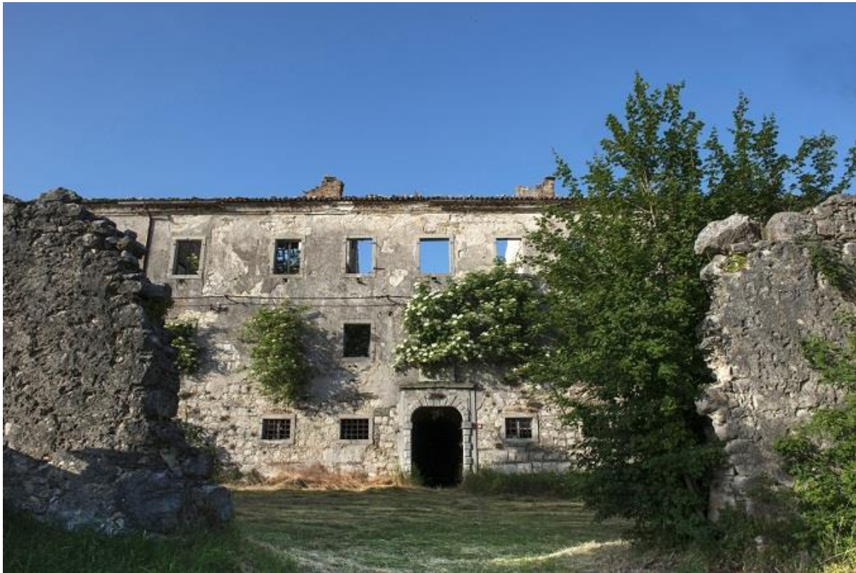
Slika 6. Kaštel Lupoglav