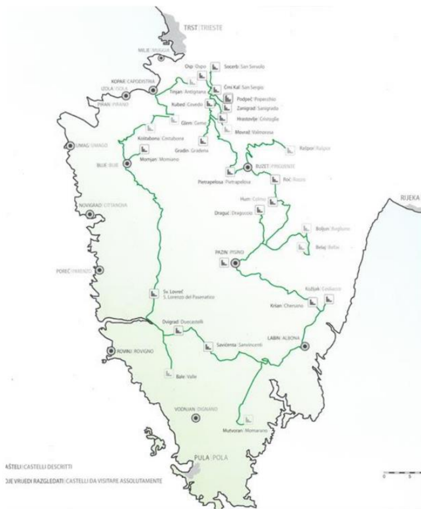
Slika 1. Karta istarskih kaštela