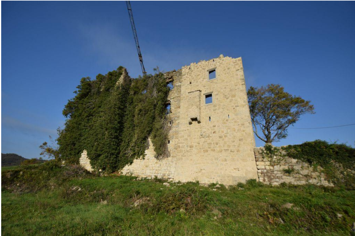
Slika 12. Kaštel Paz