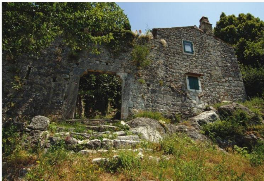
Slika 9. Kaštel Kožljak

„Česti sukobi i financijski problemi njegovih vlasnika doveli su do stalnih promjena vlasništva, a posjednici kaštela su se izmjenjivali od grofova Goričkih, Mlečana do akvilejskog patrijarha i, naravno, Austrije. Obitelj Barbo, koja je također živjela u kaštelu, djelomično je prihvatila protestantizam tijekom 16. st., a jedan od najistaknutijih zaštitnika reformacije u Istri bio je Francesco Barbo-Waxenstein. Unatoč njegovoj podršci istaknutim propovjednicima i piscima, Crkva je ubrzo protjerala sve protestantske propovjednike i pisce, prepuštajući ih inkviziciji na milost i nemilost.“ 24