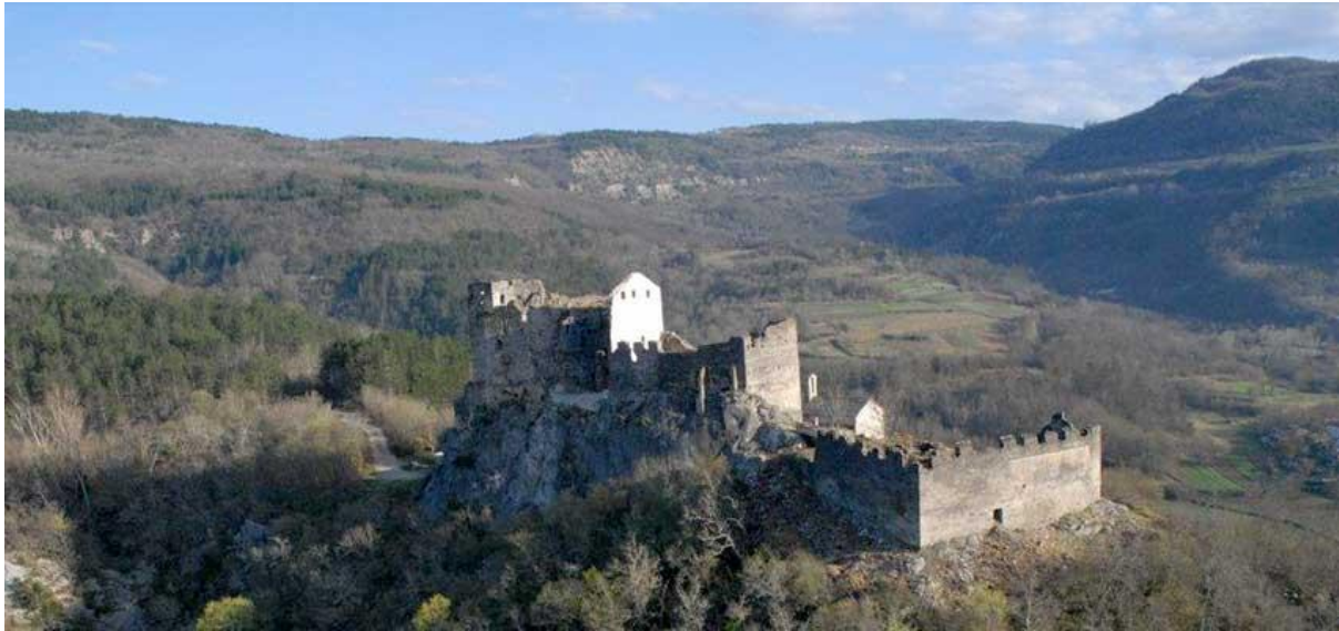
Slika 13. Kaštel Petrapilosa