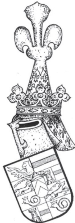
Slika 5 Grb obitelji Herberstein