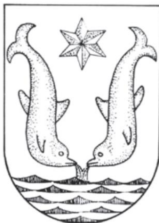
Slika 4. Grb obitelji Brigido