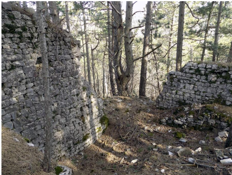
Slika 14. Kaštel Rašpor