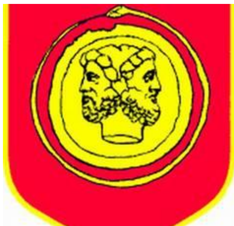
Slika 2. Grb Lupoglava