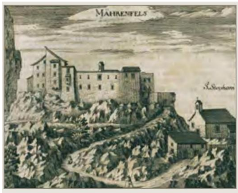
Slika 3. Veduta Lupoglava 17. st.