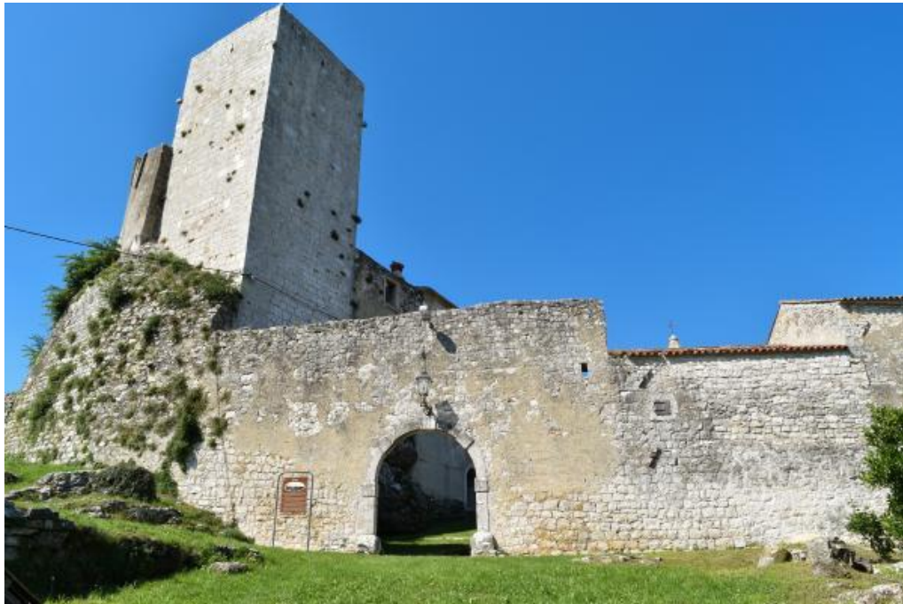
Slika 10. Kaštel Kršan