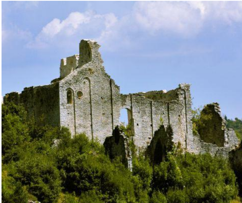
Slika 8. Kaštel Dvigrad