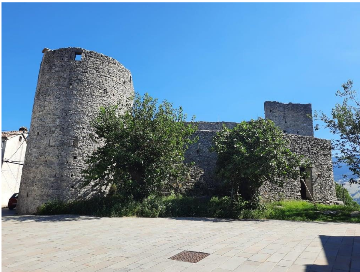
Slika 7. Kaštel Boljun