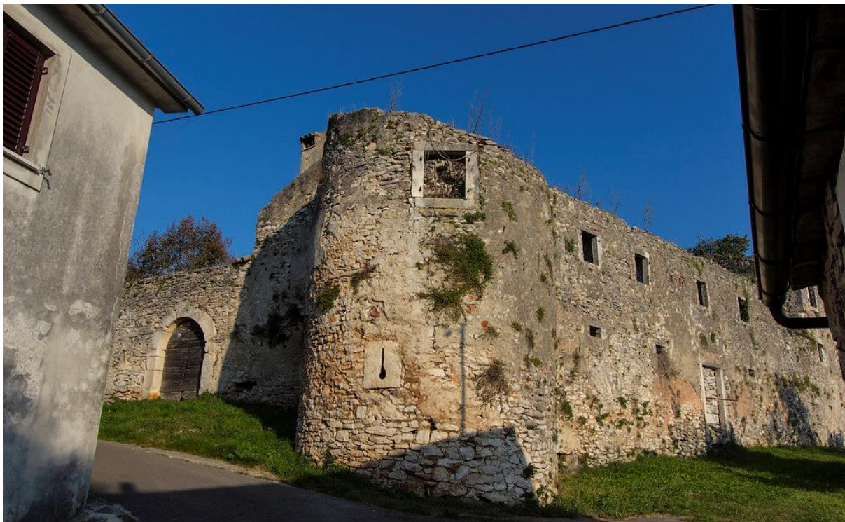
Slika 16. Kaštel Šumber