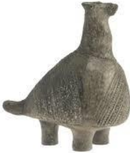
Slika 1.: Vučedolska golubica