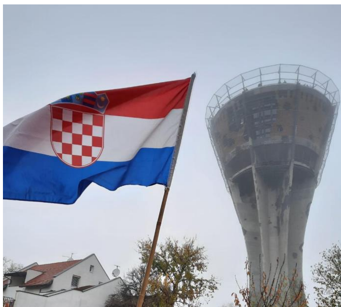
Slika 3. Vukovarski vodotoranj

vodotoranja započeli su 2017. godine s najvećim doprinosom i donacijama samih građana iz domovine i inozemstva. U znak zahvale za doprinos, imena donatora stoje na donatorskoj ploči na samom vrhu vodotoranja. Vodotoranj je obnovljen samo na dijelovima koji su bili neophodni za sigurnost dok je ostatak oštećenja od projektila ostao netaknut. Danas je moguće razgledati vodotoranj pomoću panoramskog dizala te stepeništa koji vodi do memorijalne sobe. U memorijalno sobi nalazi se sedam ekrana koji prikazuju po jedan važan isječak vukovarske ratne prošlosti. Na taj način svaki posjetitelj može vidjeti tijekom Domovinskog rata te Bitke za Vukovar. Također u memorijalnoj sobi se nalaze fotografije vukovarskih branitelja i heroja koje podsjećaju na njihovu veličinu i hrabrost te težak put i patnju koju su proživjeli. Iz memorijalne sobe uspinje se 200 metara duga staza koja simbolizira hod vukovarskih branitelja prema slobodi.