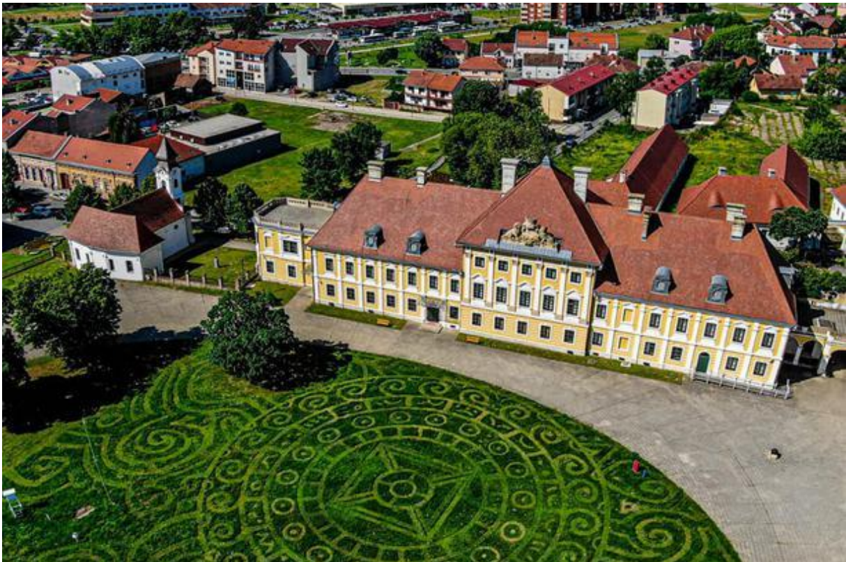
Slika 2. Dvorac Eltz