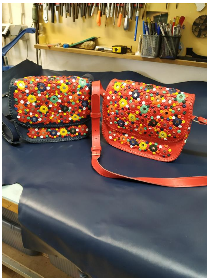
Slika 5. Tradicijska kožna torba