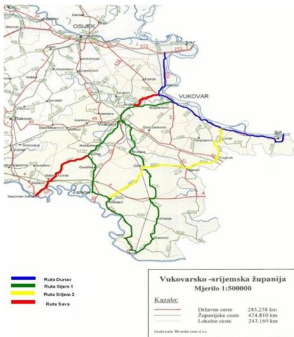
Slika 9. Biciklistička ruta Srijem