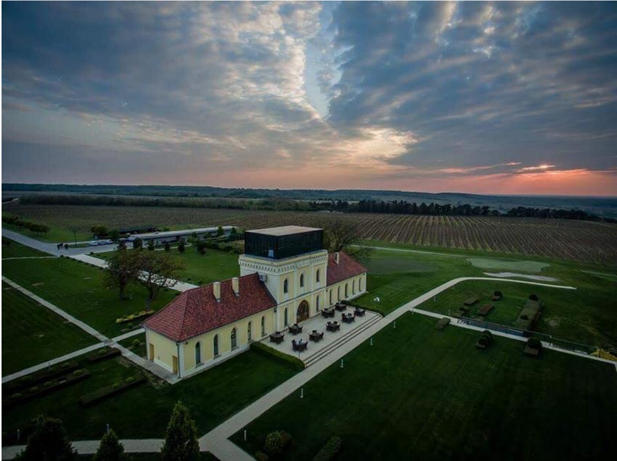
Slika 8. Ladanjsko imanje Principovac

Izvor: https://wall.hr/lifestyle/savrsena-lokacija-za-vjencanje-iz-bajke/ , 1.8.2022.