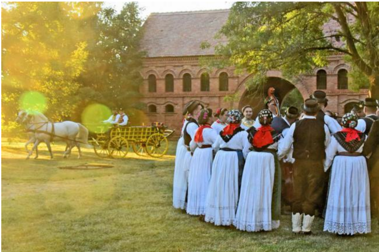
Slika 7. Prikaz šokačkog kola i tradicijske nošnje