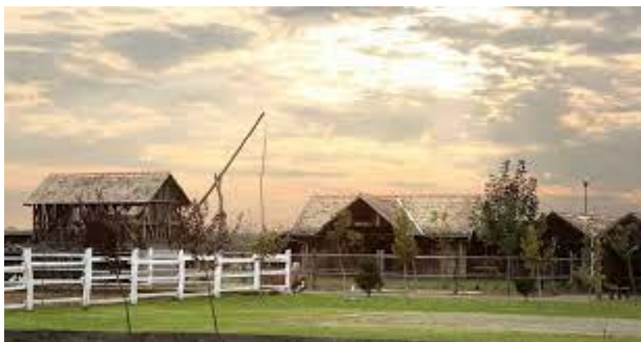
Slika 4. Acin salaš