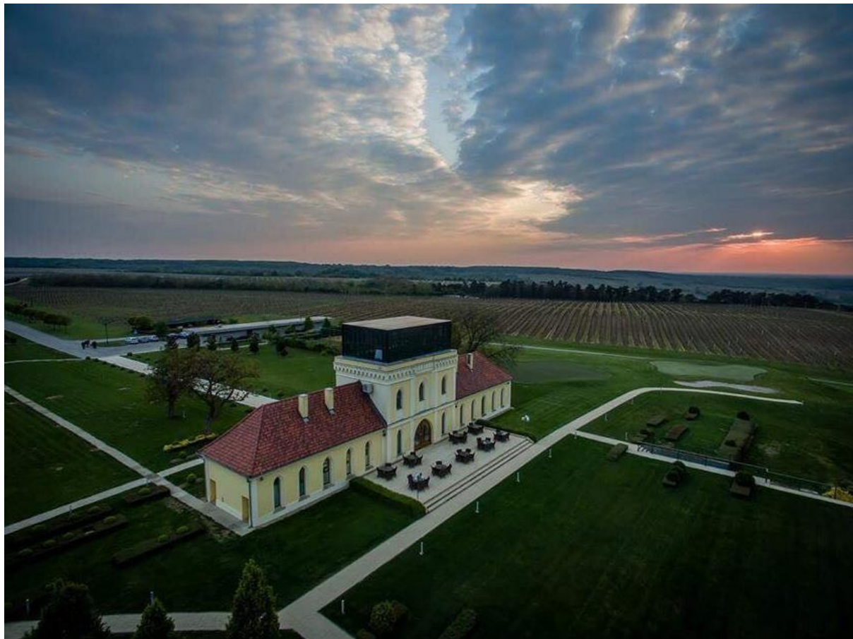
Slika 8. Ladanjsko imanje Principovac