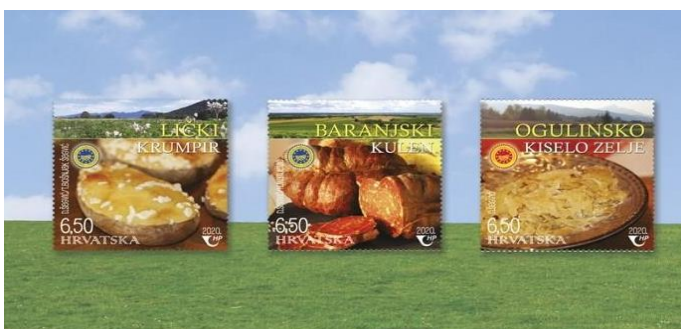
Slika 6. Prikaz zaštićenih hrvatskih autohtonih proizvoda