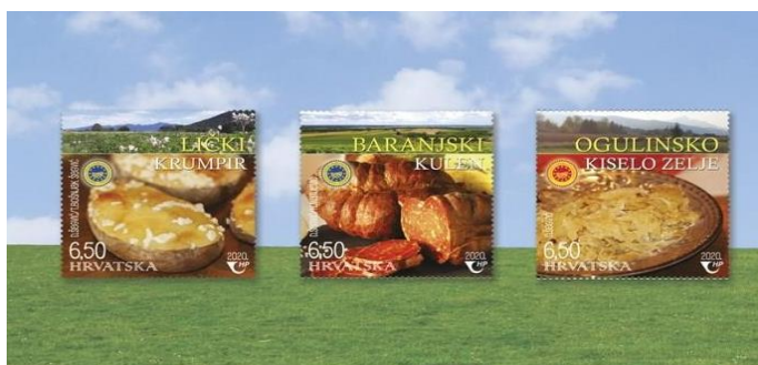
Slika 6. Prikaz zaštićenih hrvatskih autohtonih proizvoda