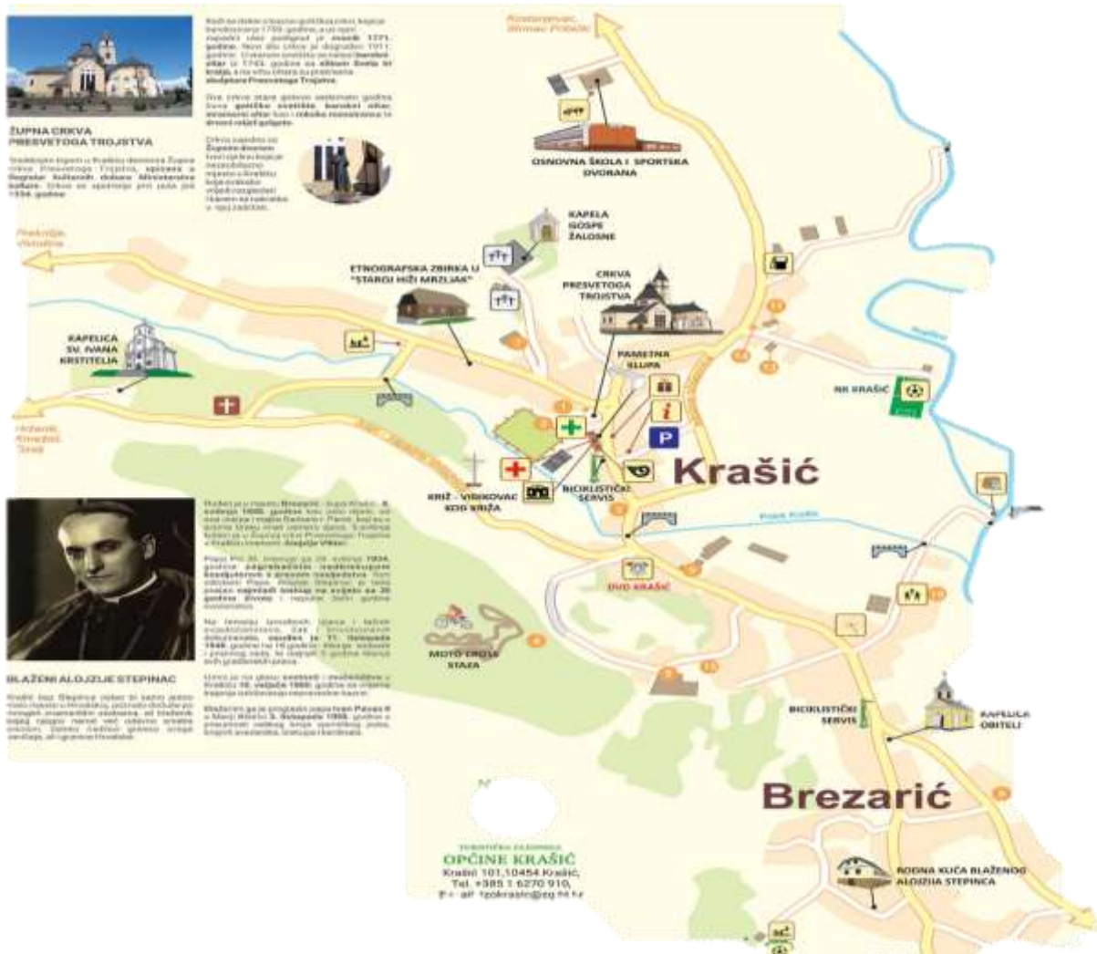
Slika 3. Turistička karta Krašića