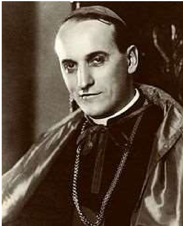
Slika 5. Blaženi kardinal Alojzije Stepinac

Njegova hrabra obrana ljudskih prava i suosjećanje prema žrtvama rata i progona učinila ga je poznatim i poštovanim širom svijeta. Međutim, njegova kritika komunističkog režima i skrb za prognane osobe doveli su ga u konflikt s vlastima, a 1946. godine bio je uhićen i suđen na montiranom procesu. Osuđen je na 16 godina zatvora, a proveo je pet godina u kućnom pritvoru u Krašiću.