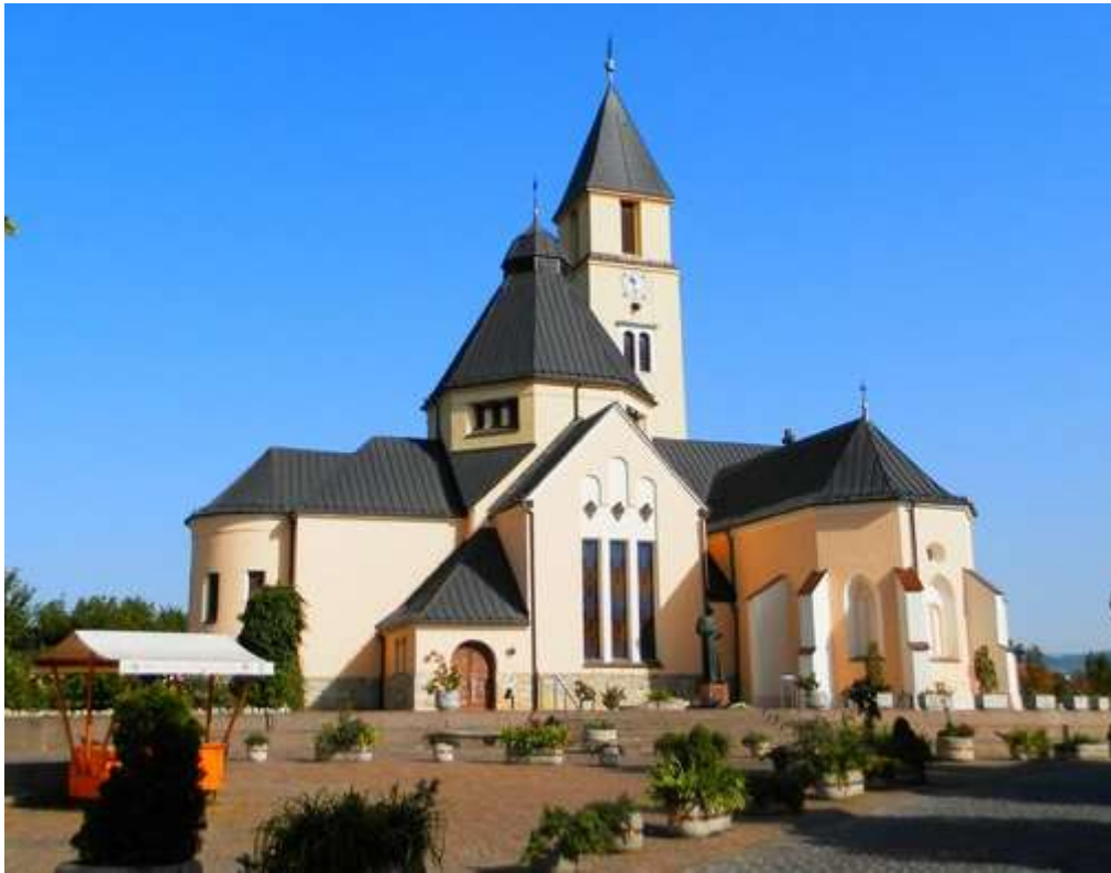
Slika 4. Crkva Presvetog Trojstva u Krašiću

Božje Trsatse, Svetište Majke Božje od Krasna, Svetište Gospe Sinjske, Svetište Predragocjene Krvi Isusove u Ludbregu i mnoga druga.