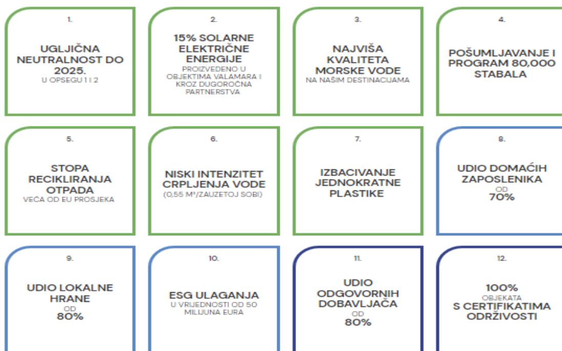
Slika 2 12 ciljeva održivosti Valamar Riviere do 2025. godine

kljente, ali i svoju ekonomsku stabilnost. Naime, ova je tvrtka 2021. godine objavila strategiju održivosti te sveukupno 12 ključnih ciljeva održivog poslovanja koji se planiraju ostvariti do 2025. godine. Ciljevi uključuju dostizanje ugljične neutralnosti, uštedu električne energije, odnosno proizvodnju 15% solarne energije, zaštitu mora, pošumljavanje stotina hektara u svojim destinacijama, zapošljavanje i zadržavanje domaćih radnika, baziranje 80% sveukupne nabave od odgovornih dobavljača te postizanje certifikata održivosti svih svojih objekata.