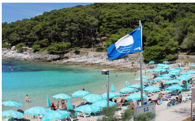
Slika 1 Prikaz hrvatske plaže nagrađene plavom zastavom

Prema podacima iz 2021. godine, 68 hrvatskih plaža i 30 marina ima Plave zastave, simbole ekološke osviještenosti i održivog razvijanja. Ove su zastave jedan od poticaja turistima kod biranja odmorišne destinacije. Simbol zastave se smatra važnim pokazateljem hrvatskog održivog turizma, budući da su Jadransko more i plaže među glavnim motivima turističkih dolazaka. 21