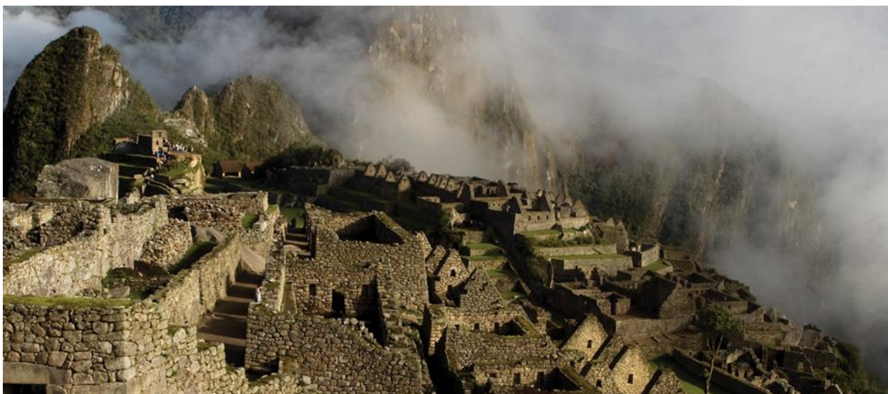
Slika 3 Machu Picchu – drevni grad Inka

„Sustainable Machu Picchu“ suradnja je i inicijativa peruanske vlade i udruge Inkaterra koja u fokus stavlja pravilno zbrinjavanje otpada. Inicijativa je provedena kroz sveukupno četiri projekta 25 :