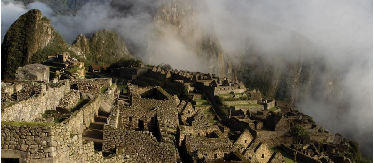
Slika 3 Machu Picchu – drevni grad Inka

„Sustainable Machu Picchu“ suradnja je i inicijativa peruanske vlade i udruge Inkaterra koja u fokus stavlja pravilno zbrinjavanje otpada. Inicijativa je provedena kroz sveukupno četiri projekta 25 :