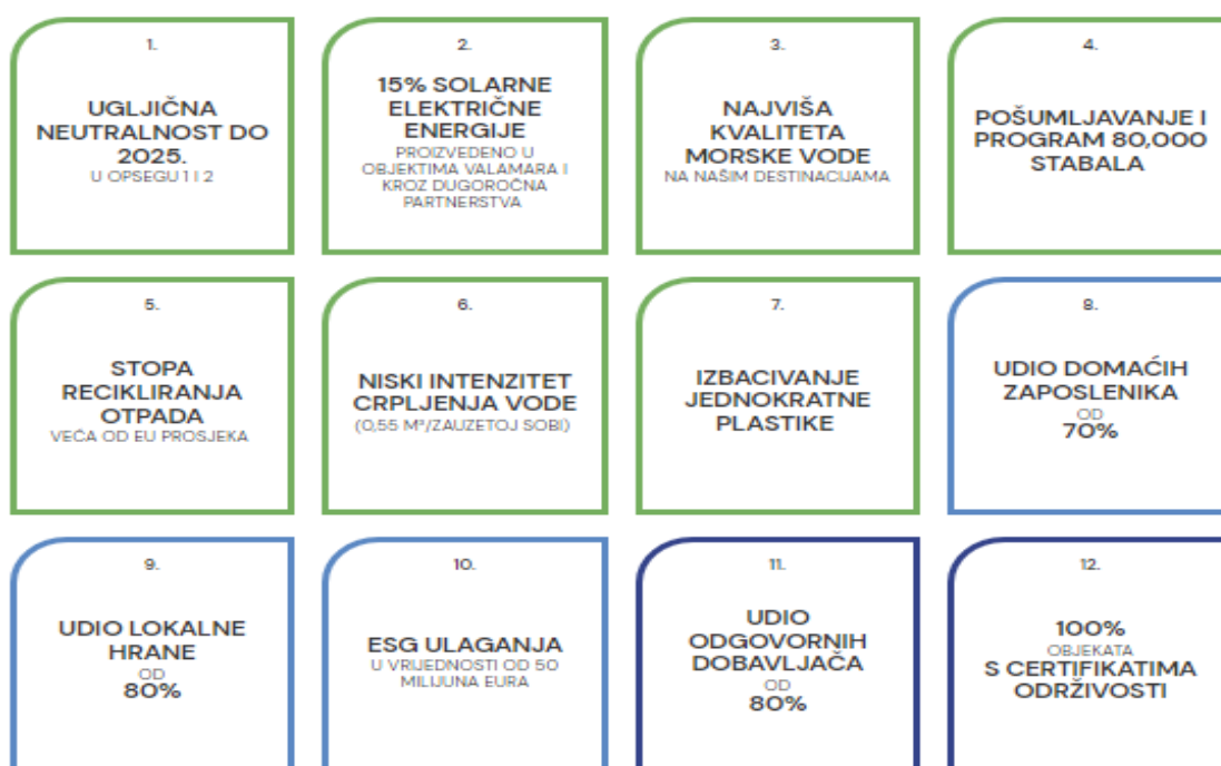
Slika 2 12 ciljeva održivosti Valamar Riviere do 2025. godine

kljente, ali i svoju ekonomsku stabilnost. Naime, ova je tvrtka 2021. godine objavila strategiju održivosti te sveukupno 12 ključnih ciljeva održivog poslovanja koji se planiraju ostvariti do 2025. godine. Ciljevi uključuju dostizanje ugljične neutralnosti, uštedu električne energije, odnosno proizvodnju 15% solarne energije, zaštitu mora, pošumljavanje stotina hektara u svojim destinacijama, zapošljavanje i zadržavanje domaćih radnika, baziranje 80% sveukupne nabave od odgovornih dobavljača te postizanje certifikata održivosti svih svojih objekata.