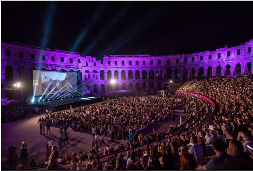
Slika 4. 66. Pulski festival, izvor: https://www.tportal.hr