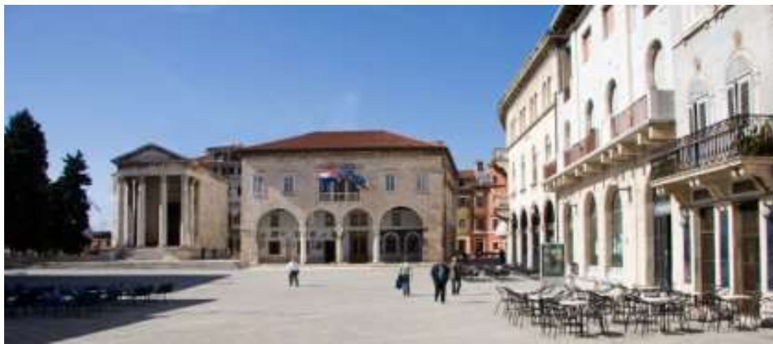
Slika 5. Forum, izvor: https://www.pulainfo.hr/

i hram cara Augusta i Rome, pored njih se nalazilo i Dijanino kupalište. Danas na trgu možemo vidjeti naslage skoro svih povijesnih i graditeljskih razdoblja Pule. 6