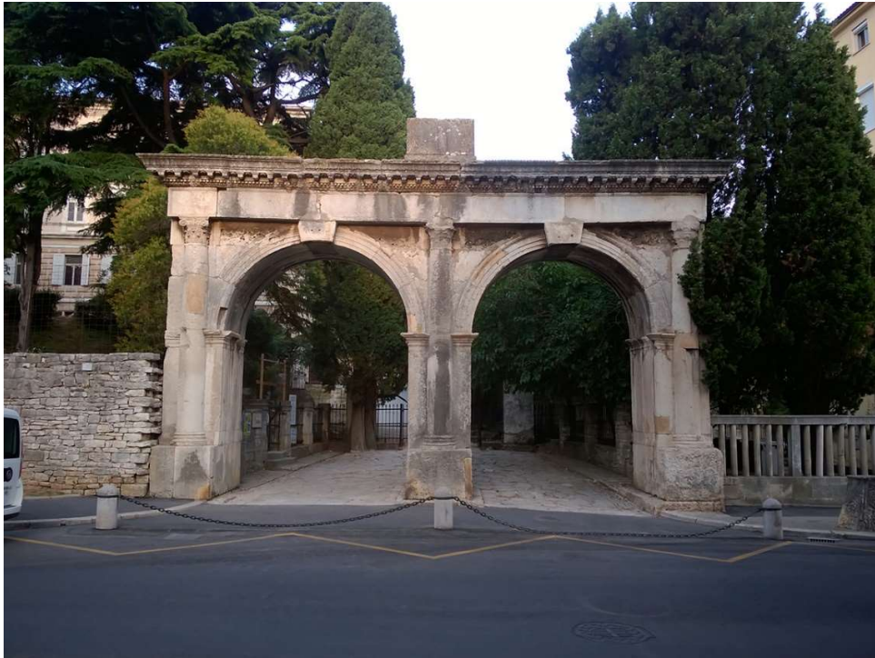
Slika 9. Dvojna vrata

su gospodari Pule crpili vodu za opskrbu grada Pule. Izvan grada uz ceste postojala je i antička nekropola sa sarkofazima, natpisima, statuama i građevinama, koja se nalazila ispred Dvojnih vrata. U srednjem vijeku ovakvi spomenici služili su kao materijal za gradnju, a oni koji su opstali premješteni su u pulski Arheološki muzej. Osim antičke nekropole ispred Dvojnih vrata pronađeni su i dijelovi osmerokutne grobne građevine i sačuvani su bedemi s kulama te Herkulova vrata, koja se nalaze između Dvojnih vrata i trga Giardini. Kroz Dvojna vrata prolazilo se za scenski rimski teatar iza Arheološkog muzeja. 11