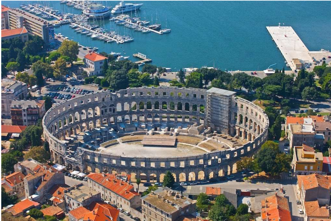
Slika 2. Arena u Puli, izvor: https://crovista.com/