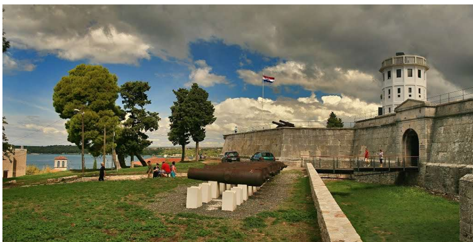
Slika 11. Kaštel u Puli

U kružnoj ulici u gornjem dijelu grada nalazi se uspon koji vodi do vrha brežuljka, a na tom brežuljku nalazi se utvrda četvrtastog tlorisa s naglašenim ugaonim zašiljenim bastionima, sagrađena 1630. Antoine De Ville bio je francuski vojni arhitekt po čijim je nacrtima sagrađen kaštel, a zatražen je od strane mletačke vlade zbog bolje zaštite grada i njegove luke koja je imala izuzetan utjecaj u pomorskom prometu. U početku gradnje materijali koji su se koristili bili su kameni blokovi koji su pronađeni podno porušenog rimskog kazališta Zaro. U ono vrijeme obrambeni sustav uključivao je još i obrambeni prsten koji sadrži obrambeni nasip glasijske, srednjovjekovne i rimske gradske zidine, stari obrambeni toranj te promatračnicu i svjetionik. Nakon umetanja dviju vodosprema u njezinu strukturu, gubi se obrambeni značaj utvrde. Građevina je imala najprije obrambenu funkciju, a danas se u njoj nalazi Povijesni i pomorski muzej Istre. Kaštel je barokna utvrda koja se nalazi na vrhu pulskog brežuljka i dala je značaj gradu te je od XVII. stoljeća najvažnija prostorna dominanta. Također je bila i zadnja poznata kamena građevina skoro u potpunosti očuvana, koja se nalazila na mjestu gdje je bila dominantna obrambena uloga. 13