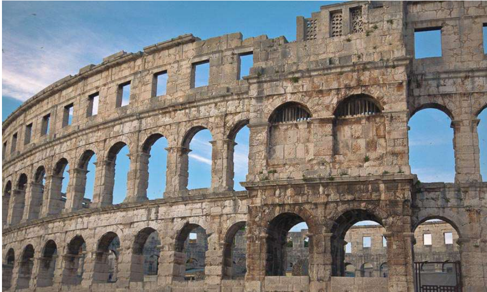
Slika 1. Arena-Amfiteatar, izvor: https://www.pulainfo.hr/