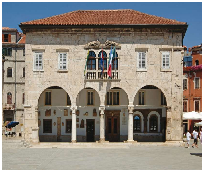
Slika 7. Gradska vijećnica u Puli, izvor: https://www.istria-culture.com/

nastanak vijećnice 1296. Najstarije faze graditeljskog razvitka su stilovi gotičkog i romaničkog razdoblja koji se povezuju na istočnom zidu građevine. Na uglovima i stupovima građevine uočava se renesansna skulptura Telamona i Sirene. Prozori građevine napravljeni su u baroknom stilu, dok su arhitektonski dijelovi na palači napravljeni najkasnije. Zbog učestalih nadogradnji došlo je do stvaranja građevine koja označava sklop arhitektonskih stilova od romanike do baroka. U današnje vrijeme gradska vijećnica u cijelosti je restaurirana. 8