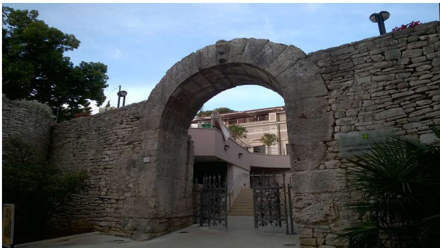
Slika 10. Herkulova vrata

Herkulova vrata nalaze se između dvije srednjovjekovne okrugle kule, to su arhitektonska vrata koja sadrže jednostavni lučni otvor koji je izgrađen od neprofiliranih kamenih blokova, a podignuta su oko polovice 1. stoljeća. Vrata su visine oko 4 metra, širina vrata iznosi 3,60 metar, a ime su dobila radi reljefnog lika Herkula te se uz sam lik nalazi još i njegova toljaga. Na vratima se još nalazi i uklesani natpis koji je u rimsko doba grada jedan od najstarijih, a spominje imena rimskih činovnika pod imenom Lucije Kalpurnije Pizon i Lucije Kasije Longin. Njih dvojicu poslao je rimski Senat u Pulski zaljev da sagrade koloniju i tako je nastala Pula s njezinim gradskim značajkama. Herkulova vrata poznata su još i po imenu Rimska vrata, a nalazila su se pokraj Hekrulovog hrama; u hram su dolazili gladijatori prije borbe da bi se preporučili za uspjeh u igrama mitskome heroju. Za vrijeme vladavine Rima Herkulova vrata nisu bila od velike važnosti jer nisu bila raskošno dekorirana. Herkulova vrata u 20. stoljeću očišćena su i danas se kroz njih ulazi u Zajednicu Talijana u Puli, poznatiju kao Circolo. 12