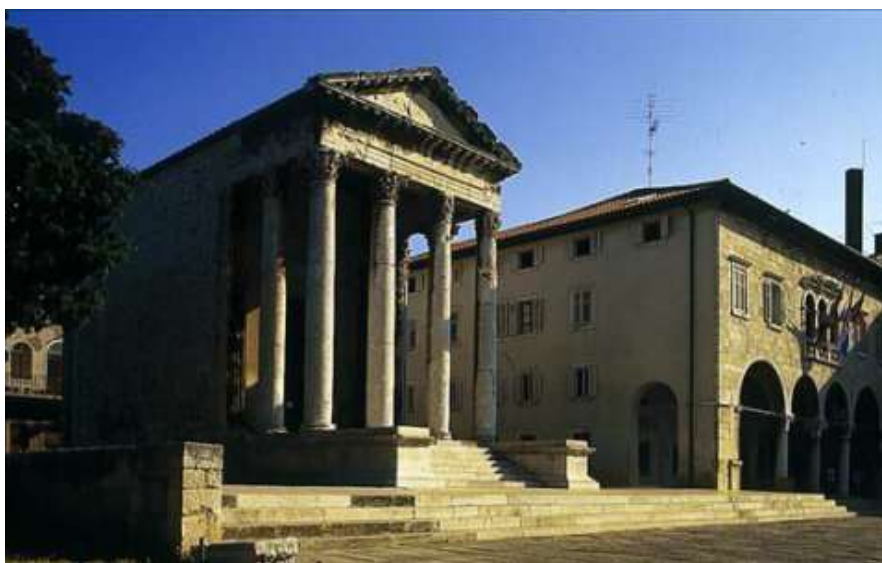
Slika 6. Augustov hram, izvor: https://www.pulainfo.hr/

God. 1914. Franjo Horvat bilježi svoje dojmove pred Augustovim hramom: „Evo, lijepi korintski stupovi drže pročelje. U ogradi oko hrama leže ostatci kamenih spomenika. Uđi dobri čovječe!: kao da kaže netko stojeći kraj ulaza i kod toga malo otvori togu.” 7