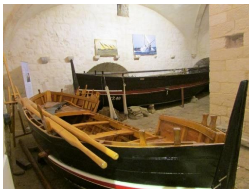
Slika 5 Ribarski muzej u Komiži