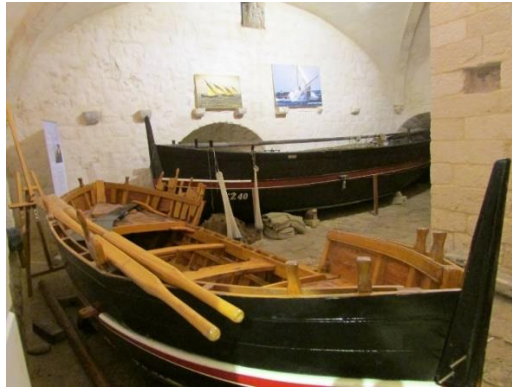
Slika 5 Ribarski muzej u Komiži