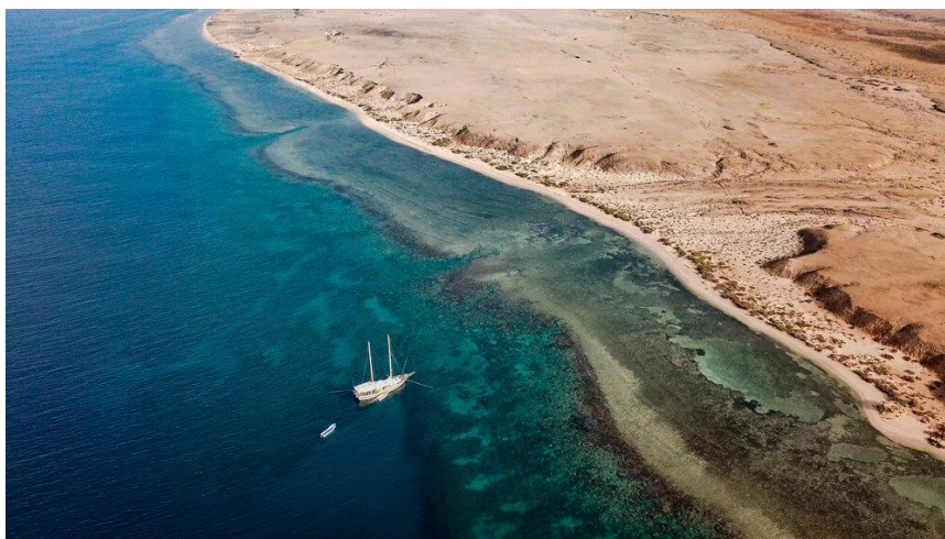
Slika 3 Sudanski ribolov: Nubijska ravnica