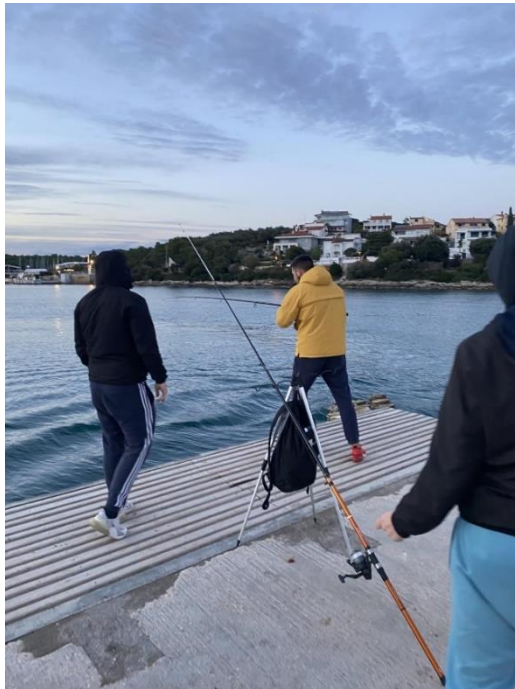
Slika 1 Pecanje s obale

Ribolov s obale smatramo hobbijem. Jedino je potrebno kupiti dozvolu za rekreativni ribolov i bilo tko može pecati. S obale možemo loviti na nekoliko načina, a to su lov na dubinu, lov na površini i varaličarenje. Znanje koje je potrebno za ribolov s obale su poznavanje vezanja opreme i pripremanja opreme za ribolov, poznavanje terena na kojem se lovi zbog pripreme pogodne opreme i mamca i poznavanje ribljih vrsta.