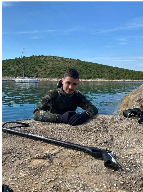
Slika 2 Podvodni ribolov

Zbog zakona o zaštiti morskih životinja potrebno je raspoznavanje životinjskih vrsta ribe, glavonožaca školjkaša i ostalog iz razloga jer se uhvaćenu ribu ne može živu vratiti natrag u more. Postoji više vrsta zakona u podvodnom ribolovu, a jedan od njih je da svaka riba koja se ne smatra invazivnom vrstom ima određenu dužinu (mjereno od usta ribe do kraja repne peraje) ispod koje ju je ilegalno loviti. Stoga podvodni ribolovac mora dobro procijeniti da li riba koju gađa prelazi legalnu dužinu. Isti zakon vrijedi i za školjke i glavonošce. Postoji zakon koji ograničava ulov rjeđih vrsta ribe što znači da jedan ribolovac može uloviti određeni broj primjeraka te vrste ribe koje isto moraju prelaziti određenu dužinu tijela. Ti zakoni su na vrijednosti kako bi se zaštitila riblja mlad od izlova.