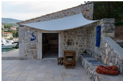
Slika 6 Kućica od ribari