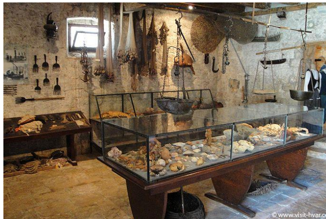
Slika 4 Ribarski muzej u Vrboskoj