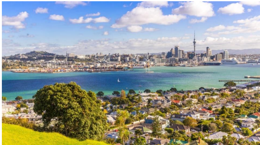
Slika 17. Grad Auckland