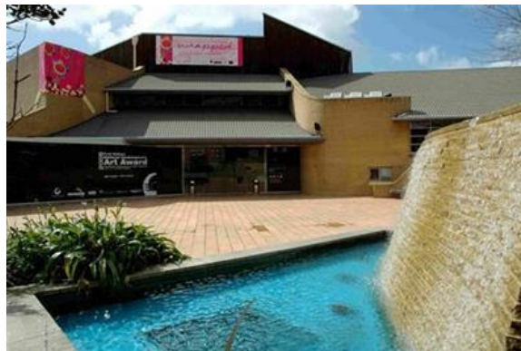
Slika 14. Muzej Waikato