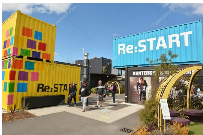
Slika 22. Re:START Mall- trgovački centar