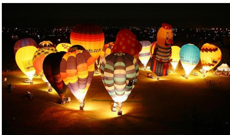
Slika 16. Balloons over Waikato