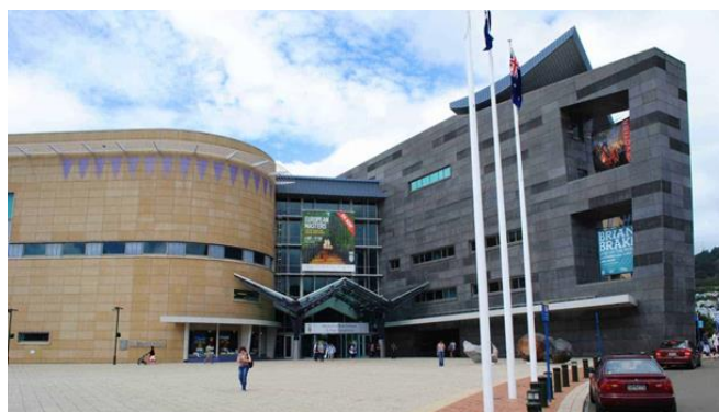
Slika 13. Muzej Te Papa