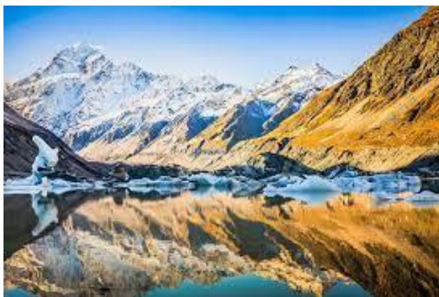
Slika 9. Nacionalni park Mount Cook