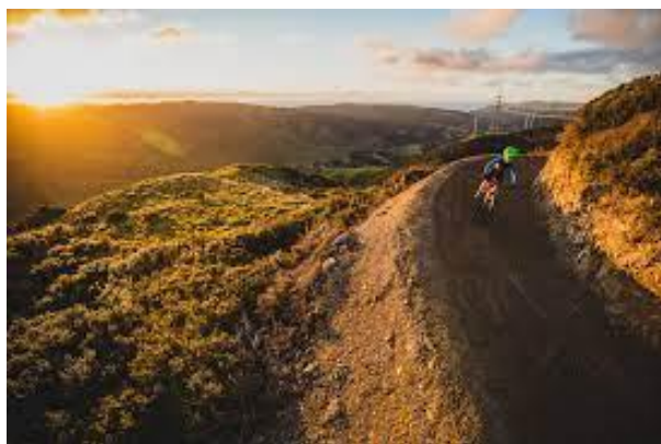
Slika 20. Makara Peak Mountain Bike Park