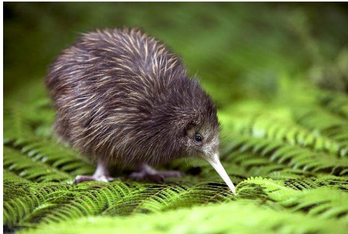
Slika 6. Novozelandska ptica Kiwi