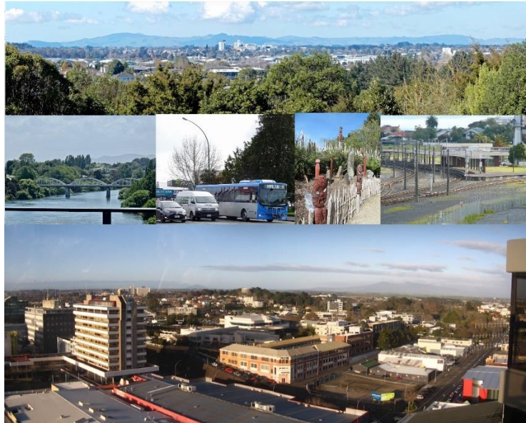
Slika 23. Grad Hamilton