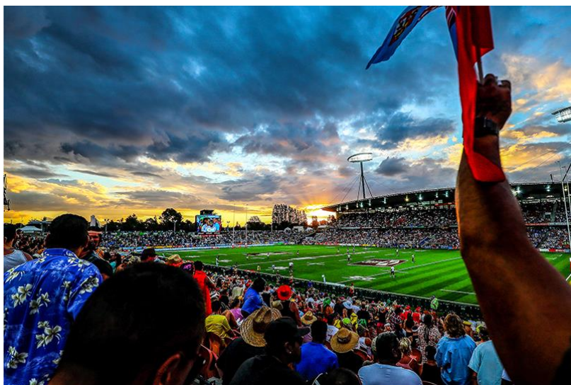
Slika 25. Stadion Waikato