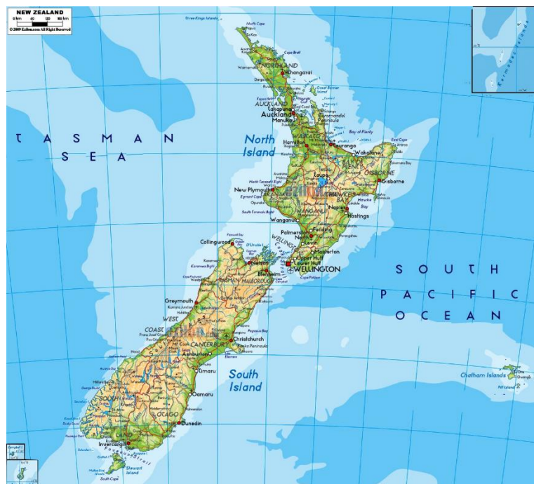
Slika 1. Geografski položaj Novog Zelanda