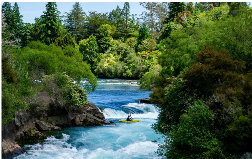
Slika 4. Rijeka Waikato (najdulja rijeka Novog Zelanda)