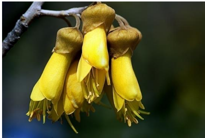
Slika 5. Kowhai novozelandski nacionalni cvijet