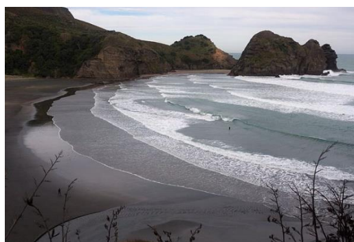
Slika 18. Plaža sa crnim pijeskom- Auckland