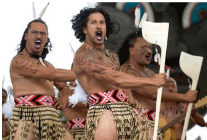
Slika 15. Maori- narod Polinezije