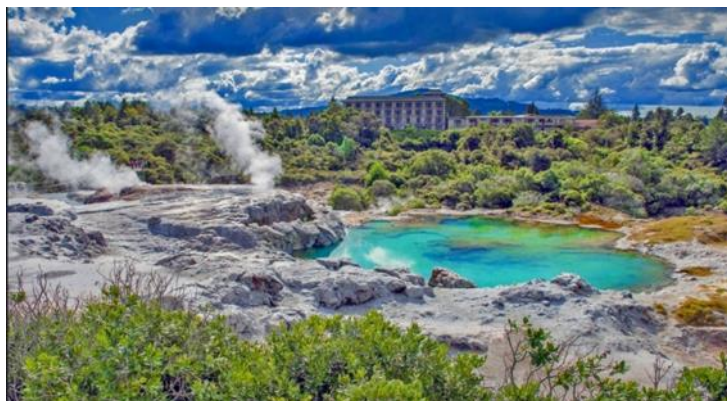
Slika 12. Regija Rotorua