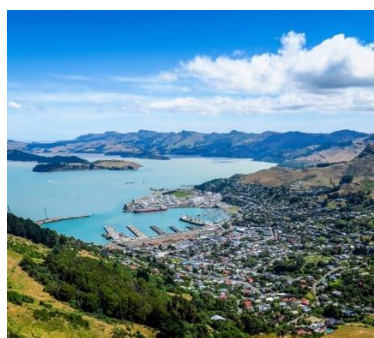
Slika 21. Grad Christchurch