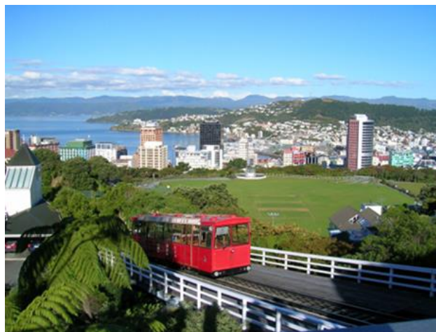
Slika 19. Grad Wellington