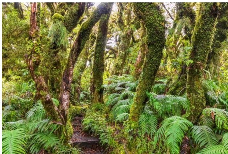
Slika 10. Šuma Waipoua