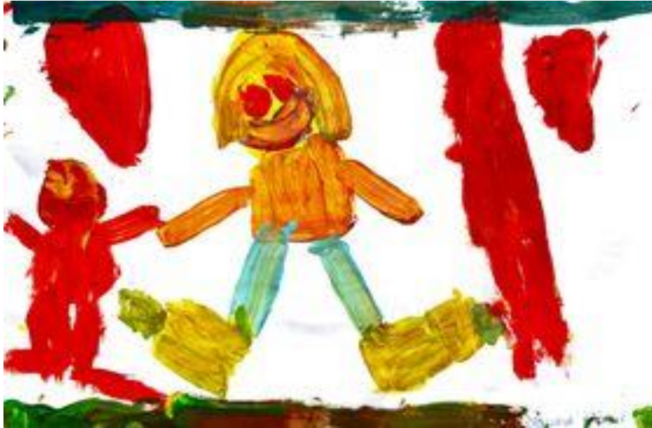
Slika 10. Dječji uradak (5 god. i 9 mj.), Prikaz čovjeka, tempera.