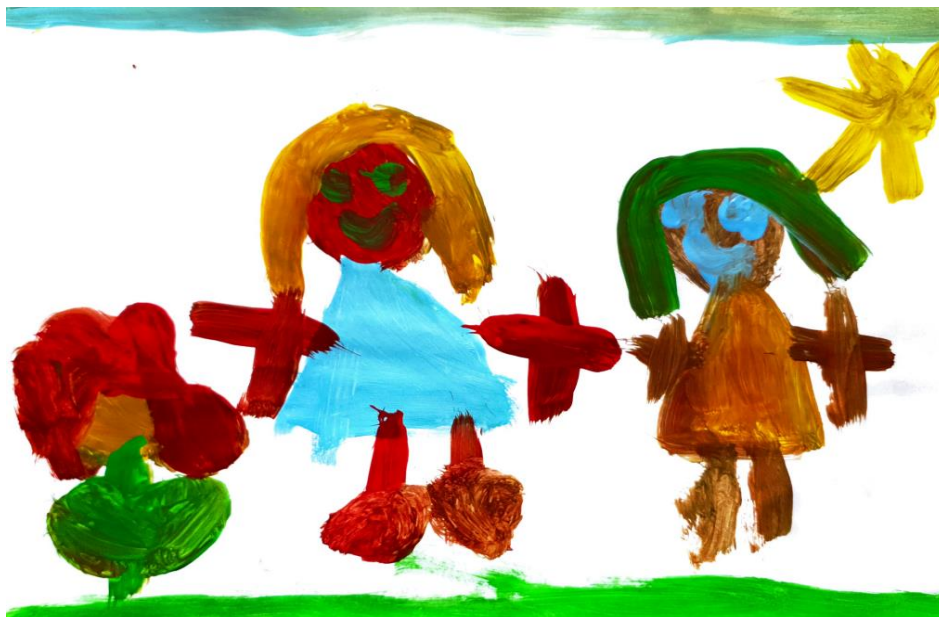
Slika 8. Dječji uradak (5 god. i 5 mj.), Prikaz čovjeka, tempera.

Ovaj crtež djeteta ukazuje na to da se dijete nalazi u drugoj fazi razvoja, poznatoj kao faza sheme. Primjećujemo da su ruke i noge prikazane bez detaljnih oblika tijela, dok su na licu prikazane oči, usta i kosa. Tijelo je prikazano kao jednostavan krug, a prsti su prikazani kao jednostavni plus. Osoba je prikazana vertikalno. U crtežu također primjećujemo i druge objekte kao što su duga, sunce i cvijet, a to nam govori o onome što je važno za dijete. Također, dijete prepoznaje i zna napisati pojedina slova koja čine njegovo ime. Osim toga, zbog detalja na kosi i horizontalne crte na dnu papira koja označava prikaz prostora (trava, zemlja), možemo zaključiti da se dijete također razvija prema trećoj fazi razvoja, poznatoj kao razvijena shema (Herceg, Rončević i Karlavaris, 2010). U crtežu također primjećujemo prikaz osobe nazvanog “glavo-noga”, što znači da je glava prikazana kao veliki krug, a oči su predstavljene manjim krugovima, dok linije predstavljaju ruke i noge (Belamarić, 1986). Dijete također koristi osnovne boje poput crvene, plave i žute, te sekundarnu boju zelenu (Jakubin, 1990).