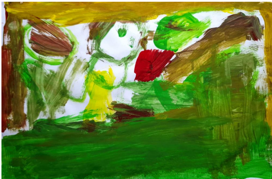
Slika 13. Dječji uradak (5 god i 11 mj.), Prikaz čovjeka, tempera.

zrakama i cvijet sa stabljikom, laticama i tučkom iz čega možemo zaključiti da dječji rad ima karakteristike i treće razvojne faze, faze razvijene sheme i cjelovitosti prikaza motiva. Dok prikaz prostora uočavamo u gornjoj i donjoj liniji koja predstavlja zemlju i nebo te je karakteristika četvrte faze razvoja, faze oblika i pojava (Herceg, Rončević i Karlavaris, 2010). Na ovoj slici također uočavamo plavu, žutu i crvenu boju koje su osnovne boje; zelenu i narančastu sekundarnu boju; te razne nijanse žute boje od svijetlih do tamnijih nijansa koje pripadaju tercijarnim bojama. U ovom dječjem prikazu prevladava žuta boja.