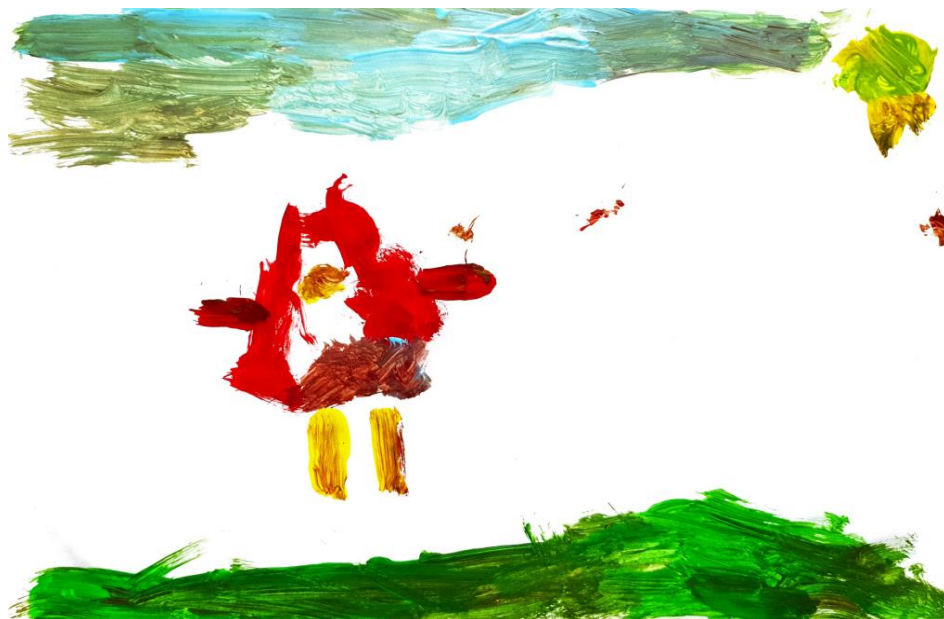
Slika 5. Dječji uradak (4 god. i 4 mj.), Prikaz čovjeka, tempera.

Ovaj dječji uradak ukazuje na to da se dijete nalazi u drugoj razvojnoj fazi, poznatoj kao faza sheme. Karakteristike ove faze uključuju okruglu glavu bez kose i ušiju, a oči, nos, usta i tijelo prikazani su u obliku kruga. Čovjek je prikazan vodoravno, uz dodatak sunca, oblaka, balona i drugih elemenata. Također se mogu primijetiti karakteristike treće razvojne faze, kao što su detalji trepavica. Dijete također obraća pažnju na debljinu ruku i nogu te je dodalo balon kao simbol prijateljstva što karakterizira cjelovitost prikaza motiva, a prikaz prostora karakteriziraju dvije vodoravne crte jedna na vrhu crteža koja prikazuje nebo, a druga na dnu koja prikazuje travu. Za prikazivanje očiju i nosa, dijete koristi točke kao likovni element, dok za ruke i noge koristi linije. U dječjem radu možemo vidjeti crvenu, malo žute i plavu kao osnovne boje, te narančastu i zelenu kao sekundarne boje. Također postoje nijanse smeđe kao tercijarne boje. Radom dominira toplo-hladni kontrast, uključujući crvenu i narančastu boju (Jakubin, 1990).