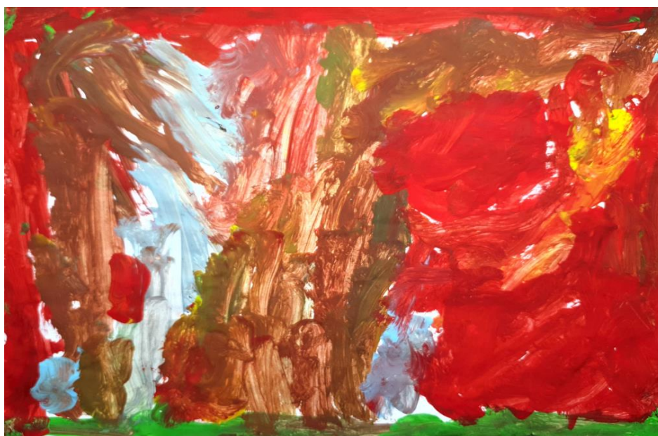
Slika 6. Dječji uradak (4 god. i 10 mj.), Prikaz čovjeka, tempera.

Ovaj dječji rad ukazuje na to da se dijete nalazi u drugoj razvojnoj fazi, poznatoj kao faza sheme. Karakteristike ove faze uključuju prikaz ruku i nogu bez oblika tijela, prikaz tijela kao pravokutnika i polukruga. Također, ruke i noge prikazane su bez debljine, a čovjek je horizontalno prikazan uz dodatak trave, neba i sunca, što ukazuje na cjelovitost prikaza motiva. Na radu čovjeka nedostaju prikazi očiju, usta i nosa. Možemo primijetiti prikaz prostora kroz dvije vodoravne crte: jedna na dnu crteža koja predstavlja travu, dok druga na vrhu crteža predstavlja nebo, što karakterizira treću razvojnu fazu, odnosno fazu razvijene sheme (Herceg, Rončević i Karlavaris, 2010). Dijete koristi linije za prikaz ruku i nogu (Jakubin, 1990). U dječjem crtežu možemo primijetiti osnovne boje poput žute i crvene, dok se zelena boja pojavljuje kao sekundarna boja. Plava boja se prikazuje kroz nijanse i stoga spada među tercijarne boje. Tercijarne boje uključuju nijanse smeđe, sivoplave i svijetloplave boje. Na crtežu dominiraju crvena i zelena boja (Jakubin, 1990).