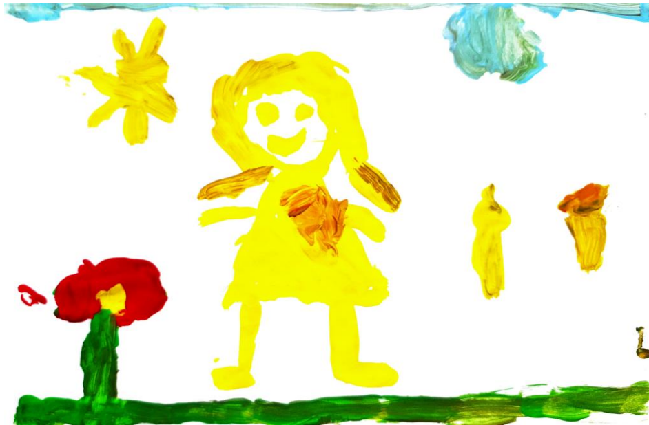
Slika 12. Dječji uradak (5 god. i 11 mj.), Prikaz čovjeka, tempera.

na dnu koja prikazuje travu. Za prikazivanje očiju i nosa, dijete koristi točke kao likovni element, dok za ruke i noge koristi linije. U dječjem radu možemo vidjeti crvenu, malo žute i plavu kao osnovne boje te narančastu i zelenu kao sekundarne boje. Također postoje nijanse smeđe, plave i zelene kao tercijarne boje. Radom dominira zelena i plavo-zelena boja. (Jakubin, 1990).