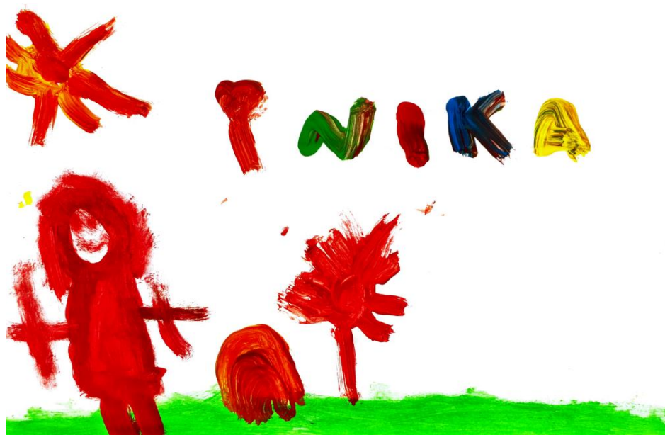
Slika 7. Dječji uradak (5 god. i 2 mj.), Prikaz čovjeka, tempera.

Ovaj dječji crtež ukazuje na to da se dijete nalazi u prvoj razvojnoj fazi, poznatoj kao faza sheme. Karakteristike prve razvojne faze obuhvaćaju pravolinijske, manje i veće kružne šare koje ne predstavljaju konkretne objekte (Herceg, Rončević i Karlavaris, 2010). Za prikaz duge, dijete koristi linije. Na crtežu se mogu primijetiti male količine žute, plave i crvene boje kao osnovnih boja te zelene boje kao sekundarne boje. Također postoje različite nijanse smeđe boje, plavosive i maslinasto zelene boje, s primatima crvene primarne boje u crtežu (Jakubin, 1990).