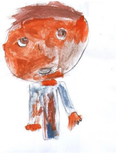
Slika 3. Primjer, Prikaz čovjeka