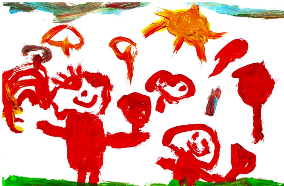
Slika 4. Dječji uradak (4 god. i 3 mj.), Prikaz čovjeka, tempera.

Riječ “analizirati” izvedena je iz grčkog glagola analyo , koji također znači istražujem (Huzjak, 2002). Interpretacija četiri različite komponente kreativne kvalitete likovnog rada čini osnovu za analizu likovnih radova za djecu predškolske dobi. Stoga u nastavku rada slijedi prikaz i način analize dječjih likovnih uradaka nastalih na likovnoj aktivnosti “Prikaz čovjeka” (Herceg, Rončević, Karlavaris, 2010).