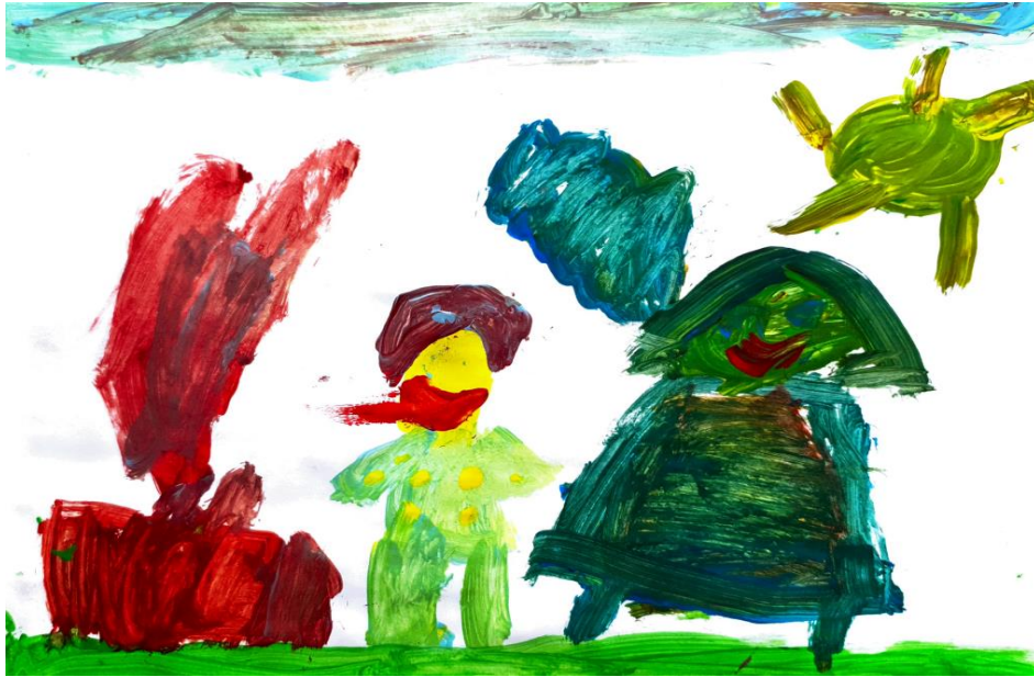
Slika 11. Dječji uradak (5 god. i 11 mj.), Prikaz čovjeka, tempera.

prevladavaju crvena i narančasta boja, koje karakteriziraju toplo-hladnim kontrastom (Jakubin, 1990).