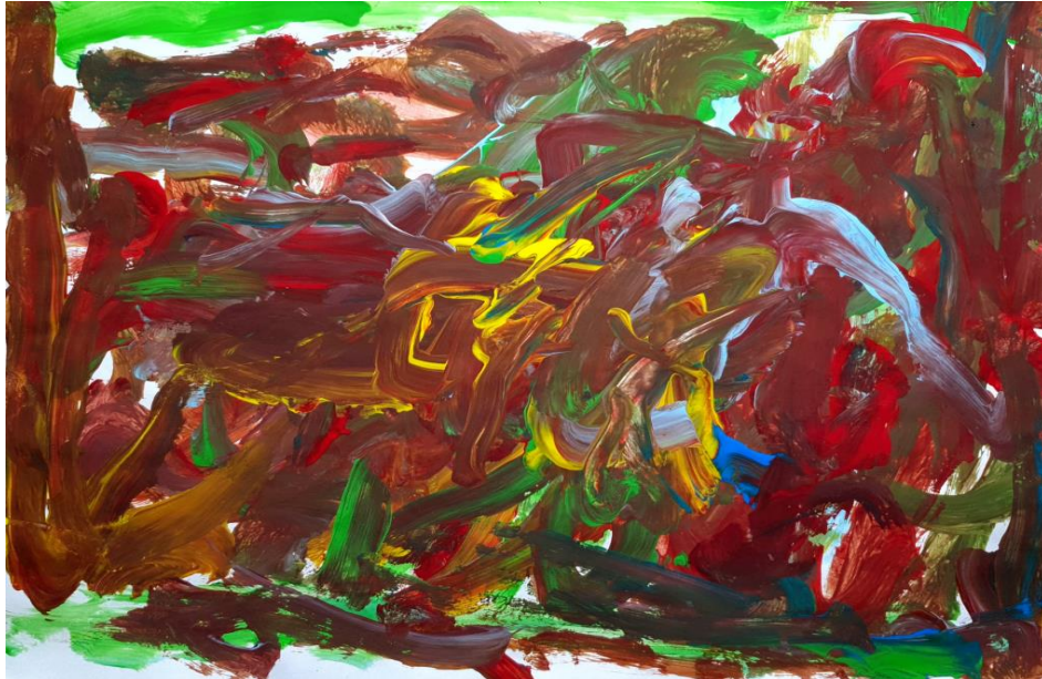
Slika 9. Dječji uradak (5 god. i 7 mj.), Prikaz čovjeka, tempera.