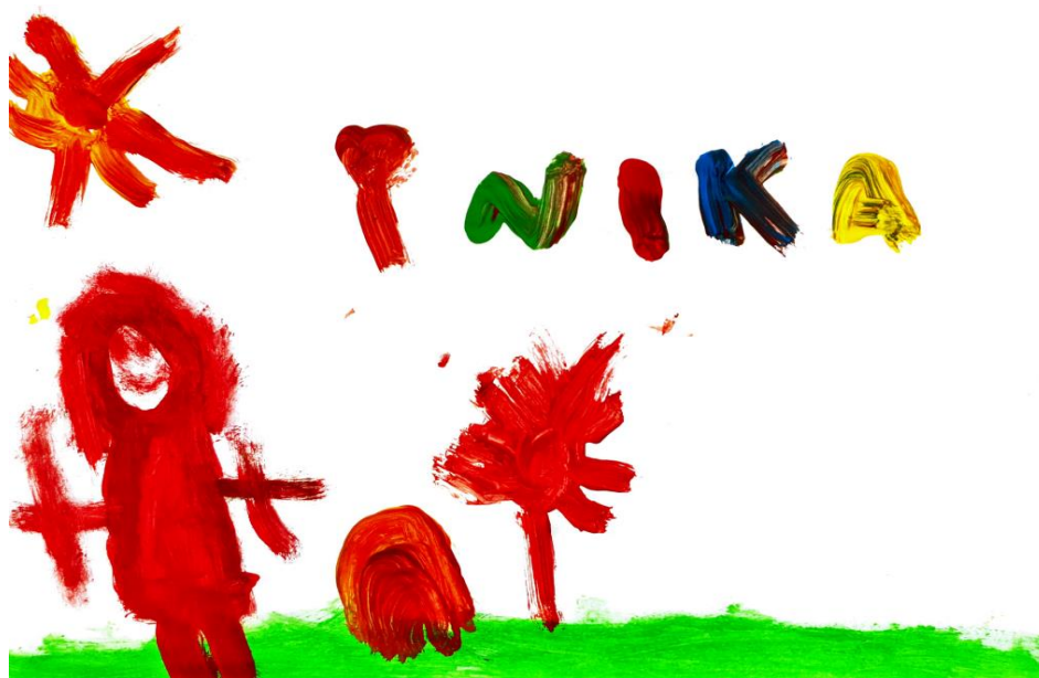
Slika 7. Dječji uradak (5 god. i 2 mj.), Prikaz čovjeka, tempera.

Ovaj dječji crtež ukazuje na to da se dijete nalazi u prvoj razvojnoj fazi, poznatoj kao faza sheme. Karakteristike prve razvojne faze obuhvaćaju pravolinijske, manje i veće kružne šare koje ne predstavljaju konkretne objekte (Herceg, Rončević i Karlavaris, 2010). Za prikaz duge, dijete koristi linije. Na crtežu se mogu primijetiti male količine žute, plave i crvene boje kao osnovnih boja te zelene boje kao sekundarne boje. Također postoje različite nijanse smeđe boje, plavosive i maslinasto zelene boje, s primatima crvene primarne boje u crtežu (Jakubin, 1990).