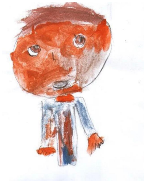
Slika 3. Primjer, Prikaz čovjeka