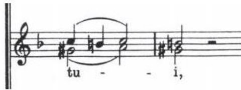
Notni primjer 11.