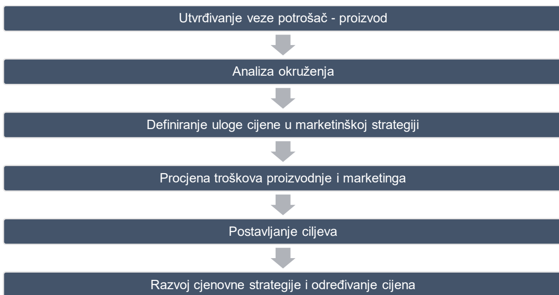
Slika 2. Strategijski pristup formiranju cijena