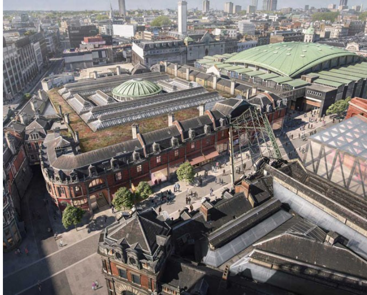
Slika 3 Muzej grada Londona – West Smithfield