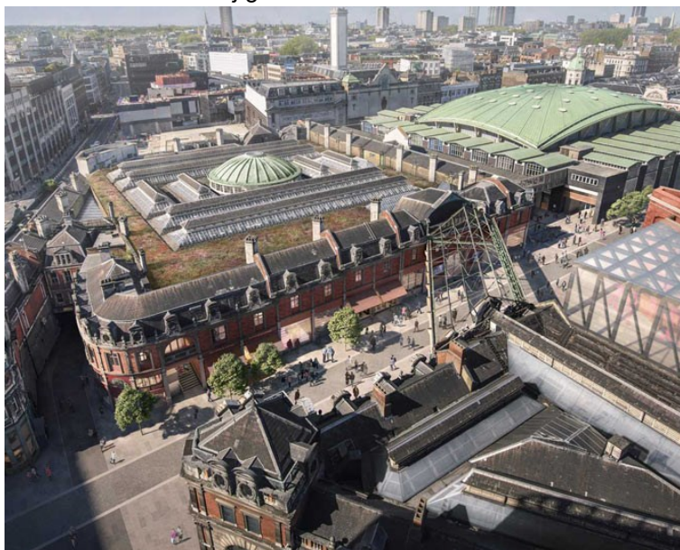
Slika 3 Muzej grada Londona – West Smithfield