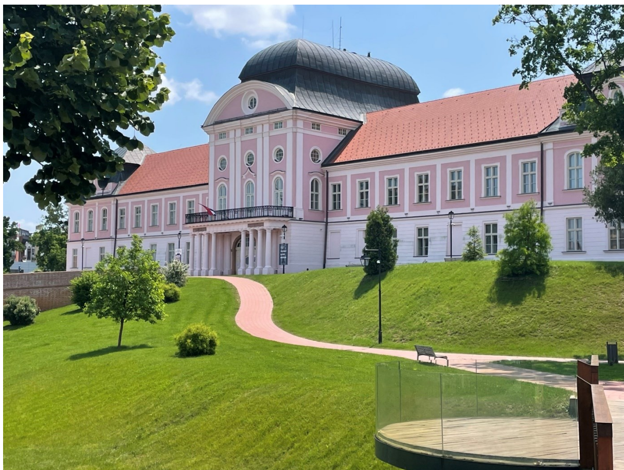
Slika 4 Gradski muzej Virovitica