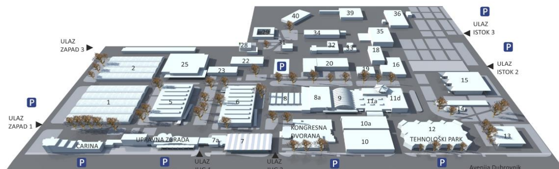
Slika 1. Maketa Zagrebačkog Velesajma

Sajmovi su mjesta inovacija i razlika, mjesta društvenosti, spoznaje vlastitih kvaliteta i mogućnosti. 177 Izgradnja Zagrebačkoga velesajma bila je bitna ponajprije zbog gospodarske veze Jugoslavije sa zemljama istočnog bloka iza željezne zavjese i sa zemljama srednje i zapadne Europe. Velesajam je bio poveznica između zemalja koje politički nisu bile u najboljim odnosima, a upravo je zato projekt izgradnje bio sveobuhvatan. 178 Zagrebački velesajam s bogatom poviješću zauzima značajno mjesto u gospodarskome životu Zagreba, pružajući prostor za susret sa suvremenim tehnološkim inovacijama i novitetima. 179 Božidar Rašica bio je zadužen za projektiranje pojedinačnih paviljona velesajma (paviljon Austrije iz 1958., paviljon Autosalon 1961., paviljon Ujedinjene Arapske Republike, SSSR-a, Italije i Brazila iz 1965., paviljon drvne industrije iz 1970., kemijski paviljon 1971., te i za paviljon Exportdrva iz 1972. godine). Paviljon Demokratske Republike Njemačke iz 1964. ozbiljna je, zatvorena staklena neprozirna zgrada s čvrstom konstrukcijom od armiranoga betona. 180 Osim paviljona 1964. Rašica radi i eksperimentalni objekt „ljuska“ koji predstavlja nadstrešnicu u obliku hiperboloida. 181