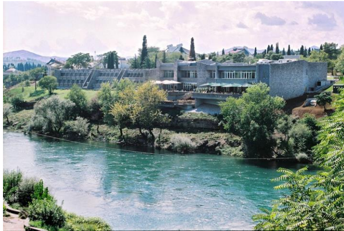
Slika 4. Hotel Podgorica