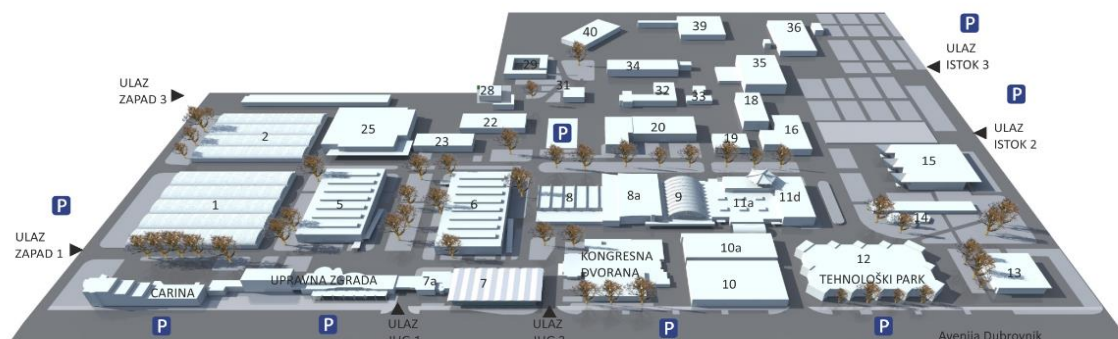
Slika 1. Maketa Zagrebačkog Velesajma

Sajmovi su mjesta inovacija i razlika, mjesta društvenosti, spoznaje vlastitih kvaliteta i mogućnosti. 177 Izgradnja Zagrebačkoga velesajma bila je bitna ponajprije zbog gospodarske veze Jugoslavije sa zemljama istočnog bloka iza željezne zavjese i sa zemljama srednje i zapadne Europe. Velesajam je bio poveznica između zemalja koje politički nisu bile u najboljim odnosima, a upravo je zato projekt izgradnje bio sveobuhvatan. 178 Zagrebački velesajam s bogatom poviješću zauzima značajno mjesto u gospodarskome životu Zagreba, pružajući prostor za susret sa suvremenim tehnološkim inovacijama i novitetima. 179 Božidar Rašica bio je zadužen za projektiranje pojedinačnih paviljona velesajma (paviljon Austrije iz 1958., paviljon Autosalon 1961., paviljon Ujedinjene Arapske Republike, SSSR-a, Italije i Brazila iz 1965., paviljon drvne industrije iz 1970., kemijski paviljon 1971., te i za paviljon Exportdrva iz 1972. godine). Paviljon Demokratske Republike Njemačke iz 1964. ozbiljna je, zatvorena staklena neprozirna zgrada s čvrstom konstrukcijom od armiranoga betona. 180 Osim paviljona 1964. Rašica radi i eksperimentalni objekt „ljuska“ koji predstavlja nadstrešnicu u obliku hiperboloida. 181