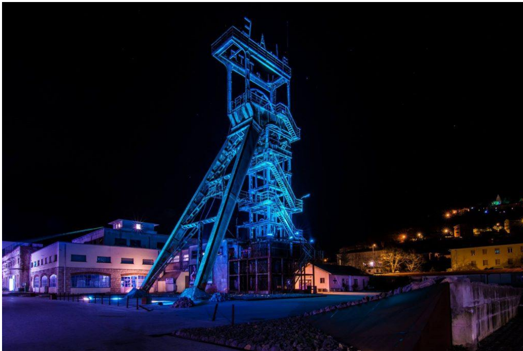
Slika 4. Obnovljeni "šoht" iz 2021.

Danas, grad Labin se često prisjeća tih događaja kroz razne oblike spomenika, muzeja i manifestacija. To je postalo ključno kulturno i povijesno obilježje grada, koje ga povezuje s važnim trenucima otpora i solidarnosti. 33 Labinska republika utemeljila je vrijednosti zajedništva, jednakosti i borbe za pravdu koje su ostale ukorijenjene u lokalnoj kulturi i identitetu.