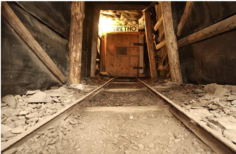
Slika 1. Replika rudnika u Muzeju u Labinu s natpisom "Sretno".

Nedostatak medicinske skrbi isto tako je jedan od problema. Pristup medicinskoj skrbi bio je ograničen u udaljenim rudarskim područjima. Rudari su često imali ograničena sredstva za liječenje ozljeda ili bolesti. 12