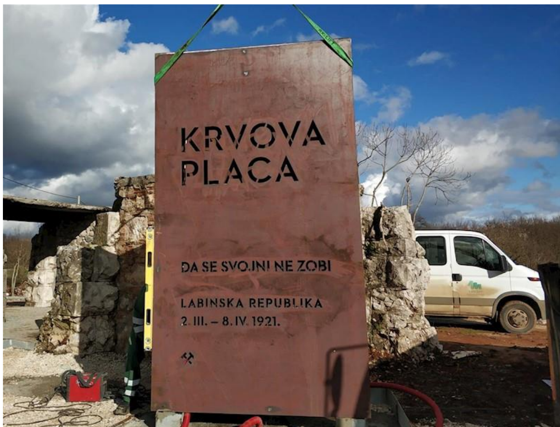
Slika 3. Obnovljena Krvova placa iz 2021.