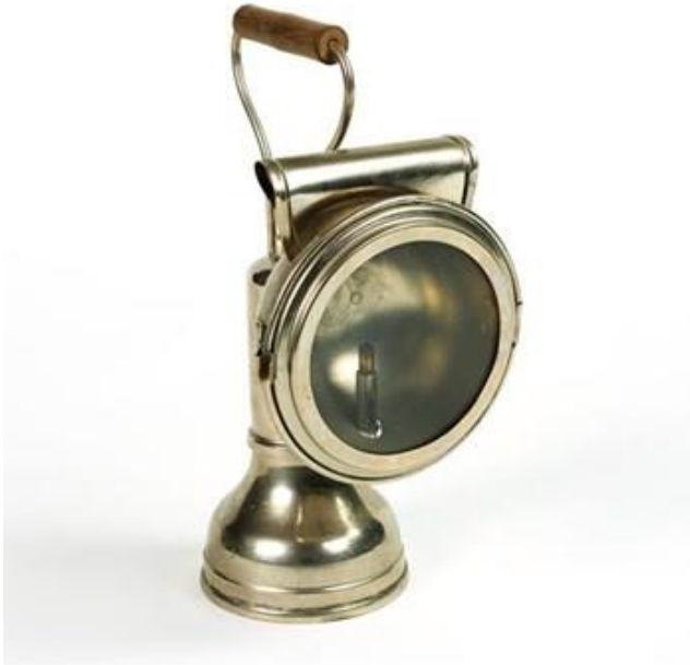
Slika 2. Prikaz određenog modela svjetiljke koja se koristila u jednom periodu u rudnicima

za premještanje materijala kao što su tlo, stijene i rude. Čekići su sredstva za lomljenje stijena i izvlačenje minerala. Dlijeta se upotrebljavaju za oblikovanje i izvlačenje minerala iz stjenovitih formacija. Koriste se i jednostavni uređaji koji služe za ispiranje zlata kako bi se odvojilo od šljunka i sedimenta.