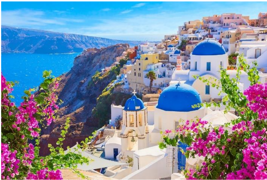
Slika 10. Santorini (izvor: https://uk.hotels.com/go/greece/things-to-do-santorini 15.6.2023.)

Otok je također poznat po svojoj tradiciji i kulturi. Stari grad Oia s uskim uličicama, bijelim kućama i plavim kupolama pruža autentičan doživljaj tradicionalnog života na otoku. Posjetitelji mogu istražiti muzeje, galerije i radionice umjetnika, gdje će dobiti uvid u lokalnu umjetnost i zanate, uključujući slikarstvo, izradu nakita i keramiku.