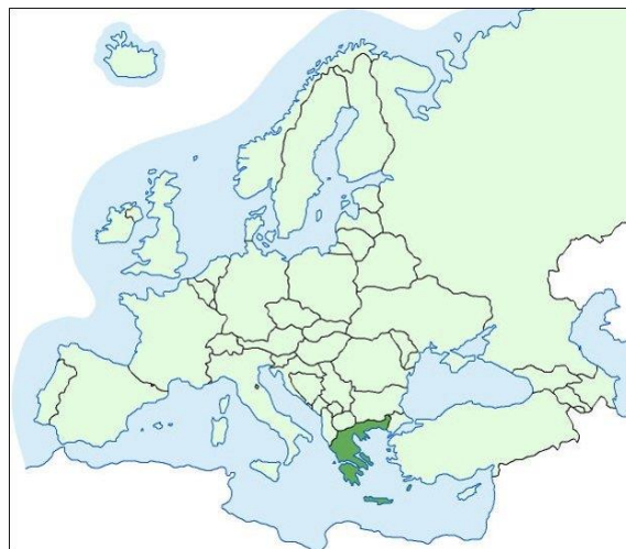
Slika 1. Geografski položaj Grčke

Kopneni dio je ukupne površine od 131.960 kilometara kvadratnih što ju čini 10. najvećom zemljom u Europi. Obala se prostire na 13.676 km te ima prosječnu nadmorsku visinu od 498 metara. 1 Međutim, jedna od glavnih značajki geografskog položaja Grčke su njezine brojne otočne skupine. Grčka ima više od 2000 otoka, a 170 njih je nenaseljeno 2 , stvarajući jedinstvenu otočnu mrežu koja dodatno obogaćuje njezin geografski krajolik.