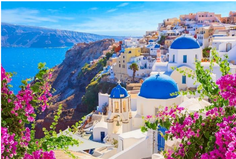
Slika 10. Santorini (izvor: https://uk.hotels.com/go/greece/things-to-do-santorini 15.6.2023.)

Otok je također poznat po svojoj tradiciji i kulturi. Stari grad Oia s uskim uličicama, bijelim kućama i plavim kupolama pruža autentičan doživljaj tradicionalnog života na otoku. Posjetitelji mogu istražiti muzeje, galerije i radionice umjetnika, gdje će dobiti uvid u lokalnu umjetnost i zanate, uključujući slikarstvo, izradu nakita i keramiku.