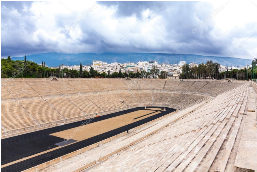
Slika 8. Panatenajski stadion

Već ranije spomenut, Arheološki muzej u Ateni je jedan od najvažnijih muzeja u Grčkoj koji sadrži bitna arheološka nalazišta. Muzej sadrži više od 11.000 izložaka, 53 uključujući zbirku antičkih skulptura, keramike, nakita i drugih predmeta iz različitih povijesnih razdoblja. Posjetitelji mogu istražiti umjetnička remek-djela poput "Zeusa iz Artemisiona" i "Jockey of Artemision".