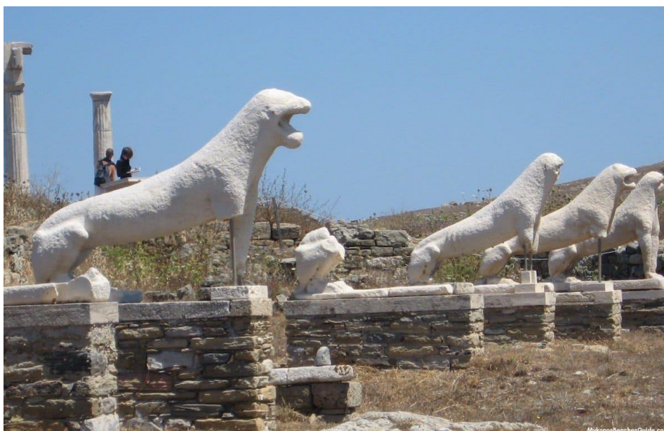
Slika 11. Arheološko nalazište Delos

Osim turističkih atrakcija, Mikonos također nudi mogućnosti za istraživanje kulturne baštine. U blizini otoka nalazi se Delos (sl 6.) arheološko nalazište i jedno od najvažnijih antičkih svetišta u Grčkoj. U Delosu se nalaze brojni spomenici i antičke ruševine, uključujući hramove, amfiteatar i ostale arheološke ostatke.