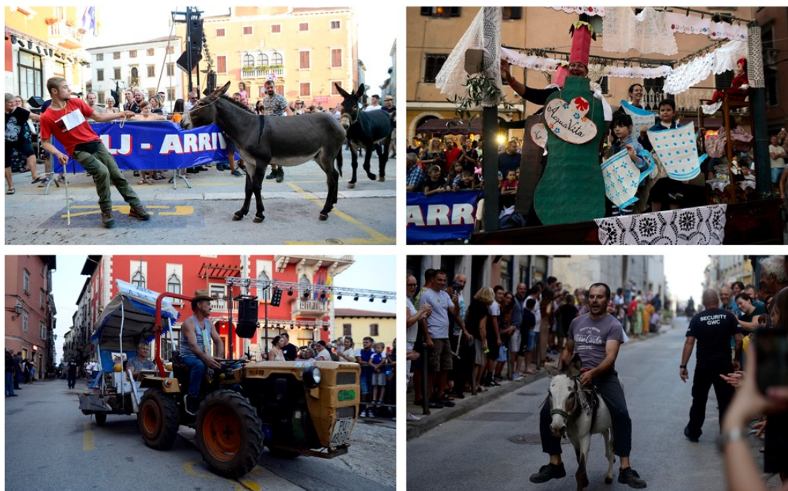
Slika 3. Sastavne atrakcije na fešti

Sastavni dio fešte su atrakcije: trka na tovarima, parada alegorijskih kola, potezanje konopa i penjanje na zamašćeni stup.