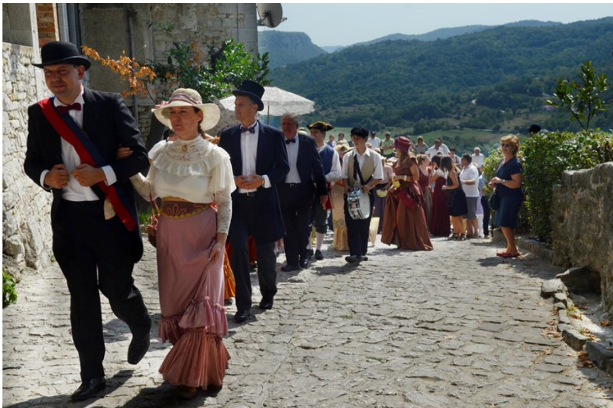
Slika 2. Mimohod na Subotini po starinski