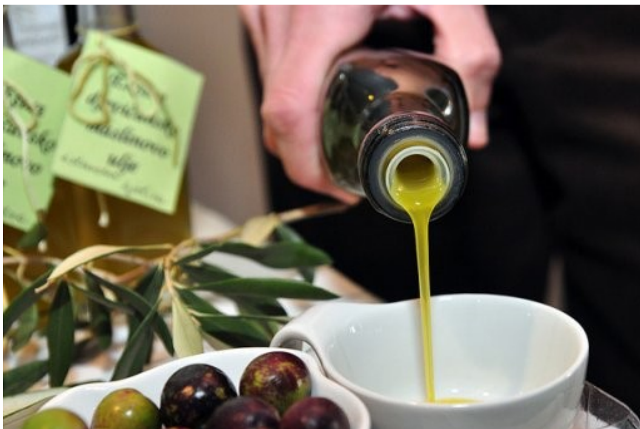
Slika 11. Mlado maslinovo ulje

Grad Vodnjan prepoznao je vrijednost i važnost očuvanja maslinovog ulja kao autohtonog brenda, te svake godine postiže odlične rezultate u posjećenosti manifestacije, a poslovni partneri koji sudjeluju u manifestaciji svake godine iznova pokazuju interes da sudjeluju u ovom projektu kojeg za vrijeme održavanja posjeti više od 20 000 ljubitelja ponude iz programa manifestacije.