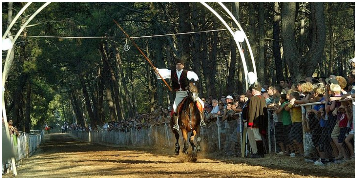
Slika 6. Trk na prstenac