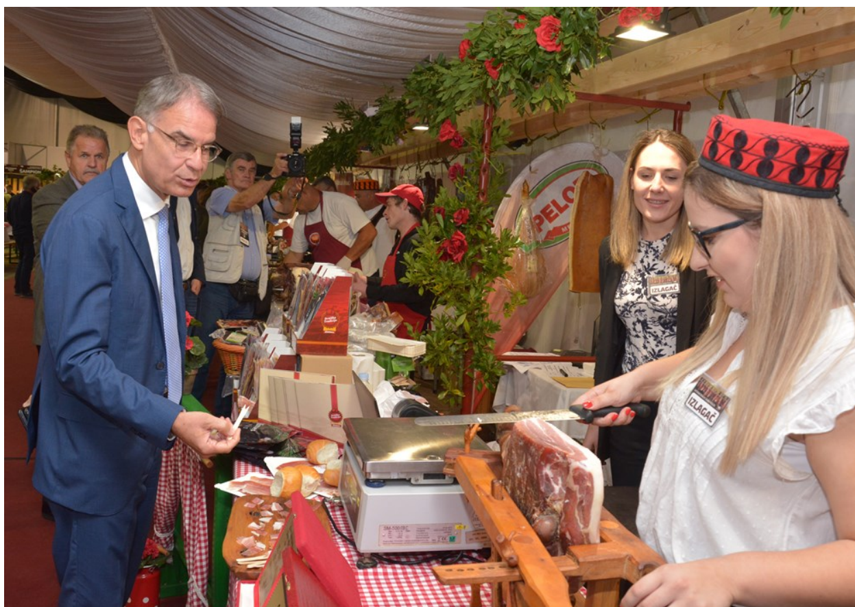
Slika 12. Internacionalni sajam pršuta u Tinjanu

Ovu manifestaciju godišnje posjeti više od 25 000 ljudi, te je jedna od važnijih turističkih i gospodarskih manifestacija središnje Istre.