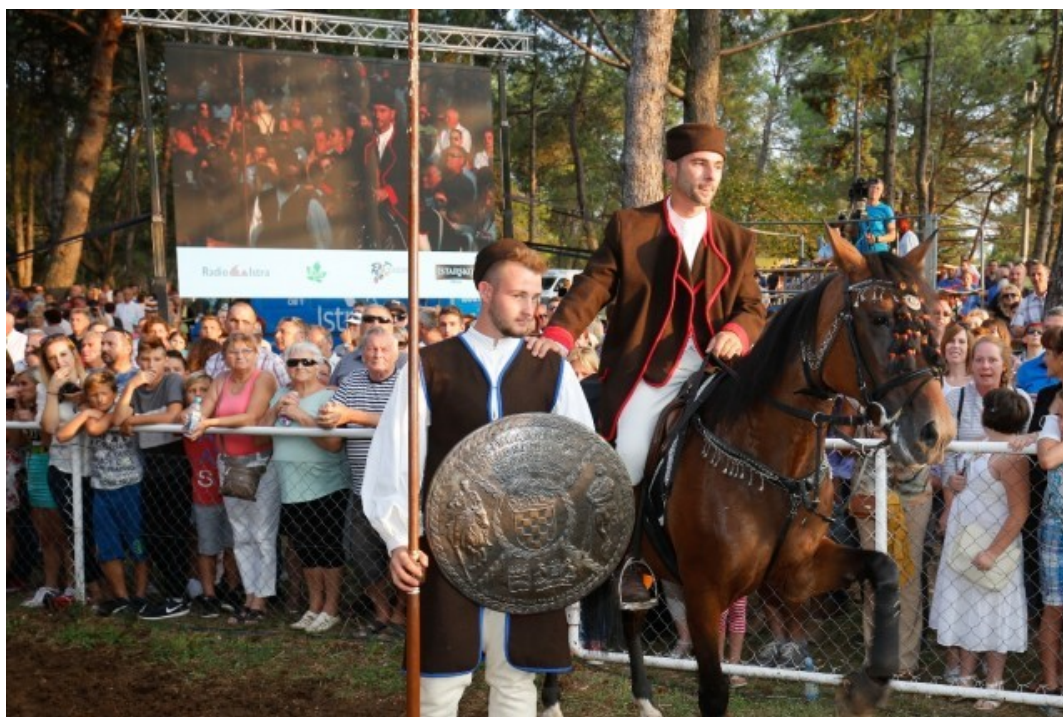
Slika 7. Slavodobitnik 47. Trke na prstenac

Sama trka započinje u nedjelju popodne s povorkom na čelu povorke, odmah iza raspjevanih folklorša, razigranih mažoretinja i pratećih puhača, svečana kočija koju vuku dva bijela lipicanca, upregnuta ukrašenim hamovima, u kojoj uzdignutih glava i uozbiljenih lica sjede članovi časnog suda, koji imaju poseban privilegij dovesti se nasuprot svečane lože na trkalištu, gdje će časno obaviti povjerenu im dužnost nadzora nad provođenjem i poštivanjem Pravila Trke i proglašenja slavodobitnika . Iza kočije hoda vođa kopljonoša koji nosi pušku kremenjaču, a uz njega idu i tri mladića koji nose helebarde. Za njima idu nosači prstena koji na konopu nose prstence, te namještač prtenaca koji nosi metalni štap koji kasnije na Trci podiže prstence iznad staze. U dvoredu s uspravnim kopljima u desnoj ruci hodaju kopljonoše, a za njima idu konjanici jašući na konjima. Prošlogodišnji pobjednik jaše u prvom redu s lijeve strane, noseći u desnoj ruci zastavu Društva Trka na prstenac.