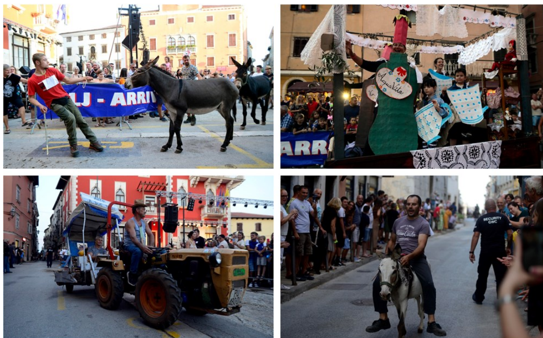
Slika 3. Sastavne atrakcije na fešti

Sastavni dio fešte su atrakcije: trka na tovarima, parada alegorijskih kola, potezanje konopa i penjanje na zamašćeni stup.