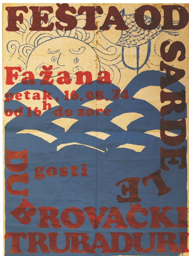
Slika 10. Plakat Fešte od sardele iz 1974.

Fešta se godinama organizirala kako bi prikupljala sredstva za pomoć u radu nogometnog kluba, a i dan danas se dio zarađenog novca odnosi i na to. Fešta je posvećena plavoj ribi srdeli koja je simbol Fažane. 33