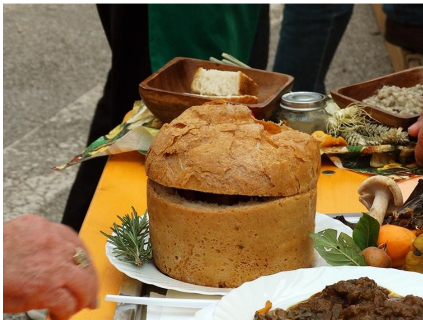
Slika 5. Specijaliteti pripremljeni na Danima gljiva

Manifestacija se obično održava subotu i nedjelju gdje je subota posvećena odlasku u šumu i takmičenju u branju gljiva, pronalasku najljepše i najveće gljive i popodnevo zajedničko druženje uz glazbu. Nedjelja je pak posvećena pripremi kotlića uz degustaciju jela pripremljenih na bazi gljiva. Tijekom manifestacije posjetitelji osim gljiva imaju priliku kupovati lokalne proizvode poput extra-djevičanskog maslinovog ulja, vina, meda, kestena i brojnih drugih proizvoda.