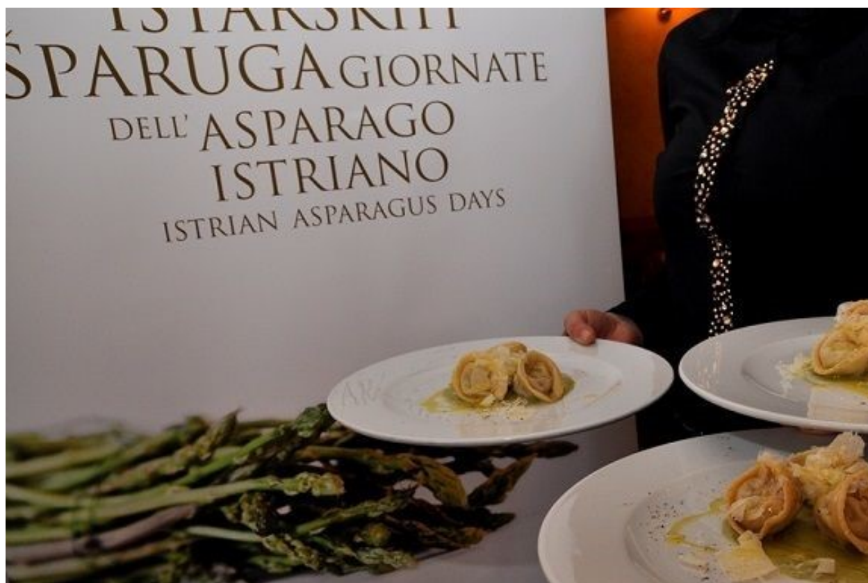
Slika 4. Ravioli punjeni šparugama i sirom

Glavni cilj ovakve manifestacije je promocija gastronomske ponude Buzeštine, naglasak na tome se posebno dao u periodu nakon COVID-19 pandemije. U manifestaciji se promoviraju obrtnici koji su proizvođači hrane, maslinari, vinari, a čije domaće proizvode koriste ugostitelji u svojim objektima.