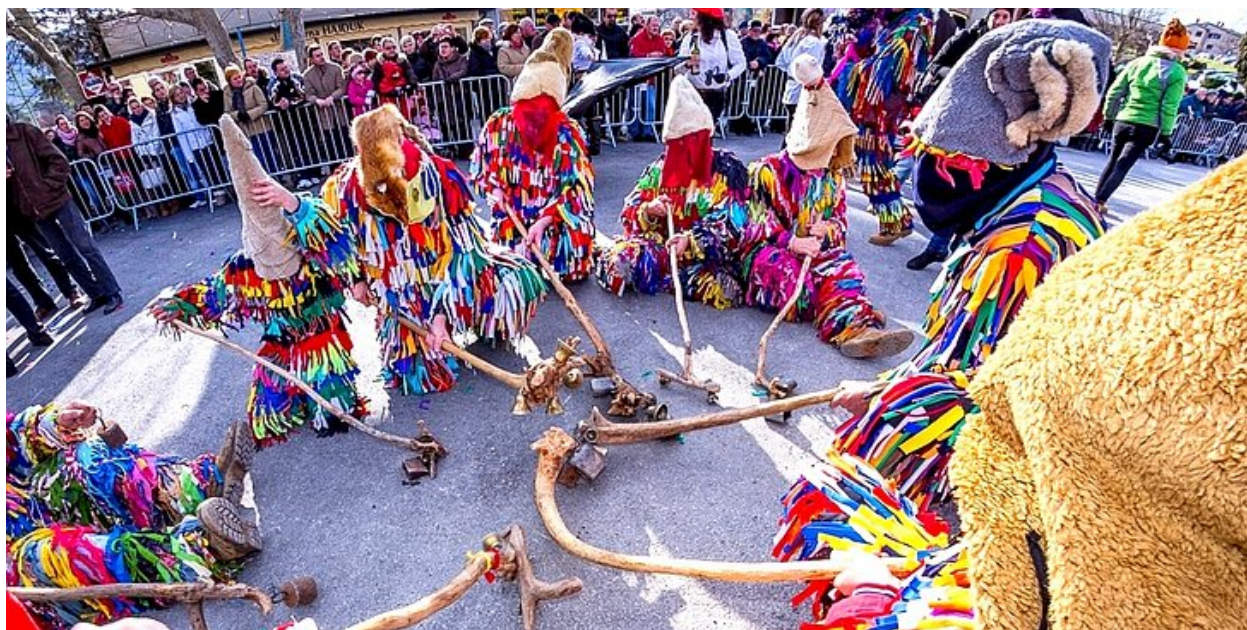
Slika 13. Buzetski karneval

Veliki maškarani mimohod koji okuplja oko tisuću maškaranih sudionika i na desetine alegorijskih kola iz čitave Bužeštine, susjednih gradova, općina, te iz Slovenije, održava se na pusnu nedeju.