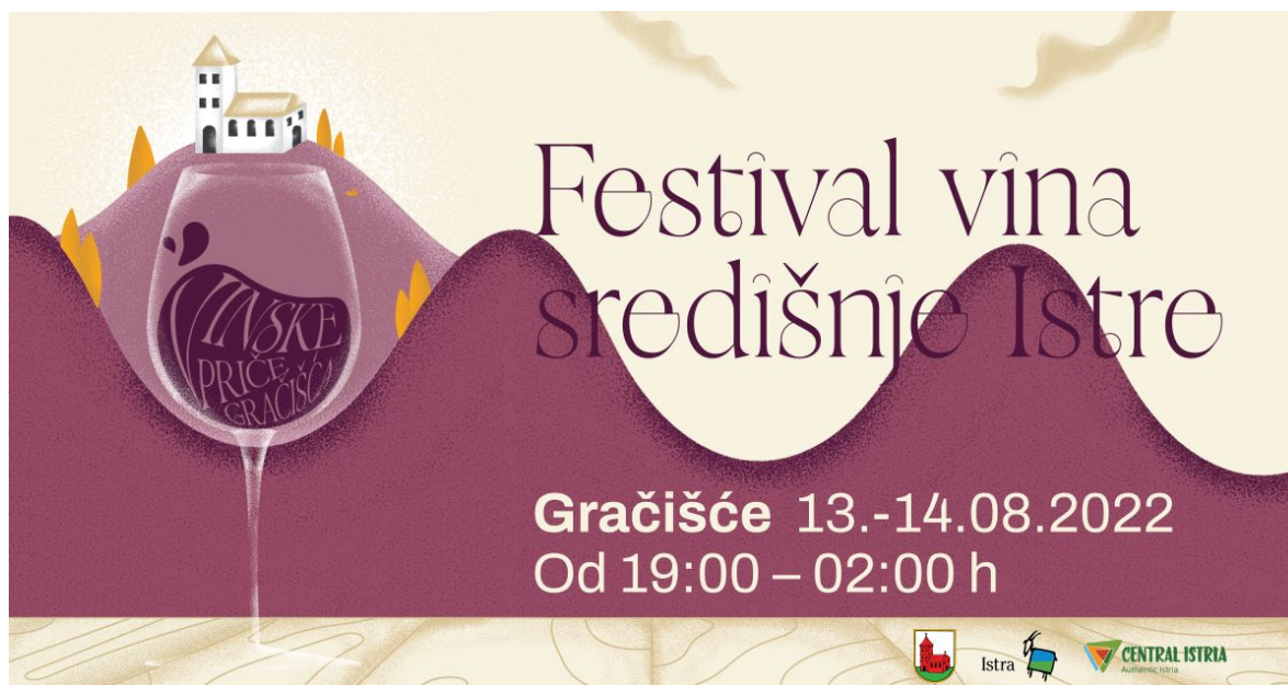
Slika 14. Plakat za Festival vina središnje Istre

Osim vina na Festivalu je moguće okusiti i brojne Istarske lokalne proizvode poput pršuta, kobasica, maslinovog ulja, meda i slastica te ostalih autohtonih delicija ovoga kraja. 39