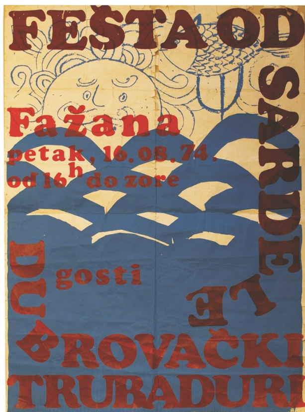
Slika 10. Plakat Fešte od sardele iz 1974.

Fešta se godinama organizirala kako bi prikupljala sredstva za pomoć u radu nogometnog kluba, a i dan danas se dio zarađenog novca odnosi i na to. Fešta je posvećena plavoj ribi srdeli koja je simbol Fažane. 33