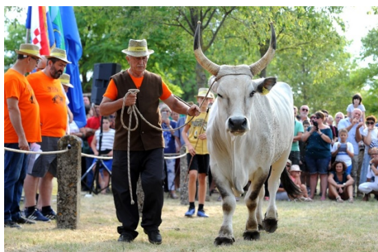
Slika 9. Izložba boškarina

Program započinje u petak kada se održava etno večer, a onda se nastavlja u subotu koja je rezervirana za biciklijadu, te misa u čast svetoga Jakovlja te sajam lokalnih proizvoda, nakon čega je u popodnevnim satima svečano otvorenje smotre istarskih volova.