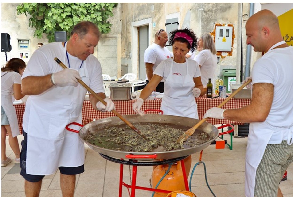
Slika 1. Pripremanje fritaje od puževa

Svake godine 15.08. tradicionalno se održava „Fešta od puži“ gdje se mogu degustirati razni specijaliteti od puževa. U današnje vrijeme tradicionalno pripremanje puževa pripisuje se mještanima Galizane talijanskog podrijetla i okolice. Zbog vrlo cijenjenog mesa jela od puževa se smatraju delicijom. Puževi se sakupljaju na lokalnim livadama i pripremaju po tradicionalnom receptu uz palentu. 21