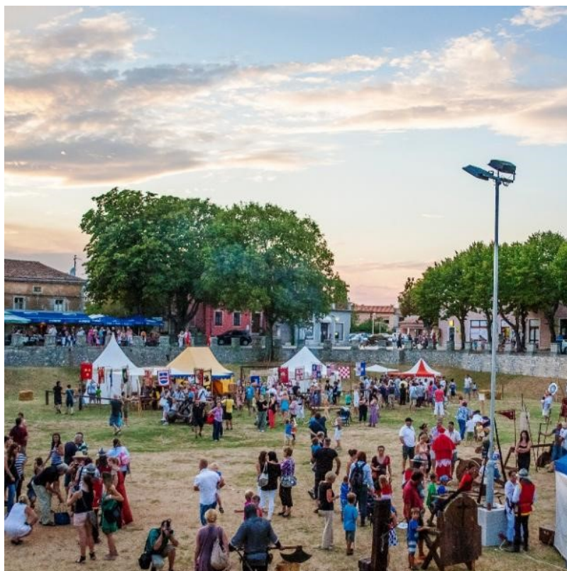
Slika 16. Srednjovjekovni festival u Svetvinčentu

Srednjovjekovni festival u Svetvinčentu je manifestacija koja oživljava srednjovjekovnu atmosferu. Tijekom tri festivalska dana mjesto se vraća stoljećima unatrag, a sa sobom vodi i posjetitelje koji se zateknu tamo. Ova manifestacija prilagođena je za sve generacije, a podijeljena je u tri tematska dana: obiteljski dan, dan viteštva i dan legendi. Na festivalu nastupaju domaće i strane udruge i društva koji njeguju srednjovjekovnu kulturu i tradiciju, a dolaze iz Slovačke, Mađarske, Italije, Slovenije i Hrvatske. 49