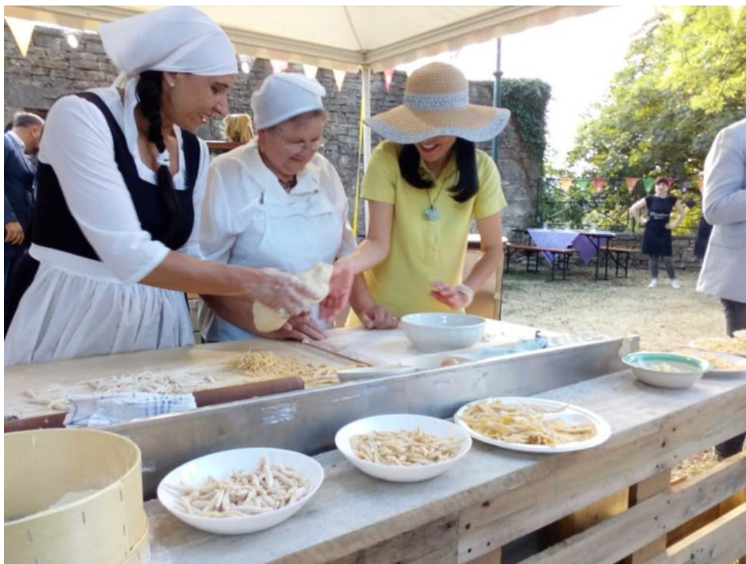
Slika 15. Izrada pašte na tradicionalan način

Manifestacija koja se tradicionalno održavala početkom srpnja no ove godine je pomaknuta te se održava u rujnu, u Žminju. Ovo je manifestacija koja ističe zaslužno mjesto pašti, tjestenini u istarskoj gastronomiji. Zbog korone dvije godine je ova manifestacija pauzirana. Promocijom i održavanjem ove manifestacije nastoji se sačuvati i njegovati lokalna tradicija te potaknut zaštita, vrednovanje autohtonih, izvornih tjestenina kao i poticati te podržati lokalne proizvođače tjestenine na ustrajnosti u očuvanju tradicije i kreativnost u razvoju novih proizvoda. 45