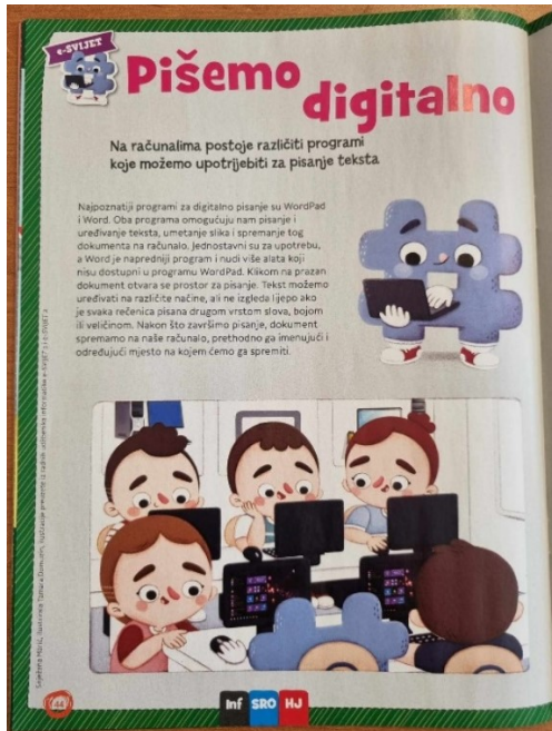
Slika 5. Dječaci i djevojčice za računalima, Izvor: dječji časopis Smib, broj 8, travanj 2020.

Kada se govori o računalnoj tehnologiji smatra se da u tom sektoru dominiraju dječaci. No, u navedenom primjeru se nalazi jednak broj dječaka i djevojčica koji sjede i rade za računalom. Iako se smatra da je korištenje računala za dječake, postoje djevojčice koje pokazuju jednaki interes za tom vještinom.