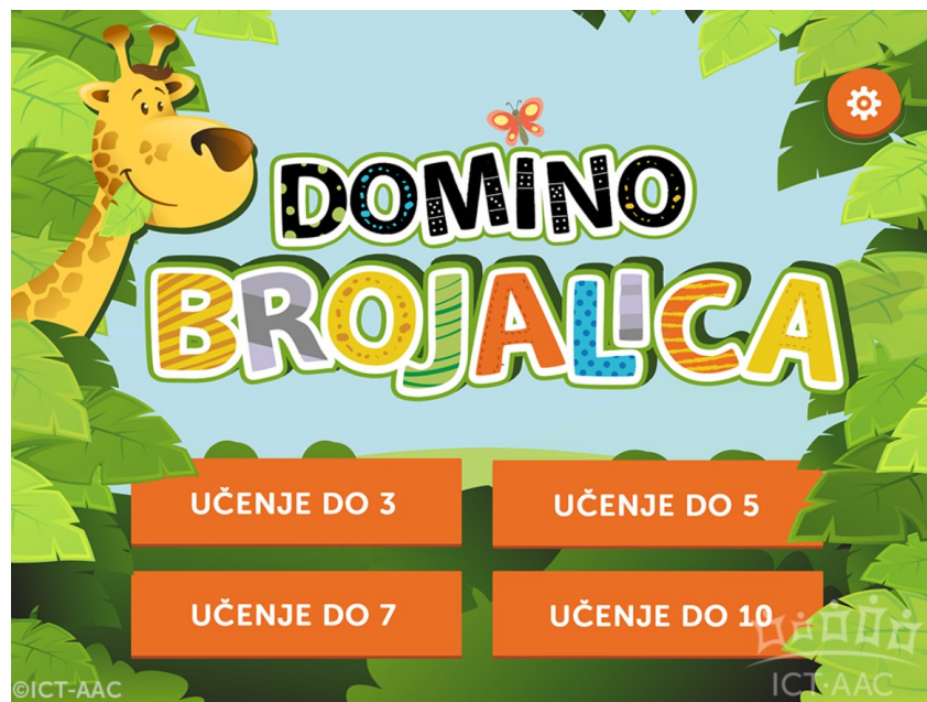
Slika 3. Aplikacija Domino brojlica ( http://ict-aac.hr/index.php/hr/ict-aac-razvijene-aplikacije/apple-ios-aplikacije/domino-brojalica )

Aplikacija je posebno dizajnirana za djecu s teškoćama u razvoju, ali ju mogu koristiti i djeca urednog razvoja. U konačnici, cilj ove aplikacije je stvaranje čvrstih temelja za razumijevanje matematike, učenje brojeva i količina te pripremi djece za kasnije računске operacije. Osim toga, nudi priliku za inkluzivno učenje, gdje sva djeca, bez obzira na svoje različite potrebe, mogu zajedno uživati u razvoju matematičkih vještina.