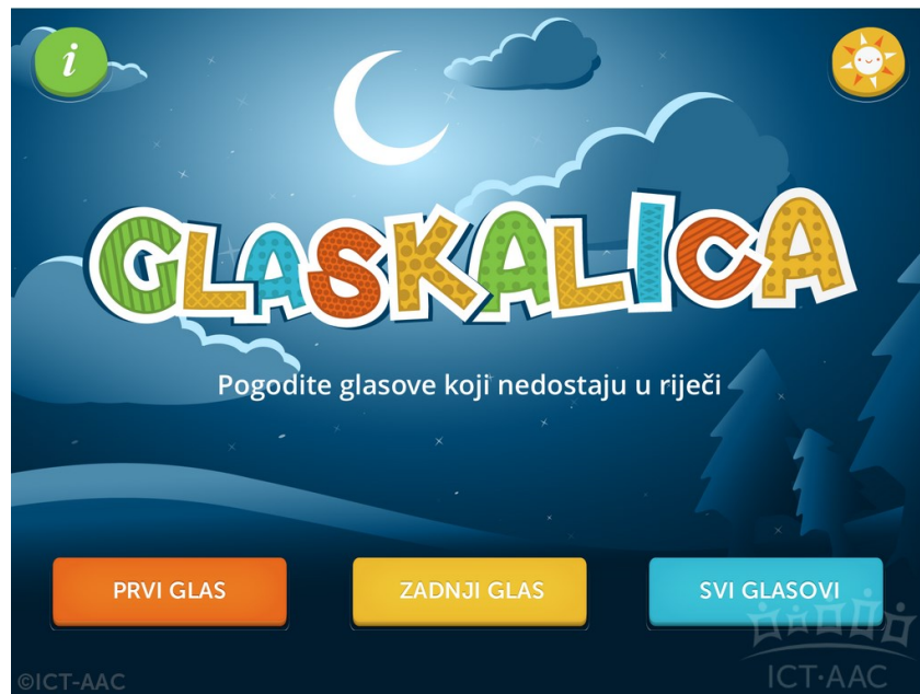
Slika 1. Aplikacija Glaskalica ( http://ict-aac.hr/index.php/hr/ict-aac-razvijene-aplikacije/android-aplikacije/glaskalica )

Ovisno o vrsti igre, pogađaju se prvi, zadnji ili svi glasovi u riječi prikazanoj simbolom iz ponuđenog skupa glasova. Korisnik pogađa glasove za deset simbola, a nakon toga aplikacija šalje upit korisniku želi li nastaviti igru s istom težinom zadataka, igrati s težim zadacima ili odabrati drugu igru. Također, postavke aplikacije omogućuju korisniku isključivanje postavke slovanja riječi nakon uspješnog pogađanja simbola.