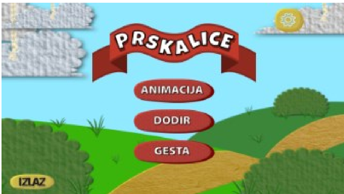
Slika 10. Aplikacija Prskalice ( http://www.ict-aac.hr/index.php/hr/ict-aac-razvijene-aplikacije/apple-ios-aplikacije/prskalice )

Aplikacija ima za cilj učenje uzročno-posljedičnih veza kroz tri različite igre. Prva igra, "Animacije," prikazuje kratke video zapise za privlačenje pažnje korisnika. Druga igra, "Dodir," prikazuje objekte s zvukom nakon što ih korisnik dotakne. Treća igra, "Geste," uključuje povlačenje prsta po ekranu za stvaranje vizualnih i zvučnih efekata. Korisnici mogu odabrati različite grafičke elemente za svaku igru.