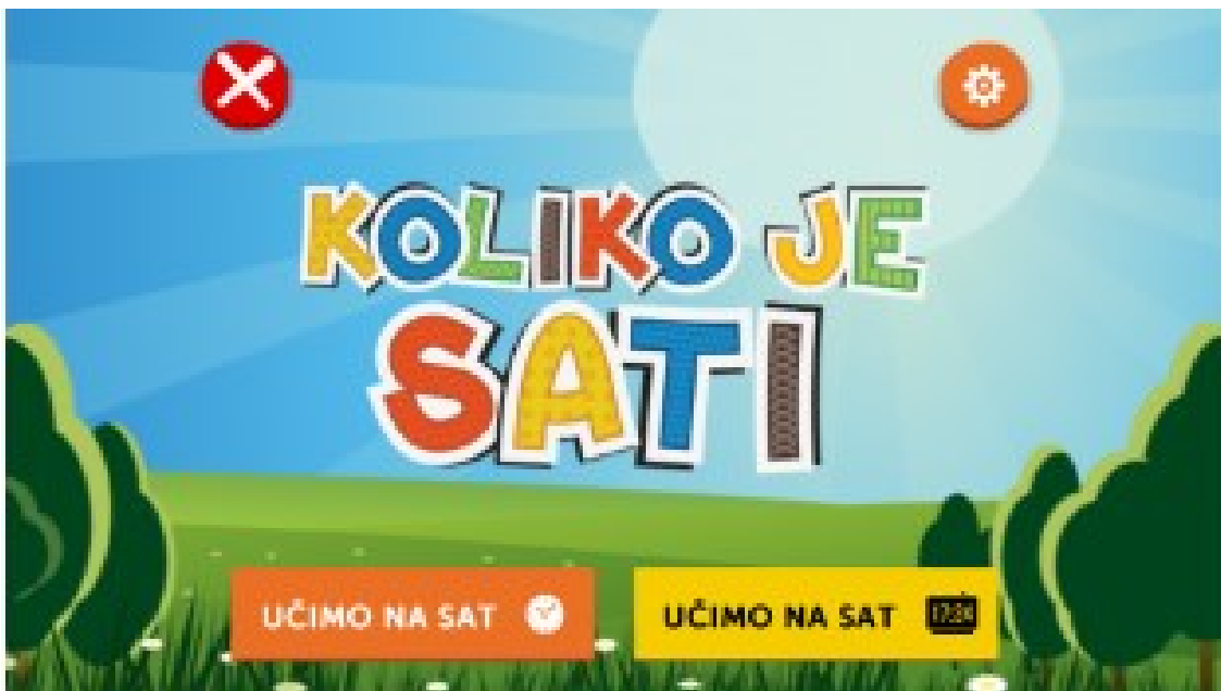
Slika 12. Aplikacija Koliko je sati ( http://www.ict-aac.hr/index.php/hr/ict-aac-razvijene-aplikacije/apple-ios-aplikacije/ict-aac-koliko-je-sati )

Aplikacija ICT – AAC "Koliko je sati" razvijena je kako bi pomogla djeci, uključujući one s teškoćama u razvoju, da bolje razumiju vremenske koncepte. Koristeći ovu aplikaciju, djeca mogu praktično iskazivati trajanje događaja u vremenskim jedinicama, a cilj je njihovo razumijevanje veze između brojeva i količina te poboljšava percepcija slijeda događaja u vremenu, navodi App Store .