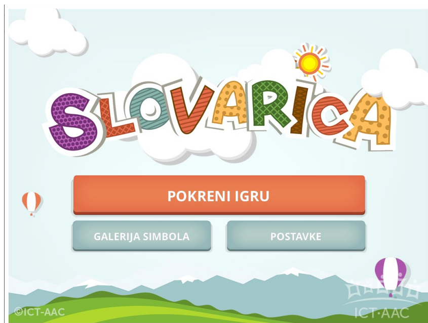
Slika 13. Aplikacija Slovarica ( http://www.ict-aac.hr/index.php/hr/ict-aac-razvijene-aplikacije/apple-ios-aplikacije/slovarica )

Uporaba Slovarice ima za cilj da djeca steknu važne predčitalačke vještine kao što su prepoznavanje i izdvajanje početnih slova i glasova u riječima, organizacija slova i riječi, prepoznavanje vizualnih oznaka slova i riječi te razumijevanje pravila pisanja. Ova aplikacija se može koristiti kod kuće ili u predškolskim ustanovama te je prikladna i za djecu kojoj ne treba dodatna stručna podrška.