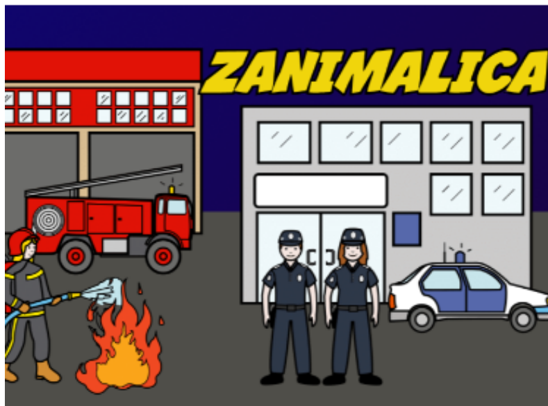
Slika 9. Aplikacija Zanimalica ( http://www.ict-aac.hr/index.php/hr/ict-aac-razvijene-aplikacije/android-aplikacije/zanimalica )

Svako zanimanje sadržava nekoliko edukacijskih multimedijских priča, a svaka priča potkrijepljena je tekstom, zvukom i slikama.