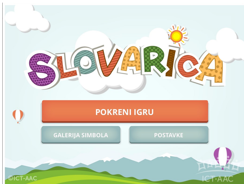
Slika 13. Aplikacija Slovarica ( http://www.ict-aac.hr/index.php/hr/ict-aac-razvijene-aplikacije/apple-ios-aplikacije/slovarica )

Uporaba Slovarice ima za cilj da djeca steknu važne predčitalačke vještine kao što su prepoznavanje i izdvajanje početnih slova i glasova u riječima, organizacija slova i riječi, prepoznavanje vizualnih oznaka slova i riječi te razumijevanje pravila pisanja. Ova aplikacija se može koristiti kod kuće ili u predškolskim ustanovama te je prikladna i za djecu kojoj ne treba dodatna stručna podrška.