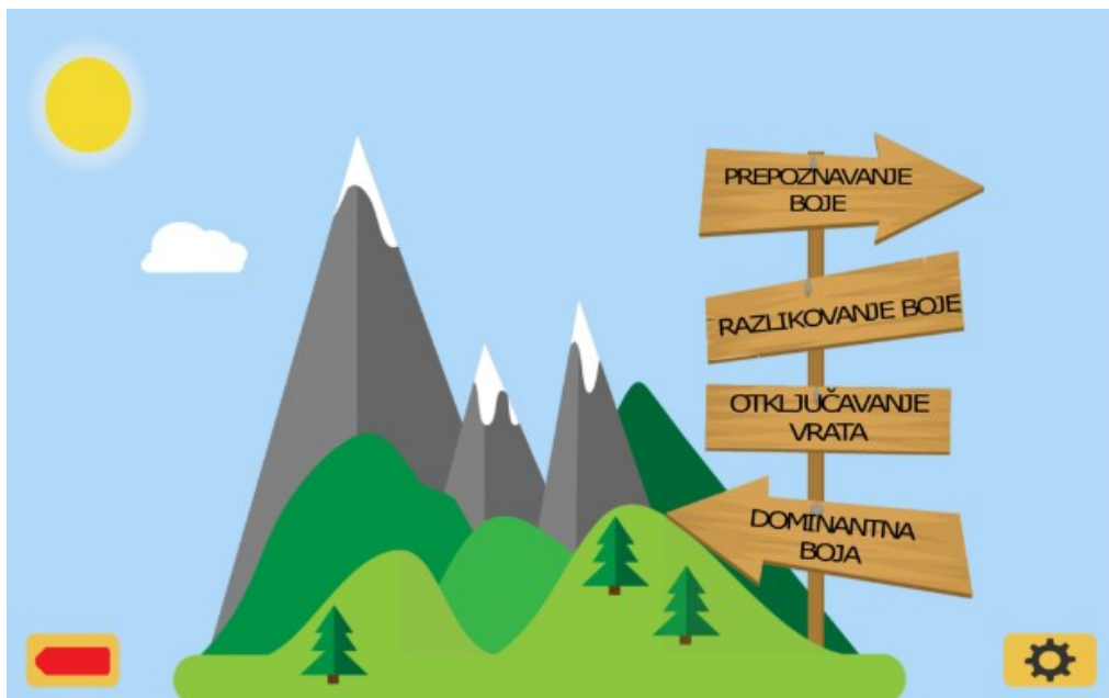
Slika 11. Aplikacija Učimo boje ( http://www.ict-aac.hr/index.php/hr/ict-aac-razvijene-aplikacije/apple-ios-aplikacije/ucimo-boje )

Aplikacija nudi četiri razine različite težine, kao i prilagodljive postavke koje omogućuju korisnicima odabrati boje, glas, prikaz teksta i način korištenja koji najbolje odgovara njihovim potrebama.