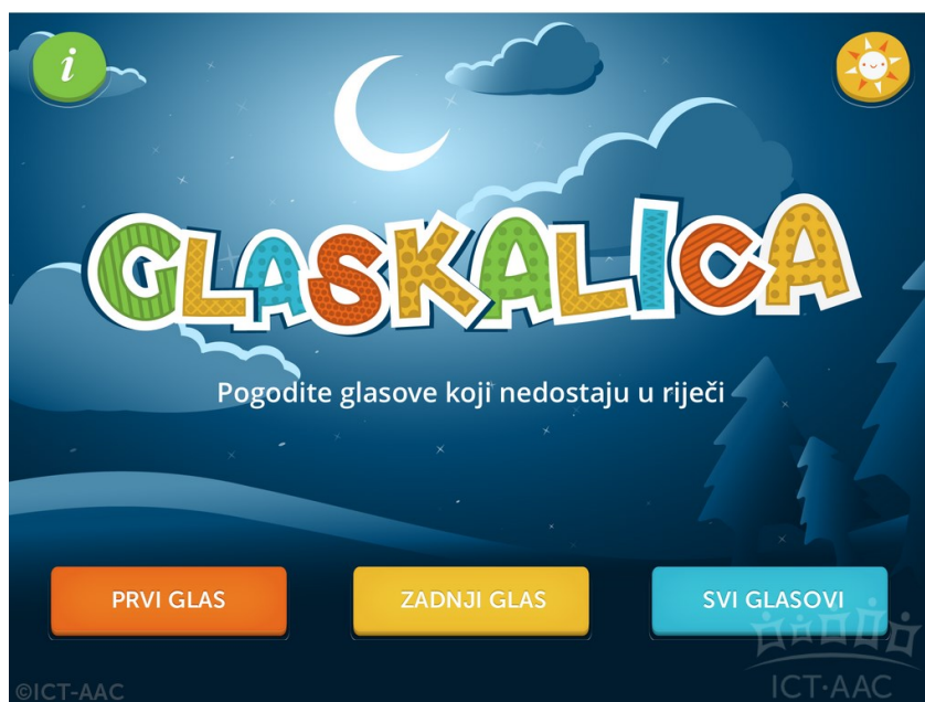
Slika 1. Aplikacija Glaskalica ( http://ict-aac.hr/index.php/hr/ict-aac-razvijene-aplikacije/android-aplikacije/glaskalica )

Ovisno o vrsti igre, pogađaju se prvi, zadnji ili svi glasovi u riječi prikazanoj simbolom iz ponuđenog skupa glasova. Korisnik pogađa glasove za deset simbola, a nakon toga aplikacija šalje upit korisniku želi li nastaviti igru s istom težinom zadataka, igrati s težim zadacima ili odabrati drugu igru. Također, postavke aplikacije omogućuju korisniku isključivanje postavke slovanja riječi nakon uspješnog pogađanja simbola.