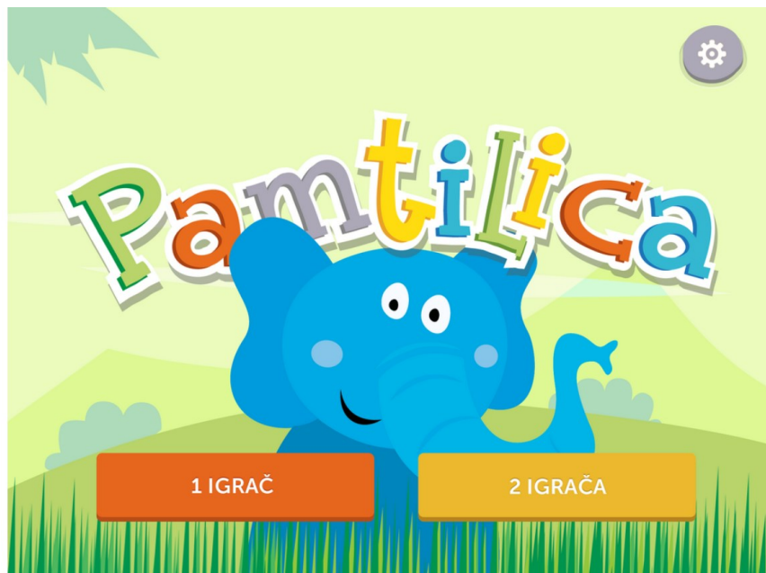
Slika 4. Aplikacija Pamtilica ( http://ict-aac.hr/index.php/hr/ict-aac-razvijene-aplikacije/apple-ios-aplikacije/pamtilica )

Ovisno o potrebama, moguće je odabrati koja slova iz abecede će se koristiti u igri, omogućujući postupno usvajanje vještina čitanja od manjeg skupa glasova do cijele abecede. Aplikacija također omogućuje uključivanje/isključivanje izgovora zvučnog zapisa simbola, prilagodbu pozadine sučelja, upravljanje prikazom imena simbola i odabir pozadine kartica. Slična je igri Memory .