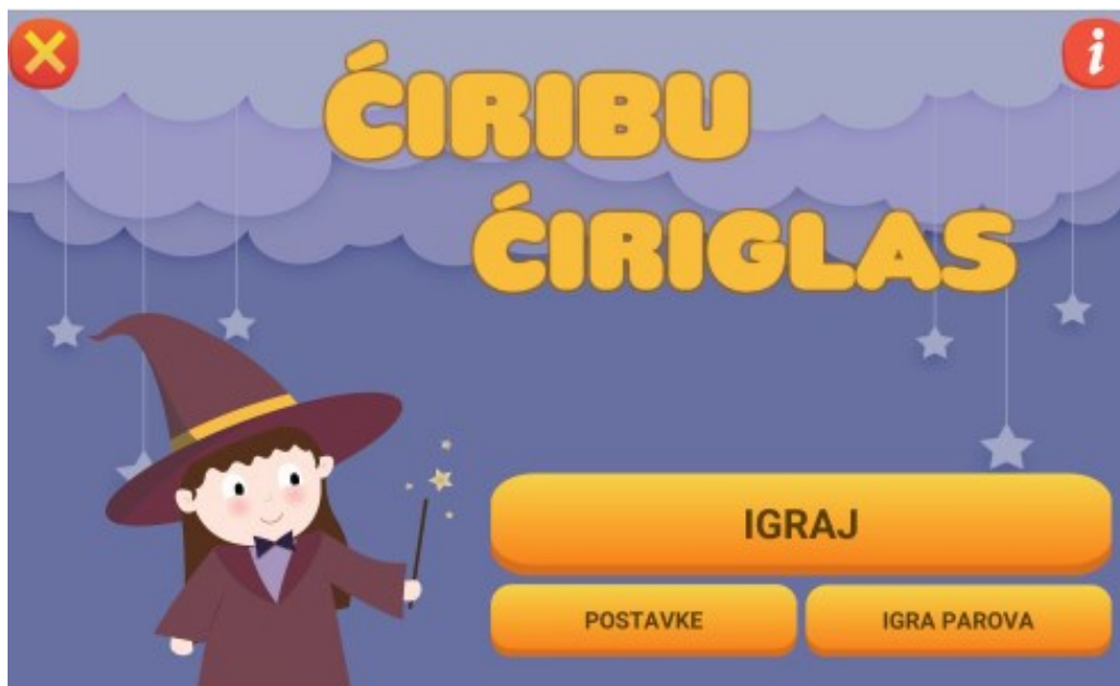
Slika 5. Aplikacija Ćiribu Ćiriglas ( http:// ict-aac-razvijene-aplikacije/apple-ios-aplikacije/ciribu-ciriglas )

App Store navodi da aplikacija Ćiribu Ćiriglas (Slika 5) ima za cilj poticanje fonoloških sposobnosti, slušne diskriminacije, predvještina čitanja i pisanja te uvježbavanje pravilne artikulacije pojedinih glasova kod djece svih uzrasta. Postavke se prilagođavaju ovisno o vještini koja se želi uvježbati. Aplikacija ima četiri razine težine (ciljani glas je na početku riječi, na kraju riječi, u sredini riječi ili u bilo kojoj poziciji u riječi) kako bi se omogućilo postepeno učenje. Prije početka igre odabire se način prikaza riječi (simbol, tekst ili simbol s tekstom) i pozicija ciljanih glasova unutar riječi (ovisno o fazi uvježbavanja). Također postoji izbor omogućivanja, odnosno onemogućivanja opcije izgovora riječi i prikaza slova.