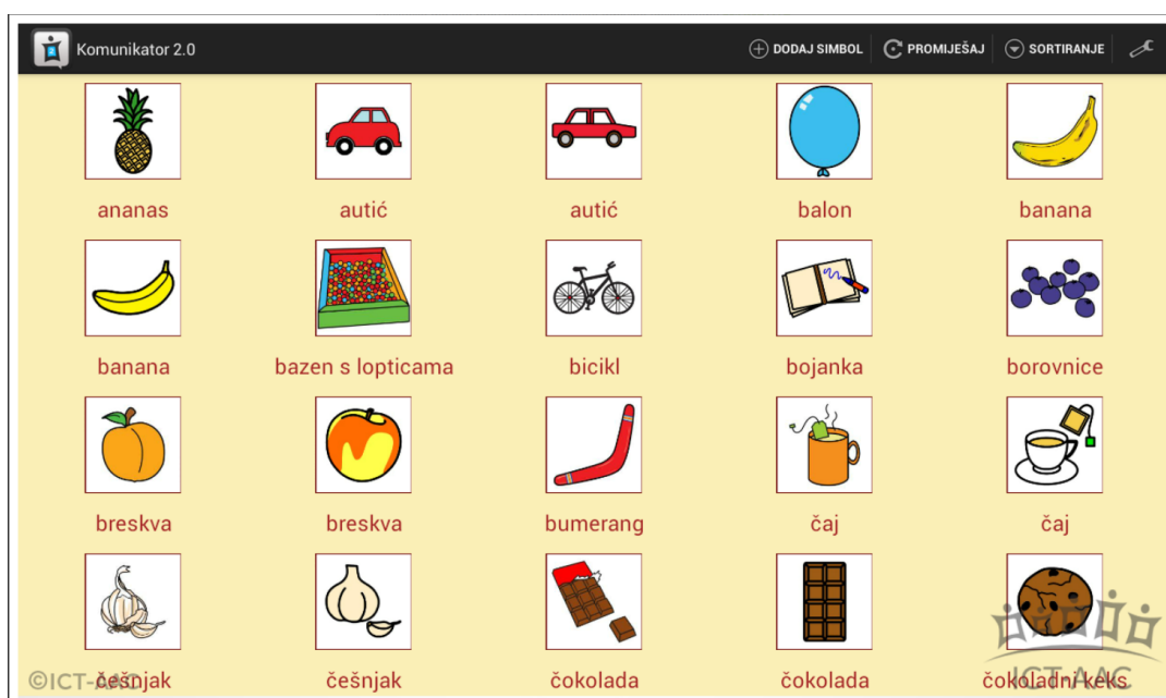
Slika 7. Aplikacija Komunikator ( http://ict-aac.hr/index.php/hr/ict-aac-razvijene-aplikacije/android-aplikacije/komunikator )

Pomoću postavki aplikacije moguće je prilagoditi veličinu prikaza simbola na ekranu (broj stupaca i redaka simbola).