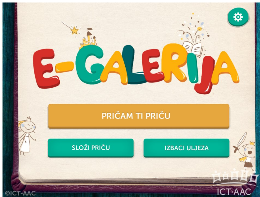
Slika 6. e-Galerija ( http://ict-aac.hr/index.php/hr/ict-aac-razvijene-aplikacije/android-aplikacije/e-galerija )

Trgovina Play navodi da aplikacija e-Galerija (Slika 6) omogućuje slaganje priča pomoću niza sličica koje mogu biti fotografije snimljene integriranom kamerom uređaja, slike iz galerije uređaja ili simboli iz triju nekomercijalnih galerija (ARAASAC, Mulberry i Sclera). Svakoj je sličici moguće pridružiti tekstualni i zvučni zapis koji opisuju odgovarajući dio priče, a zvučni se zapis reproducira pritiskom na sličicu prilikom pregledavanja priča. Ova aplikacija sadrži i dvije igre: „Složi priču“ i „Izbaci uljeza“. U prvoj igri korisnik mora pomiješane sličice iz odabrane priče posložiti pravilnim redoslijedom, a u drugoj odabrati sličice koje ne pripadaju priči. Korisniku je omogućena prilagodba veličine slova i sličica, automatsko listanje priča te ima mogućnost promjene pozadinske boje, okvira sličica i teksta.