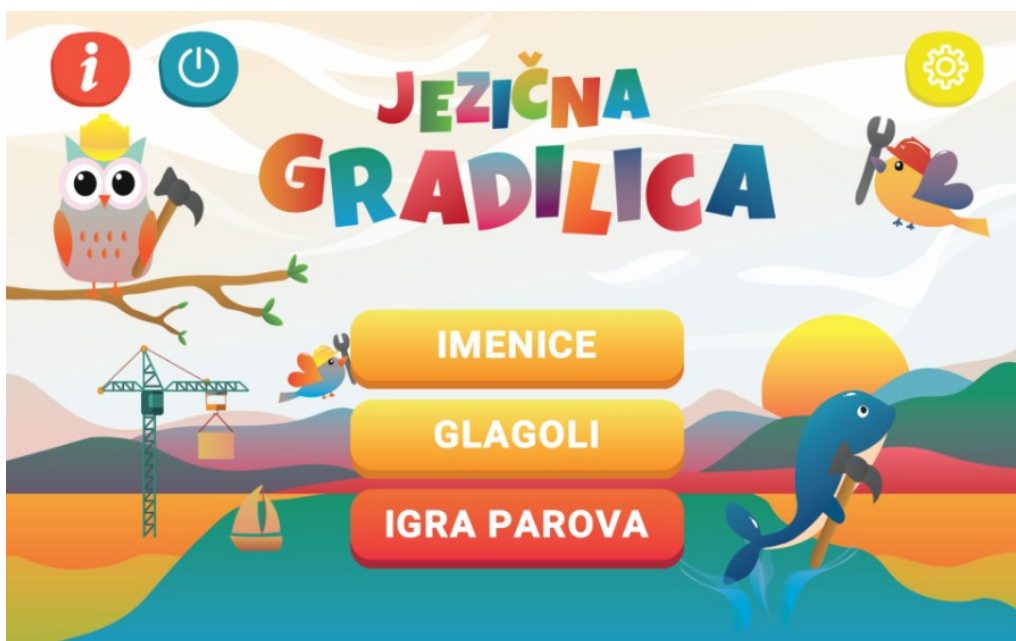
Slika 2. Jezična gradilica ( http://ict-aac.hr/index.php/hr/ict-aac-razvijene-aplikacije/apple-ios-aplikacije/ict-aac-jezicna-gradilica )

Ova aplikacija ima mogućnost odabira „Dinamičkih postavki“ napravljenih prema modelu učenja te aplikacija tada sama određuje koliko je djetetu potrebno zadataka obzirom na uspješnost u rješavanju prethodnih.