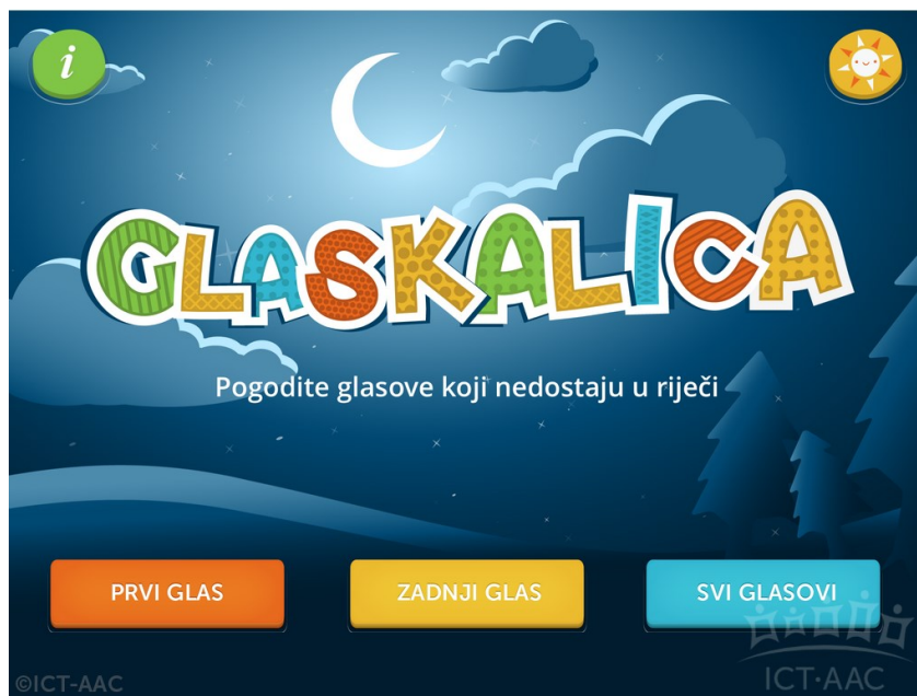
Slika 1. Aplikacija Glaskalica ( http://ict-aac.hr/index.php/hr/ict-aac-razvijene-aplikacije/android-aplikacije/glaskalica )

Ovisno o vrsti igre, pogađaju se prvi, zadnji ili svi glasovi u riječi prikazanoj simbolom iz ponuđenog skupa glasova. Korisnik pogađa glasove za deset simbola, a nakon toga aplikacija šalje upit korisniku želi li nastaviti igru s istom težinom zadataka, igrati s težim zadacima ili odabrati drugu igru. Također, postavke aplikacije omogućuju korisniku isključivanje postavke slovanja riječi nakon uspješnog pogađanja simbola.