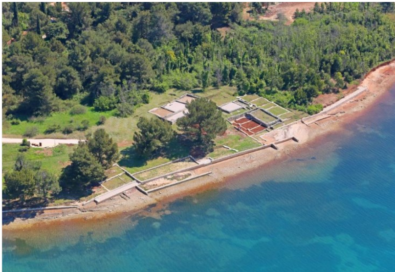
Slika 3. Panorama Arheološkog parka Vižula

Arheološki park Vižula smješten je na poluotoku Vižula, nadomak Medulina. Medulin je danas jedan od najposjećenijih hrvatskih turističkih gradova sa oko pola milijuna posjetitelja godišnje. Poluotok Vižula mjesto je bogato poviješću pa je u skladu s time uređen Arheološki park Vižula (sl.3). Arheološki park obiluje multimedijalnim sadržajima za posjetitelje, to su dva smještajna objekta, dječja igrališta, adrenalinski park smješten u nekadašnjem kamenolomu, pozornica za različite događaje te je moguće posjetiti školu arheologije a time i antički vrt (muzej bilja na otvorenom) za koji postoje posebno organizirane ture pod stručnim vodstvom. Kako je prije spomenuto da je Vižula poluotok bogate povijesti, tako posjetitelji na ulasku u Arheološki park imaju mogućnost (ukoliko žele) iznajmiti VR/AR naočale i pogledati oživljenu vizualizaciju nekadašnje rimske vile i njenih popratnih zgrada koje su se tamo nekada nalazile. Osim toga, Park sadrži pametne klupe, Hot spot i mnoge druge multimedijske sadržaje i potpuno je prilagođen slijepim i slabovidnim osobama. 42