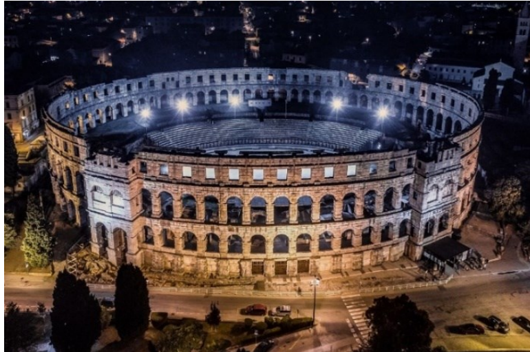
Slika 1. Amfiteatar u Puli

(Izvor: https://www.pulainfo.hr/de/where/arena-amphitheater/ ) (Pristupljeno 18.kolovoza 2023.)