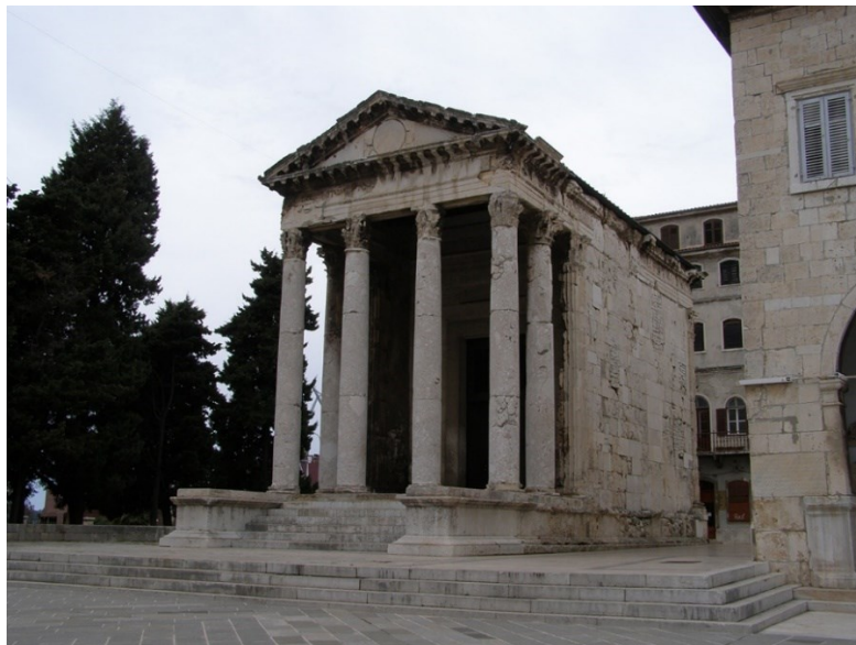
Slika 2. Augustov hram u Puli

Augustov hram smješten je na sjevernom djelu pulskog Foruma (sl.2.). oČetverokutnog je oblika i dimenzija 8x17,3. Vrijeme točne izgradnje nije poznato, no, pretpostavlja se da je hram nastao između 2. g. pr. Kr. i 14.g., što odgovara vremenu vladavine cara Augusta, po kojem je hram i dobio ime. Osim caru Augustu, posvećen je i božici Romi, zaštitnici Rimske države, a to dokazuje natpis na vijencu pročelja hrama: ROMAE ET AUGUSTO CAESARI DIVI F. PATRI PATRIAE (Romi i Augustu, sinu božanskog Cezara, ocu domovine) . U vrijeme kada je postavljen, natpis je bio od bronce i bio je utisnut u kameno pročelje, no danas je od cjelokupnog natpisa vidljiv samo jedan dio, a isti je u lošem stanju, nakon što je hram stradao u savezničkom bombardiranju Pule. Ono što iznenađuje je da je on gotovo u potpunosti očuvan, iako je zadobio ozbiljna oštećenja pri već spomenutom bombardiranju Pule u Drugom svjetskom ratu, no kasnije je obnovljen. 38