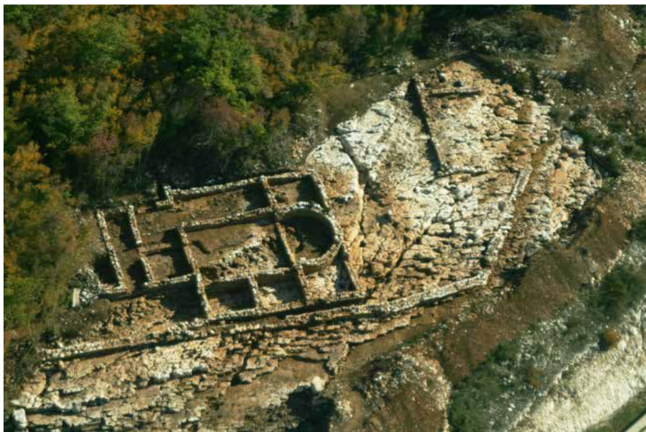
Slika 6 Brestić-zračna snimka

U razdoblju od 29. travnja 2009. do 15. veljače 2010. godine provedeno je zaštitno arheološko istraživanje na lokalitetu Istarski ipsilon-Brestić u Višnjaju u kojem je istražena antička gospodarska vila i kasnoantički apsidalni objekt, otkriven na dijelu rute Istarskog ipsilona, na brežuljku Brestić kod Višnjana (sl. 6.). 61