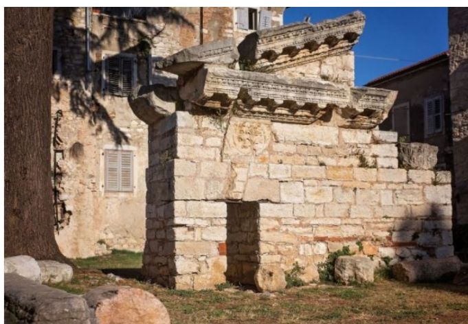
Slika 8 Ostatci Velikog Neptunovog hrama u Poreču

Vrijeme izgradnje velikog hrama posvećenog bogu mora Neptunu, povjesničari datiraju u prvo stoljeće. Smješten je u blizini Trga Marafor, a od nekoć velebne građevine, danas su ostali samo dio zida i dio temelja (sl. 8). 73