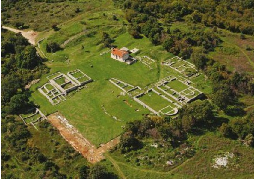
Slika 7. Arheološki lokalitet Nezakcij- zračna snimka