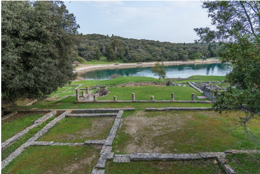
Slika 5. Rimski maritimna vila u uvali Verige

u uvali Verige s pogledom na more je ogroman kompleks zgrada koji sačinjavaju gospodarske zgrade, tri hrama sa stanovima za svećenike, terme s podzemnim prostorijama kao i stambeni dio na južnoj strani uvale s knjižnicom. Stambeni dio vile zapravo je bila villa rustica iz 1. st. koja je u kasnijim razdobljima prenamijenjena u luksuzan maritimno rezidencijski kompleks s pripadajućim pristaništem. 55