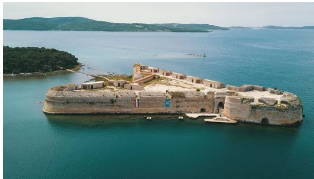
Slika 5. Tvrđava sv. Nikole UNESCO

U tri godine je za uređenje i obnovu uloženo 5 milijuna kuna. 4 milijuna je iz proračuna Šibensko-kninske županije dok je ostatak financiralo Ministarstvo kulture. Napravljeni su radovi što se tiče deratizacije objekta, sanacija, sigurnosne ograde, pristanište za brodove te je konačno odvezen i veliki otpad koji se tamo godinama nakupljao. Samom revitalizacijom je omogućen organiziran i osiguran pristup lokalitetu.