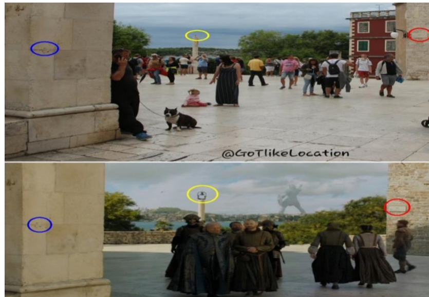
Slika 7. Game of thrones

Na tvrđavi Sv. Ivana je snimljena jedna od borbi u gradu "Meereenu", a konture starog dijela grada i tvrđava sv. Nikole su scenski snimljene u petoj sezoni. NADOPUNITI