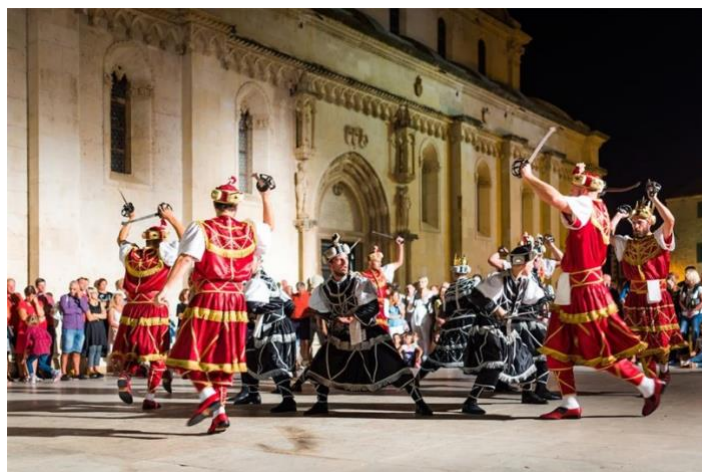
Slika 4. Srednjovjekovni sajam

Srednjovjekovni sajam – održava se za vrijeme proslave šibenskog zaštitnika sv. Mihovila u rujnu. Tijekom sajma, cijeli grad i ulice poprimaju štih srednjeg vijeka, a posjetitelji mogu uživati u raznim sadržajima poput viteških borbi, plesa, večernjim pomorskim bitkama, ponudi sajma, paljbi iz topova, jahanju konja itd.