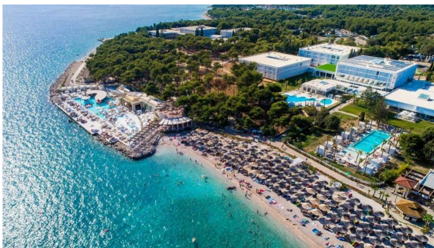
Slika 2. Hotel "Jure"

Amadria Park sa svojim hotelima ima smještajni kapacitet od 1.545 soba, 3.039 osnovnih ležaja i 1.345 pomoćnih ležaja, što je ukupno 4.384 ležaja u hotelskom smještaju. U kompleksu naselja nalazi se još i 50 apartmana (Ville apartmani Kornati) sa osnovnih 150 ležaja i 118 pomoćnih te 16 Villa Dalmatian Star sa 64 osnovna ležaja i 32 pomoćna, vezova u Marini Solaris kojih je 290, 130 mobilnih kućica s kapacitetom od 520 osnovnih i 260 pomoćnih ležaja te Autokamp Solaris koji raspolaže s 997 smještajnih jedinica što odgovara kapacitetu od 2.991 ležaja. Prema uspoređivanju podataka iz 2019.-te godine, najviše turista boravi u hotelima, zatim u kamp i mobile resortima pa tek onda apartmanima. Većinski su to inozemni turisti koji su 2019.-te godine ostvarili 681.893 noćenja, a domaći 102.969.