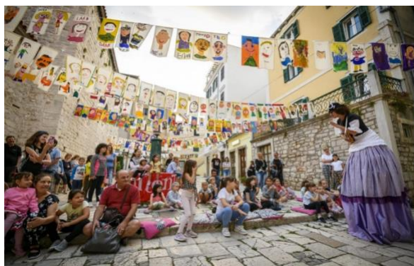
Slika 3. MDF Šibenik

Međunarodni dječiji festival – prvi put je festival održan 1958.godine kao realizacija i inovacija nekolicine koji su bili zaljubljeni u umjetnost posvećenoj djeci, a nedugo nakon toga stvara se kao veliki festivalski mehanizam. Festival općenito počne kroz lipanj i traje dva tjedna. U ponudi su razni sadržaji namijenjeni najmlađima, filmovi na stepenicama starog dijela grada, novinarske radionice, radionice filma, videa i kiparstva, slikanja, stripova, glazbe, plesa itd. Na šibenskim ulicama nastaje razigrana i bujna atmosfera puna dječjih glasova i smijeha. Festival na dan otvorenja obilježava i veliki, raskošan vatromet.