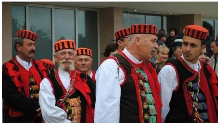
Slika 6. Šibenska kapa

Danas se stari oblik šešira čuva u Državnom etnografskom muzeju u Beču, Etnografskom muzeju u Splitu, Etnografskom muzeju u Zagrebu, Narodnom muzeju u Zadru, Muzeju grada Šibenika, Muzeju grada Drniša i Kninskom muzeju. Današnja šibenska kapa je zapravo mješavina šibenske i drniške. Umijeće izrade šibenske kape nematerijalno je kulturno dobro. Mnogi javni dužnosnici diljem svijeta promovirali su Šibenik i Šibensku kapu kao povijesni hrvatski proizvod, a ponajviše hrvatski tenisač Goran Ivanišević kod Pape na primanju 1995. godine, 27. listopada.