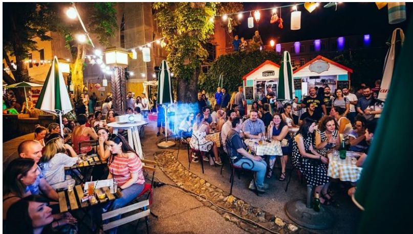
Slika 6. Ljeto na Strossu, Zagreb 2022.