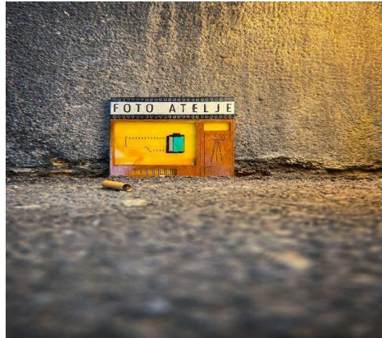
Slika 12. Jedan od primjeraka izložbe Mali Zagreb