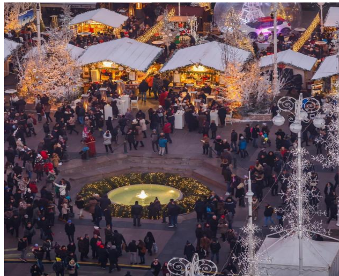
Slika 17. Trg bana Josipa Jelačića u vrijeme Adventa