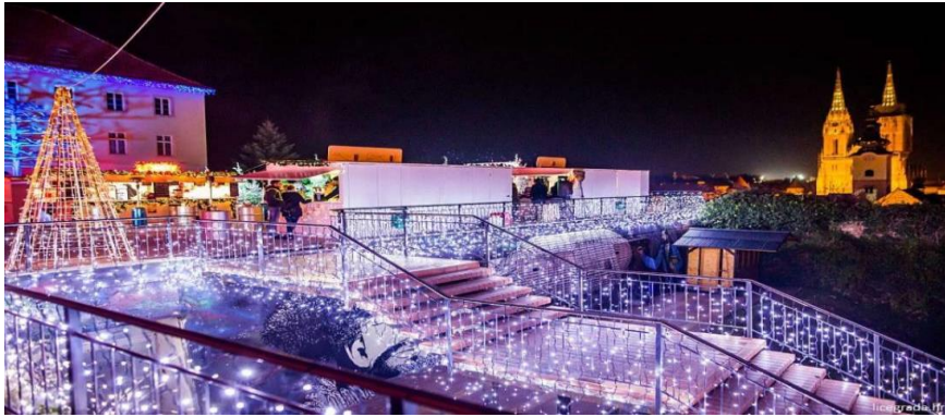
Slika 16. Jedan od punktova na Gornjem gradu