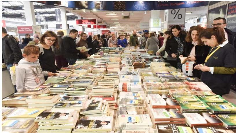
Slika 10. Interliber na Zagrebačkom velesajmu