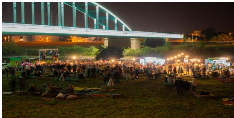
Slika 11. Prvi Green River Fest