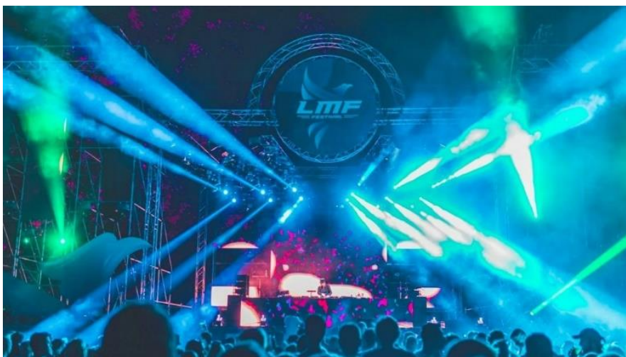
Slika 13. Lets dance Fest, Zagreb 2022.