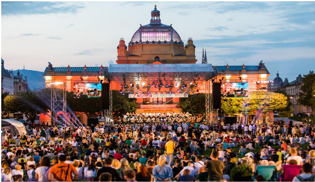
Slika 8. Zagreb Classic na trgu kralja Tomislava, Zagreb 2022.