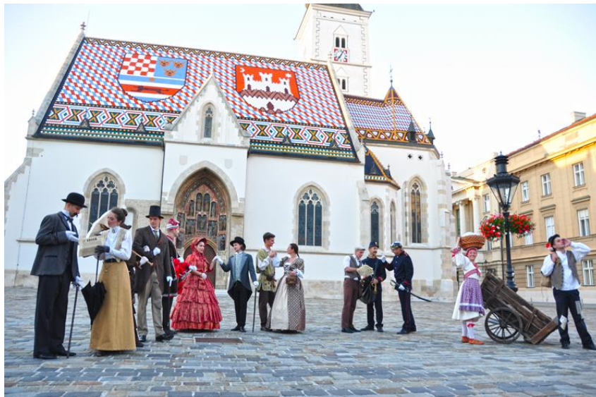
Slika 5. Zagrebački vremeplov na Markovom trgu u Zagrebu