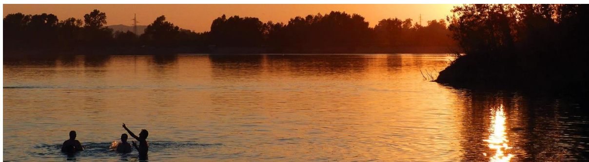
Slika 2. Jezero Zajarki u Zagrebu