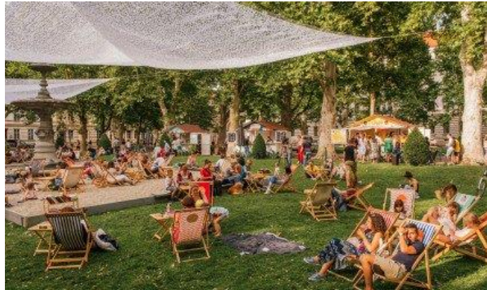
Slika 9. "Plaža na Zrinjevcu"