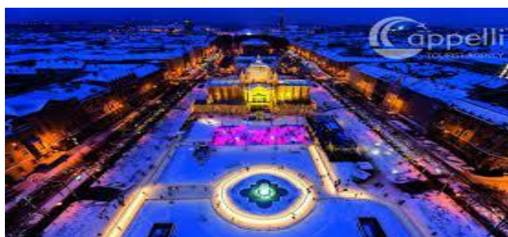
Slika 14. Klizalište na Trgu kralja Tomislava