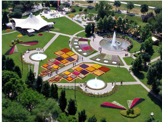
Slika 3. Floraart festival u Zagrebu 2022. godine