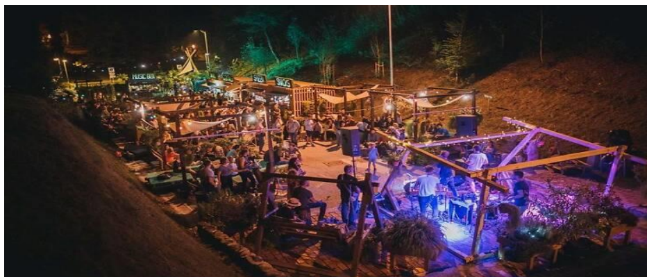
Slika 7. Pop-Up Summer Garden na Tuškancu u Zagrebu