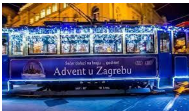
Slika 15. Veseli tramvaj