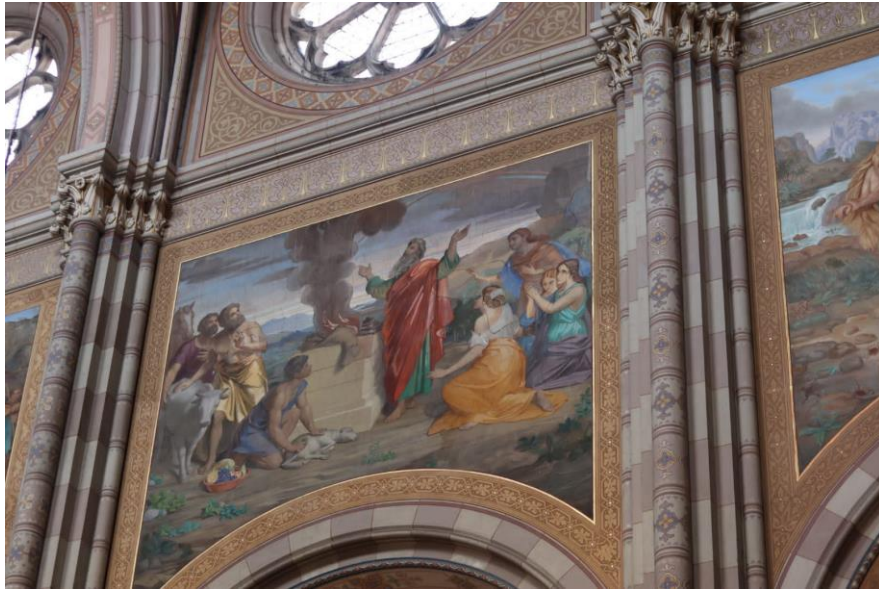
Slika 4. Unutrašnjost katedrale