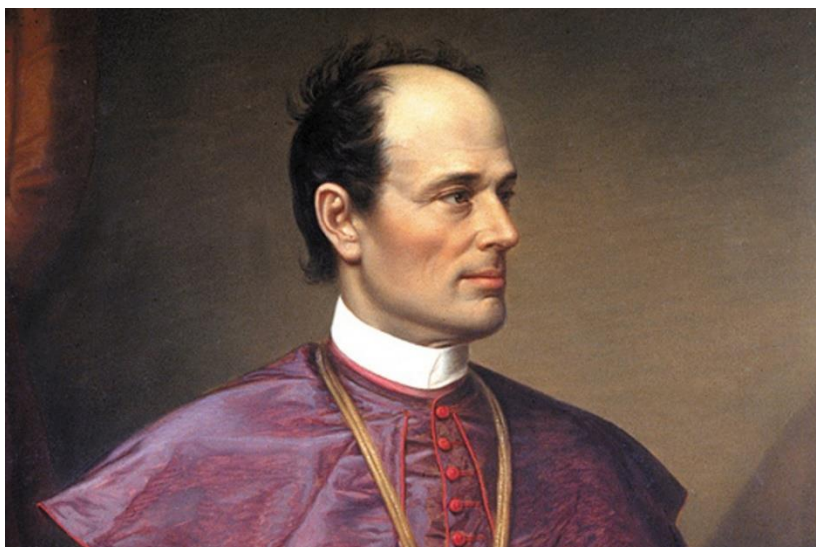
Slika 3. Biskup za vrijeme svojeg biskupstva