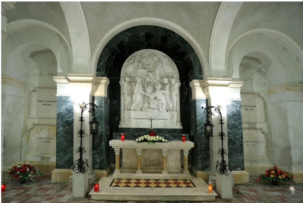
Slika 5. Grob J. J. Strossmayer u kripti Sv. Petra u Đakovu

Biskup Josip Juraj Strossmayer preminuo je 8. svibnja 1905. u Đakovu. Smrt ovog izuzetno važnog kulturnog i političkog lidera značila je kraj života osobe koja je imala dubok utjecaj na razvoj hrvatske kulture, znanosti i društva tijekom 19. i početkom 20. stoljeća. Neke od njegovih ideja nije uspio ostvariti dok je bio živ, ali se to dogodilo nakon njegove smrti.