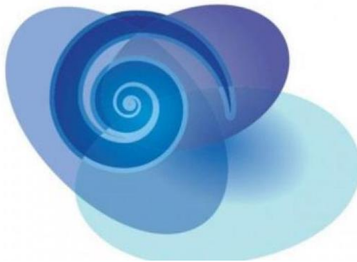
SLIKA 3. Nacionalan program ranog otkrivanja raka debelog crijeva