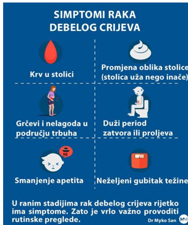
SLIKA 4. Simptomi karcinoma debelog crijeva