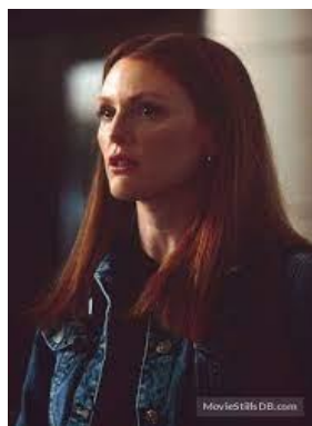
Slika 9, Julianne Moore kao Clarice Starling, izvor Pinterest, preuzeto 23. kolovoz 2023.