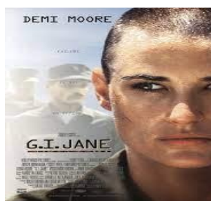
Slika 6, G.I. Jane , izvor IMDb , preuzeto 23. kolovoza 2023.

Ovaj film jasno pokazuje koliko je ženama teško uspjeti u nekim područjima i sektorima jer im se jednako protive i muškarci i žene. Ovdje je primjetna izloženost Jordan svim oblicima nasilja (verbalno, fizičko, psihološko i seksualno) te njena sposobnost i odlučnost da se od toga samostalno brani. Film šalje poruku o jednakosti i kako žene zaslužuju osnovno poštovanje bez obzira na profesiju. Demi Moore u filmu kroz lik Jordan pokušava prikazati s kakvim bitkama se žene suočavaju kada ulaze u hijerarhiju tradicionalnog muškog poretka. Neposustajanje, upornost, samouvjerenosti i spretnost sve su karakteristike koje krase O'Neil.