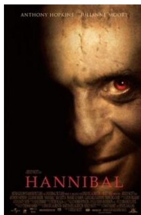
Slika 8, Hannibal

Možemo reći kako je Clarice nemirna i nervozna tijekom cijelog filma, ovo stanje možemo opravdati opaskom kako uvijek neki muškarac tajno nadgleda njezine korake. Unatoč tomu, žena je ovdje pokretač akcije i nije samo puki objekt požude koji se samo gleda. Ona rukuje oružjem, prati kriminalce i ubojice pa se ne ustručava taknuti prekidač niti ići za svojom opsesijom. Time se uzdiže od tradicionalno predstavljene žensklosti. Zadnji prizor filma prikazuje njegov bijeg dok je u avionu. Prikazana je intrigantna scena Lectera gdje sjedi pored malenog dječaka. Lecter želi ručati i otvara posudu s ručkom, a njoj se nalaze ljudski ostatci. Dječak pored njega traži da proba što jede. Ovaj mu daje i napomije da je uvijek dobro probati nove stvari.