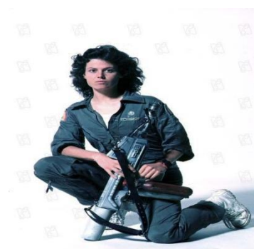
Slika 2, Ellen Ripley