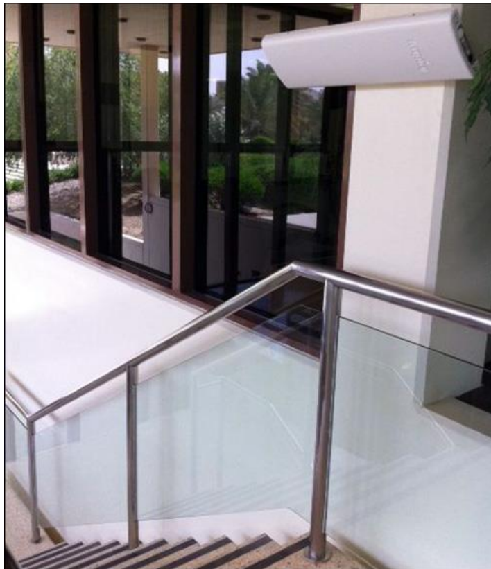
Slika 12 - Impinj xPortal čitač

Sada se škola nada da će upotrijebiti tehnologiju kako bi osigurala brzu dostavu odgovarajuće pošte i kako bi osigurala podatke o lokaciji osoblja koje prolazi kroz portale iz sigurnosnih razloga. Na taj će način sveučilište moći pratiti koja osoba unosi koju imovinu u pojedinu zgradu ili iz nje, kao i upozoriti osobu prije nego što nenamjerno uđe u odvojeni prostor u kojem se nalaze pripadnici suprotnog spola. (RFID Journal, 2013)