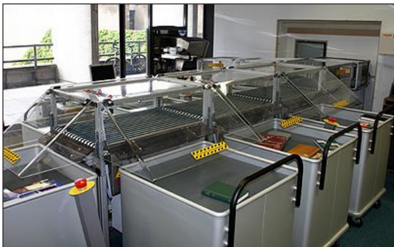
Slika 15 – Uređaj za sortiranje knjiga pri povratu na Sveučilištu u Istočnoj Angliji