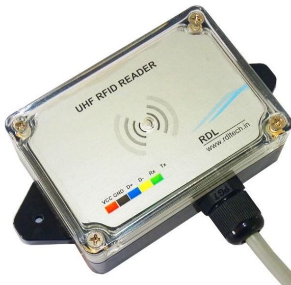
Slika 7 - Ultravisokofrekventni RFID čitač

Ultravisokofrekventni (UHF) RFID sustavi , prikazani na slici 7, rade na frekvenciji od 868-915 MHz. UHF RFID sustavi imaju najveći domet očitavanja od svih RFID sustava, koji doseže do desetke metara, što ih čini idealnim za upotrebu u logističkim i transportnim aplikacijama, kao što je upravljanje teretom i praćenje vozila. Duži raspon očitavanja UHF RFID sustava čini ih manje osjetljivima na smetnje izazvane preprekama, što ih čini prikladnima za korištenje u otvorenim i vanjskim okruženjima. (Want, 2006)