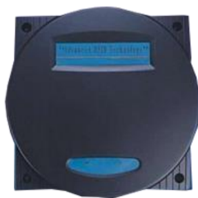
Slika 5 - Niskofrekventni RFID čitač

Niskofrekventni (LF) RFID sustavi (slika 5) rade na frekvenciji od 125-134 kHz. LF RFID sustavi imaju relativno mali raspon očitavanja, obično nekoliko centimetara, što ih čini idealnim za upotrebu u aplikacijama gdje je potrebna neposredna blizina, kao što je praćenje životinja i kontrola pristupa. Niskofrekventni RFID sustavi su također manje osjetljivi na smetnje od metalnih predmeta i drugih elektroničkih uređaja, što ih čini prikladnima za upotrebu u industrijskim i teškim okruženjima. (Want, 2006)