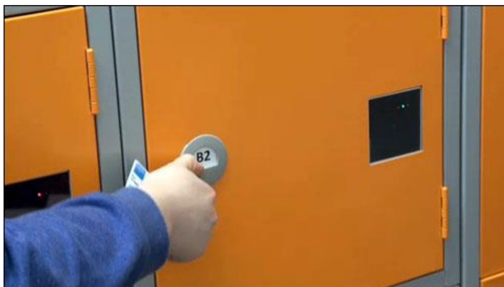
Slika 13 - TrackPoint ormarić

Student iz Kingstona otključava TrackPoint ormarić (prikazan na slici 13) dodirrom svoje osobne iskaznice na HF čitač ugrađen u vrata ormarića i stavlja posuđeni dio opreme unutra. Sustav zatim očitava UHF oznaku artikla, provjeravajući tako vraćeni artikl. Sveučilište je tražilo rješenje koje bi studentima omogućilo vraćanje opreme izvan radnog vremena. Bez sustava neki su studenti bili skloni jednostavno staviti opremu izvan prostora za posudbu kako bi je osoblje moglo preuzeti sljedeći radni dan, ostavljajući uređaje osjetljivima na krađu.