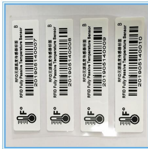
Slika 4 - RFID oznake osjetljiva na temperaturu