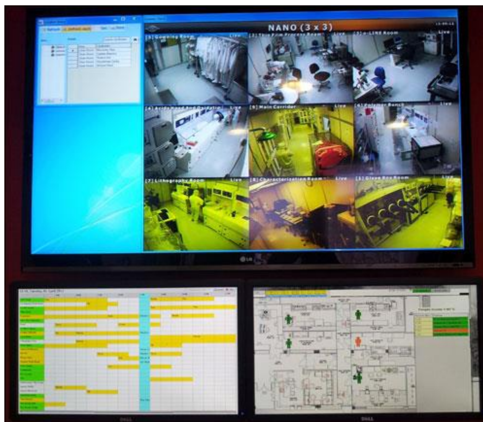
Slika 16 - Sučelje programa za praćenje na Hebrejskom Sveučilištu