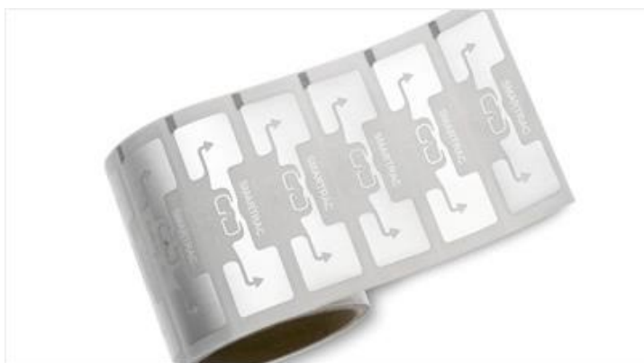
Slika 1 - Pasivna RFID Oznaka