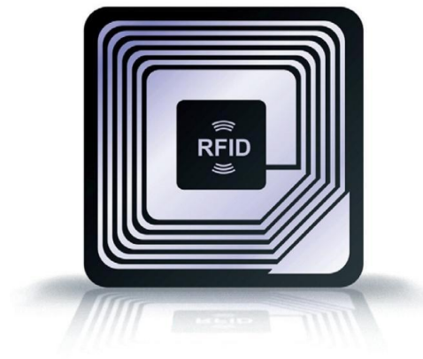
Slika 3 - Polu-pasivna RFID oznaka