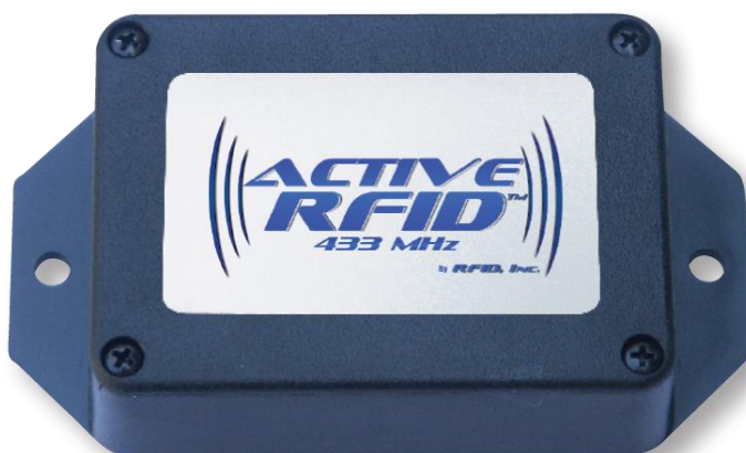
Slika 2 - Aktivna RFID oznaka