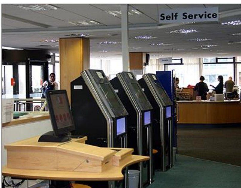
Slika 14 - uređaj za automatsku posudbu knjiga na Sveučilištu Istočne Anglije

Sustav koristi pasivne 13,56 MHz RFID naljepnice prikačene na knjige i druge medije u zbirci knjižnice od 700.000 komada. Instaliran je automatizirani blagajnički šalter koji svi korisnici mogu koristiti za posuđivanje knjiga. Brojači, prikazani na slici 14, su ugrađeni s RFID ispitivačima. Kako bi provjerili knjige, posjetitelji mogu skenirati svoju staru knjižničku iskaznicu s bar-kodom na ugrađenom skeneru na šalteru ili prinijeti novoizdanu karticu s ugrađenom oznakom od 13,56 MHz do RFID čitača. Nakon što zaslon prikaže informacije o računu posuđivača, knjige ili drugi mediji prikazuju se RFID ispitivaču na provjeri.