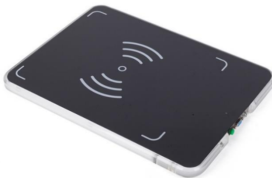
Slika 6 - Visokofrekventni RFID čitač

Ultravisokofrekventni (UHF) RFID sustavi , prikazani na slici 7, rade na frekvenciji od 868-915 MHz. UHF RFID sustavi imaju najveći domet očitavanja od svih RFID sustava, koji doseže do desetke metara, što ih čini idealnim za upotrebu u logističkim i transportnim aplikacijama, kao što je upravljanje teretom i praćenje vozila. Duži raspon očitavanja UHF RFID sustava čini ih manje osjetljivima na smetnje izazvane preprekama, što ih čini prikladnima za korištenje u otvorenim i vanjskim okruženjima. (Want, 2006)