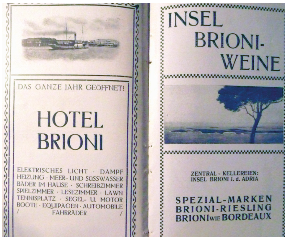
Slika 3. Prvi brijunski vodič

o turističkim dolascima: u razdoblju od 1904. do 1909. više od 50 posto gostiju dolazilo je iz Beča, 10 posto iz Graza, 30 posto iz ostalih dijelova Austrije, a preostalih 10 posto činili su strani gosti. Dok je 1904. i 1905. na otočju godišnje boravilo prosječno 5.000 osoba, nakon uvođenja parobrodске linije Pula - Brijuni 1906. (dotad se na otok stizalo preko Vodnjana i Fažane) bilježi se već 15.000 dolazaka. Unapređenjem prometne infrastrukture (parobrodskih veza, a posebice nakon uvođenja direktne željezničke veze iz Beča za Pulu) broj gostiju povećao se od 1907. do 1909. na čak 30.000 godišnje. Stoga budućnost leži u proširenju kapaciteta i daljnjem unapređenju prometne infrastrukture, razvoju zdravstvenog, kulturnog, ali i kongresnog turizma te korištenju blagodatne blage mediteranske klime, koja omogućava i dulje zimske i proljetne boravke. 4