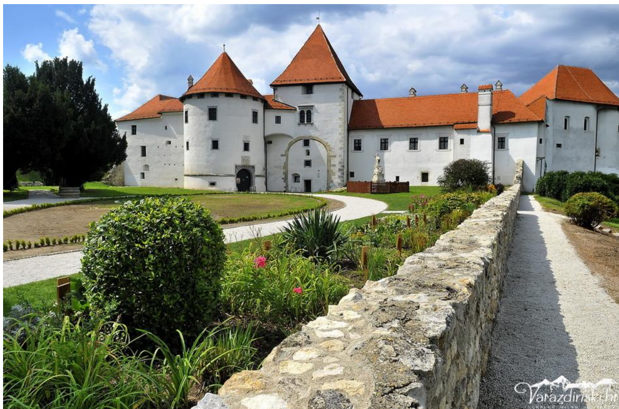
Slika 2. Stari grad Varaždin