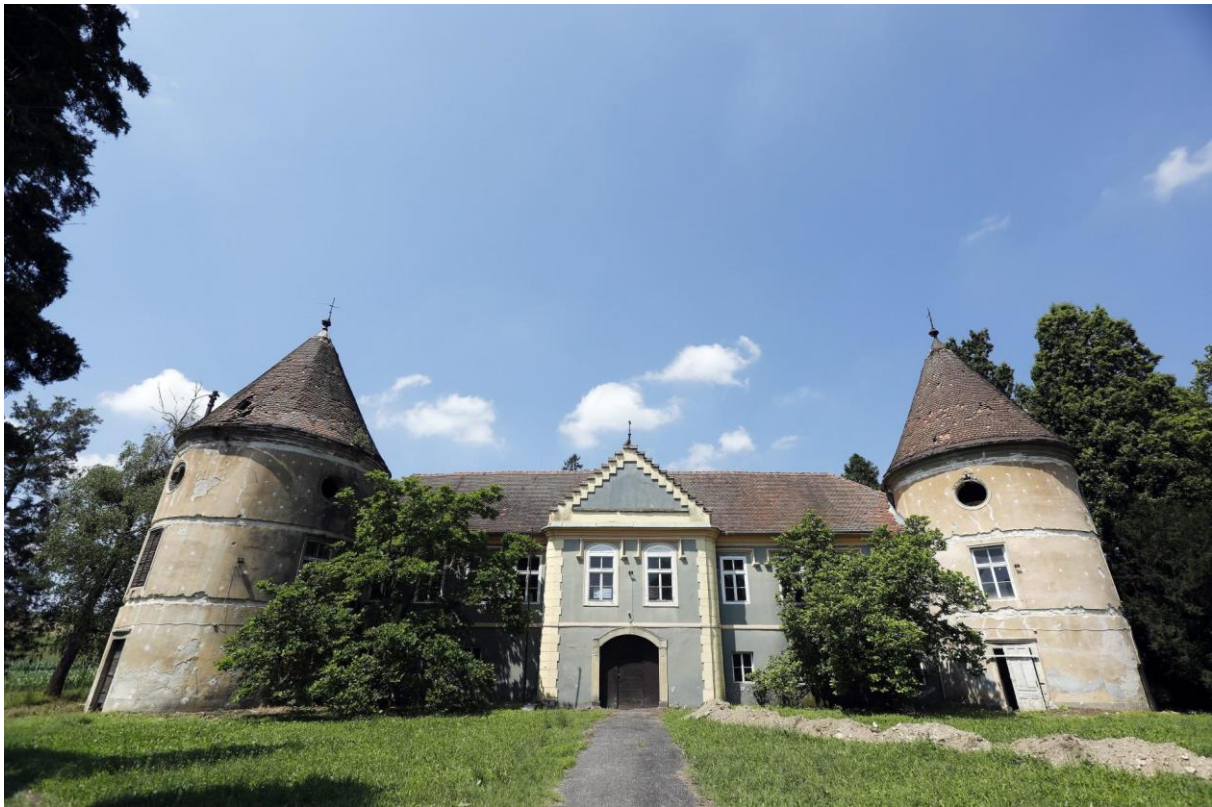
Slika 3: Dvorac Erdödy-Rubido