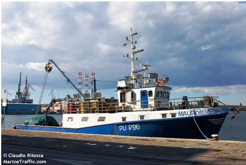
Slika 1. Jedna od najpoznatija pulskih plivarica brod Mauros Jedan