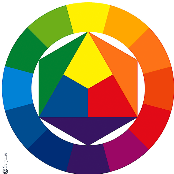
Immagine 2 - Il cerchio dei colori secondo Itten

All'interno dei colori primari e secondari, abbiamo anche tre coppie di colori chiamati complementari. Ogni coppia di colori complementari è formata da un primario e dal secondario ottenuto dalla mescolanza degli altri due primari. Per sapere qual è il colore complementare del colore primario giallo, bisogna mischiare gli altri due primari, il rosso e il blu: si ottiene il viola che risulta essere il complementare del giallo. Ogni coppia di