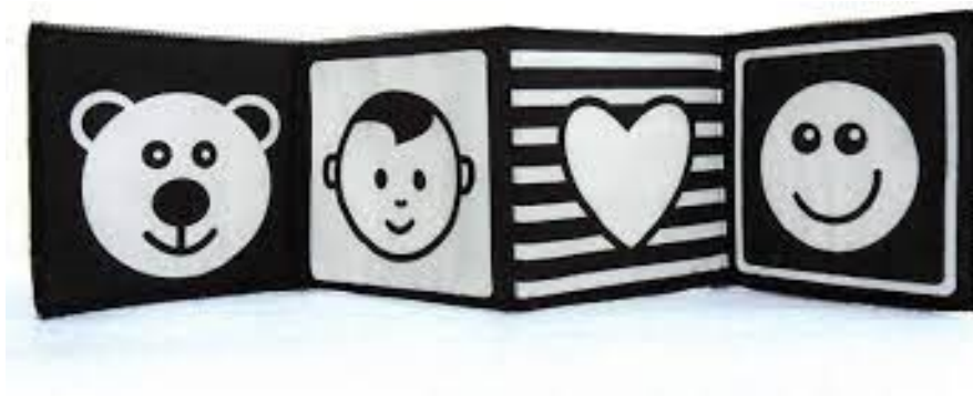
Immagine 3 - Esempio di libricino

particolare, per la percezione dei colori nelle prime settimane di vita è importante sapere che i bambini non vedono il mondo a colori, ma l'esterno appare loro in bianco e nero con diverse tonalità di grigio. È per questo motivo che i neonati prediligono immagini con forti contrasti di luce e ombra nelle prime settimane di vita, appunto per la percezione del mondo in bianco e nero. In questa fase abbiamo diversi metodi per stimolare le loro capacità visive, come ad esempio i libricini in bianco e nero ad alto contrasto con forme geometriche o contorni definiti. I bambini ne sono estremamente attratti. Nel proporre questi libricini, è fondamentale porli correttamente di fronte al bambino, assicurandosi di posizionarli né troppo vicino né troppo lontano. Idealmente non più di 20-25 cm, per poi allontanare e avvicinare la figura finché il bambino è riuscito a mettere a fuoco l'immagine.