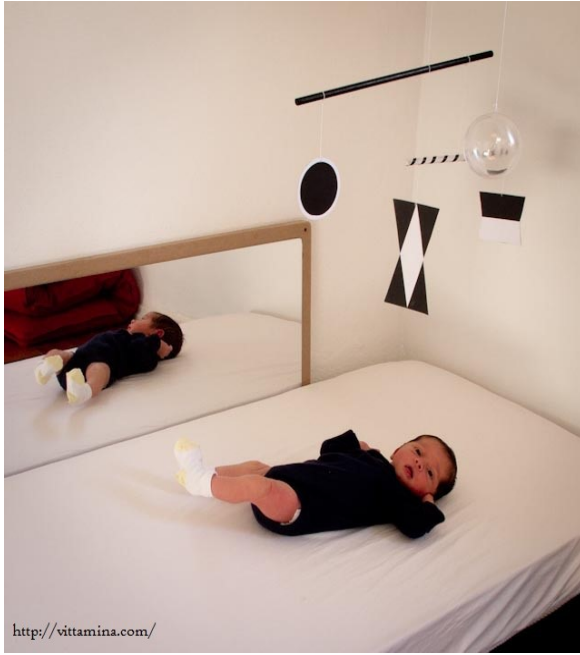
Immagine 4 - La giostra di Munari

Proprio per questa finalità di sviluppo sensoriale, Maria Montessori introdusse delle giostrine in movimento da posizionare non sulla culla, luogo che il neonato deve sempre associare al riposo e alla nanna, ma in luoghi dove il neonato solitamente è sveglio e può concentrarsi nella sua attività sensoriale. In base all'età e allo sviluppo della vista del neonato, si potranno presentare varie giostre con finalità di sviluppo diverse e, ovviamente, crescenti. Attraverso un gioco di movimenti e senza l'ausilio di suoni, il neonato può perfettamente concentrarsi ed esercitare la messa a fuoco degli oggetti presenti sulla giostra, percepirne la profondità e distinguerne la presenza di colori. Una caratteristica fondamentale della giostra di Munari è proprio l'assenza di suoni. Questa caratteristica montessoriana la rende unica e la rende diversa da tutti gli altri tipi di giostrine che si trovano in commercio, accompagnate sempre da vari motivi sonori. È proprio l'assenza del suono che favorisce la concentrazione del neonato come presupposto necessario per far svolgere il gioco con finalità di sviluppo sensoriale. Molto importante è inoltre, accanto alla scelta del luogo dove appendere la giostrina, metterla all'altezza giusta, visto che, inizialmente, il neonato riesce a percepire gli oggetti esclusivamente da vicino. Pertanto, è bene posizionarla ad un'altezza non troppo vicina da poter essere afferrata, ma nemmeno troppo lontana che porterebbe a non vederla affatto.