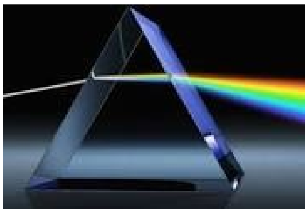
Immagine 1 - Spiegazione della rifrazione della luce secondo Newton

Il colore è un mezzo educativo di enorme importanza per chiunque si occupi dell'infanzia, specialmente perché i bambini, tramite l'uso del colore, ci permettono di attribuire un significato alle loro emozioni e sensazioni che non riescono ancora a esprimere con le parole. Con il colore possiamo entrare in un certo senso nel loro mondo interiore. Infatti, già nel primo anno di vita del bambino possiamo osservare come attraverso gli scarabocchi e i colori usati per crearli, questo manifesta il suo bisogno di attenzione, tenerezza, ma anche la frustrazione e le tensioni, mediante il solo uso della propria percezione interna del colore. Per capire meglio questo processo è fondamentale partire dalla comprensione di che cosa sia il colore. Le definizioni spesso sono complesse e non è facile spiegare cosa sia il colore. Fino al 1666 si credeva il colore fosse presente negli oggetti indipendentemente dalla luce nella quale venivano osservati. La spiegazione di cosa sia il colore arriva dallo scienziato Isaac Newton, che negli esperimenti che condusse tra il 1665 e il 1666, osservò che, facendo passare un raggio di luce solare attraverso una fessura colpendo poi un prisma triangolare, essa si scomponesse a ventaglio ottenendo la cosiddetta "striscia cromatica dello spettro": rosso, arancio, giallo, verde, blu, indaco e viola. Newton chiama questa serie di colori "spettro" (in