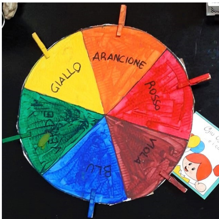
Immagine 5 - La ruota dei colori Montessori