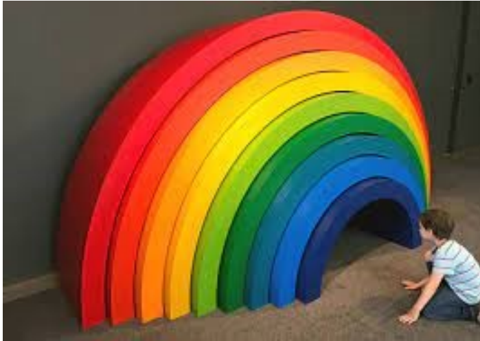
Immagine 9 - L'arcobaleno gigante

L'arcobaleno più grande è chiamato “gigante” e può diventare un vero e proprio pezzo di arredamento. In questo caso sono utili, ad esempio, per abbellire ludoteche, asili nido e scuole materne. Quando vediamo un bambino impegnato a creare una torre con dei cubi, dobbiamo sapere che attraverso il gioco sta formando e allenando la sua capacità di concentrazione e di misurazione dello spazio, oltre alla sua capacità oculo-motoria. Questo tipo di giochi per bambini, ancor di più quando si tratta di giochi in legno e in materiali naturali, li aiuta ad avere a disposizione un ambiente vario e ricco di stimoli che è fondamentale per il corretto sviluppo cognitivo dei bambini. 17