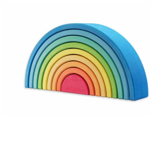
Immagine 7 - L'arcobaleno dei colori

Uno degli strumenti che si utilizzano al giorno d'oggi nell'educazione ai colori è l'arcobaleno dei colori di R. Steiner, ovvero, l'arcobaleno steineriano.