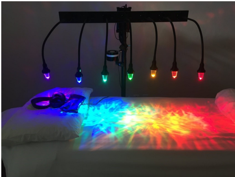
Immagine 6 - Uso della cromoterapia

per effetto della risonanza invia un'informazione agli organi di coordinazione endocrina del cervello. Questi rimandano il giusto input al corpo in modo da ristabilire l'armonia e risolvere il problema. Questo studio della luce e dei colori ha portato, nel corso dei secoli, alla consapevolezza dell'effetto che essi hanno sull'essere umano. I colori vengono infatti utilizzati a fini terapeutici, per il mantenimento del benessere psico-fisico e la cura di disturbi e malesseri dei bambini. 15