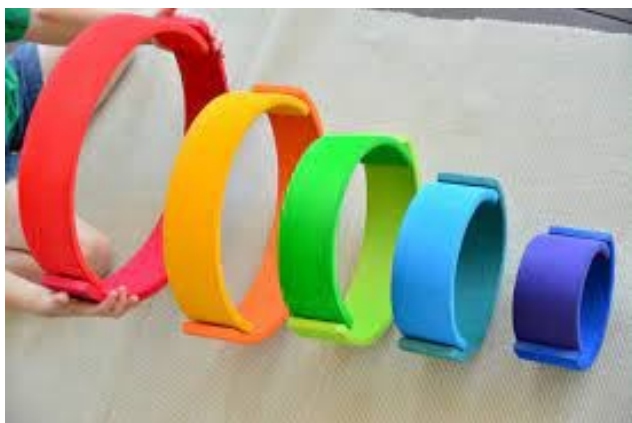
Immagine 8 - Possibile uso dell'arcobaleno dei colori

Solitamente possiamo trovare questo arcobaleno nelle scuole Waldorf che seguono il metodo educativo basato sulla filosofia e la pedagogia di Rudolf Steiner e nelle case di chi ama i giochi in legno o conosce il metodo Steiner. I pezzi dell'arcobaleno steineriano sono dei veri e propri mattoni da costruzione in legno con cui il bambino può creare il proprio mondo su misura seguendo l'immaginazione. Il gioco è utile per insegnare ai bambini i colori e i loro nomi o, semplicemente, come accompagnamento a storie da raccontare e da inventare. I colori dell'arcobaleno steineriano sono vivaci e mettono allegria, sono uno stimolo per i bambini dal punto di vista della creatività.