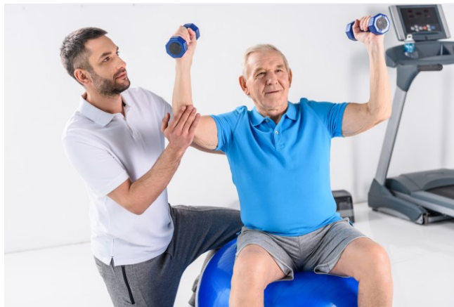
Slika 3. Primjer kardiološke rehabilitacije

Studije u raznim zemljama također su potvrdile da umjerena tjelovježba može smanjiti rizik od koronarne bolesti srca, zatajenja srca. Kako bi se maksimiziralo poboljšanje razina kardiovaskularnih metaboličkih markera rizika, relevantne smjernice i konsenzus stručnjaka, dali su specifične preporuke u pogledu načina, ciklusa, intenziteta i trajanja vježbanja. Učinci tjelesne aktivnosti na metaboličko zdravlje kardiovaskularnog sustava mogu ovisiti o cirkadijalnom ritmu. Budući da izraženost kardiovaskularnih čimbenika rizika pokazuje 24-satnu fluktuaciju, stoga vježbanje u različito doba dana također može imati različite učinke na metaboličko zdravlje kardiovaskularnog sustava (Liu i sur., 2022).