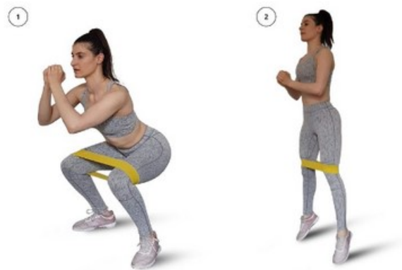
Slika 2. Primjer aerobne vježbe - čučanj skok sa trakom