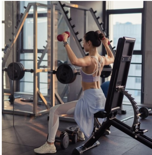
Slika 1. Primjer anaerobne vježbe

se obično smatraju anaerobnim (Slika 1) sastoje se od brzih trzaja mišića i uključuju sprint, intervalni trening visokog intenziteta, power-lifting, itd. Kontinuirani anaerobni metabolizam, drugim riječima, anaerobna tjelovježba, uzrokuje trajno povećanje laktata i metaboličku acidozu, a ta se prijelazna točka naziva anaerobnim pragom.