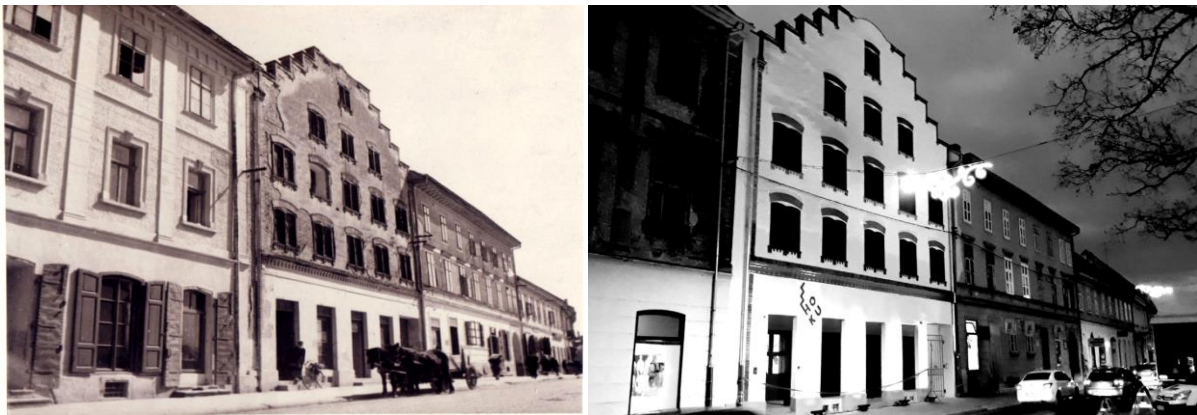
Slika 8. Holandska kuća prije obnove (lijevo) i nakon obnove (desno)