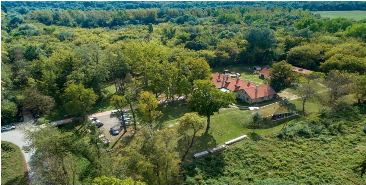
Slika 15. Kuća u prirodi – eko centar Zlatna Greda