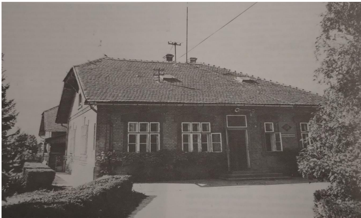
Slika 14. Pustara Brestovac, upravna zgrada