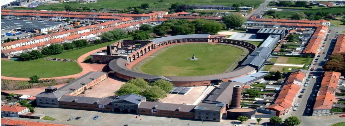
Slika 1. Grand-Hornu