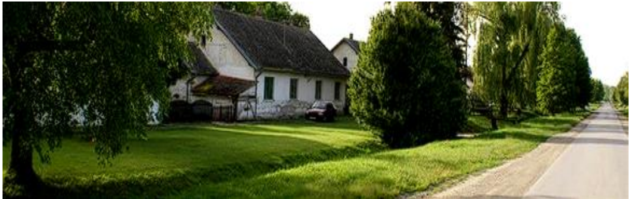
Slika 17. Pustara Kozjak