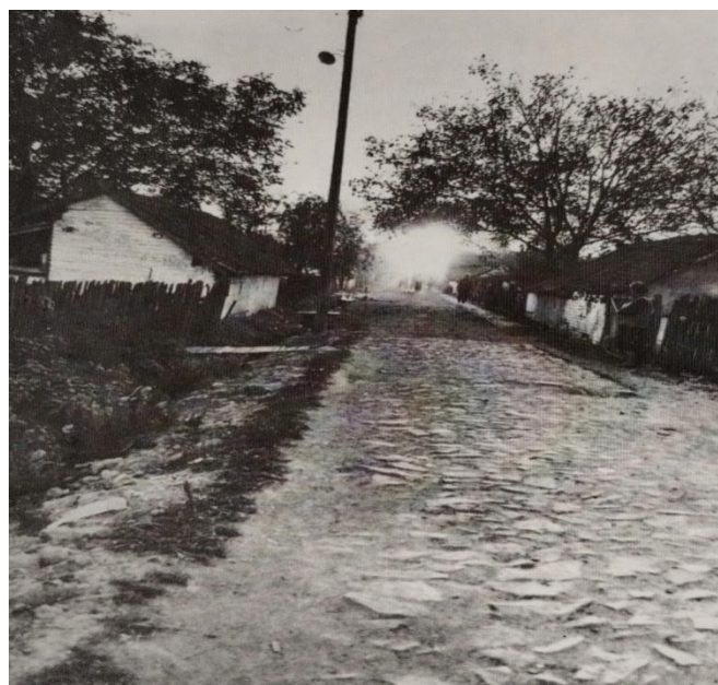
Slika 20. Pustara Zeleno polje – kako je bilo nekada