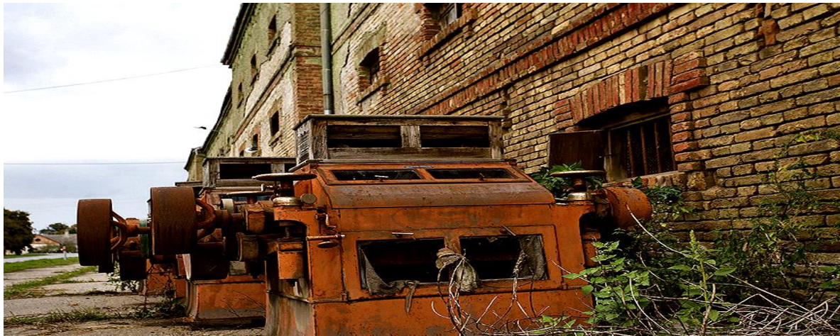
Slika 10. Napuštena zgrada stočnog skladišta u pustari Mirkovac

3000m 2 skladišnog prostora (sl.10.), a kao što je navedeno to je jedina pustara gdje je obnovljena i nadograđena škola za prihvata više učenika. 115