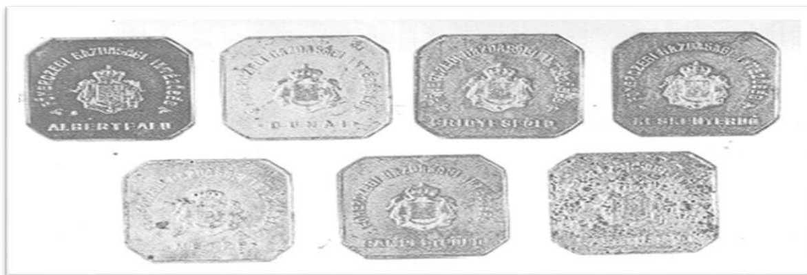
Slika 11. Radni žetoni pustara