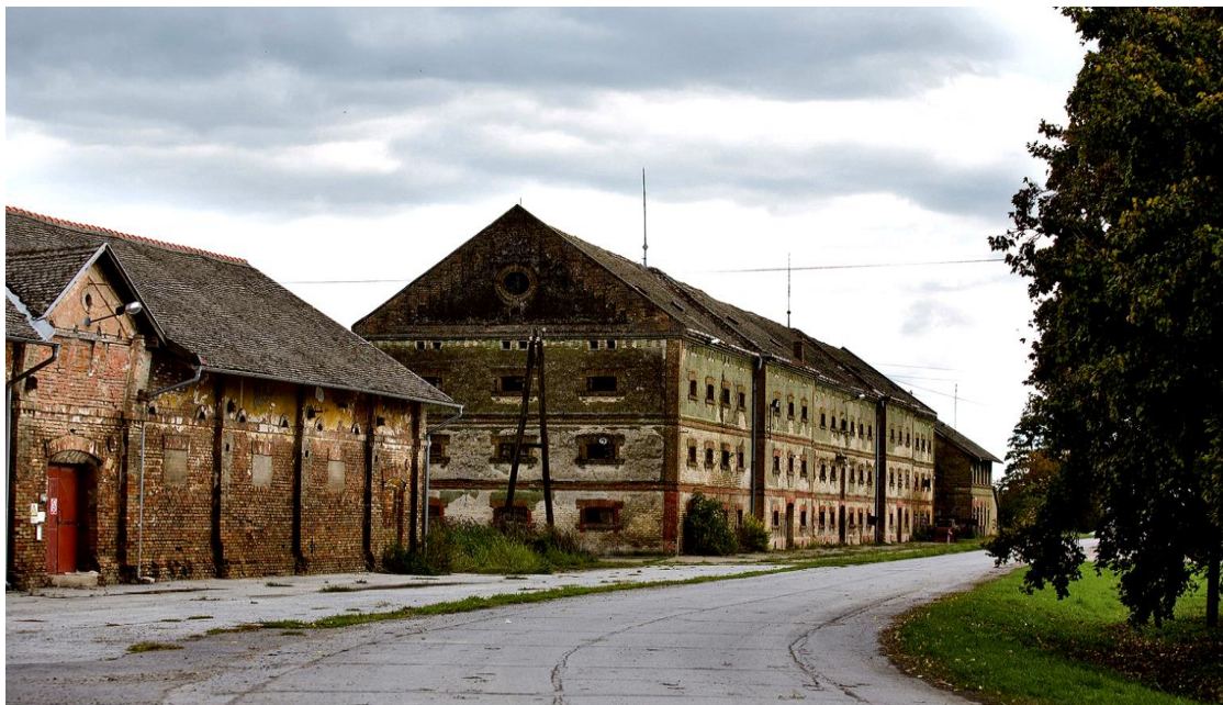
Slika 22. Zgrada predložena za revitalizaciju

U ovom slučaju izabran je objekt skladišta (sl.22.) u pustari Mirkovac te se predlaže za revitalizaciju i prenamjenu u Multidisciplinarni edukacijski centar Baranje (MECB).