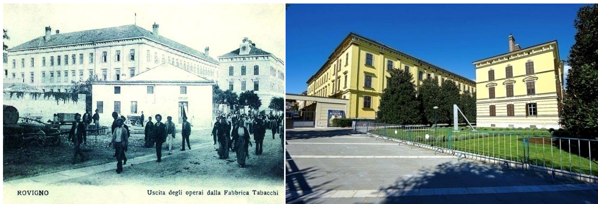
Slika 7. Tvornica duhana prije obnove (lijevo) i nakon obnove (desno)