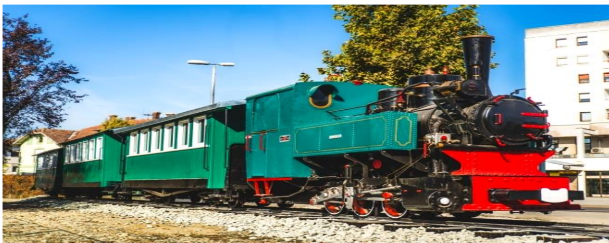
Slika 19. Vlak „Ćiro“ kao turistička atrakcija