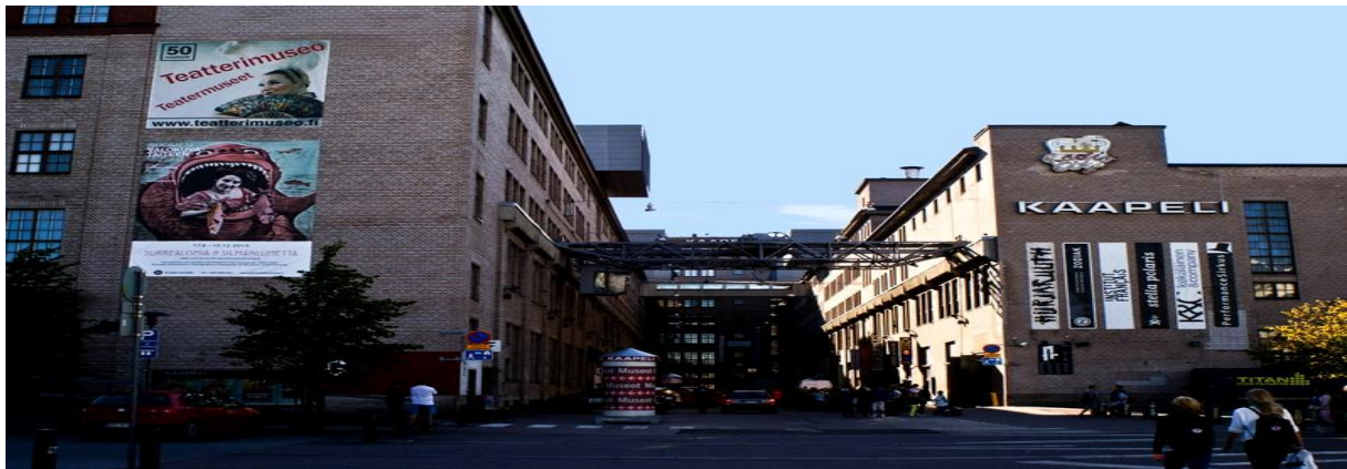
Slika 2. Kaapeli – kulturno društveni centar