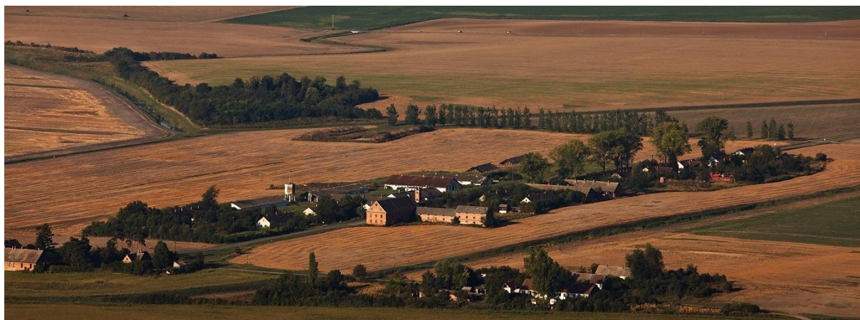
Slika 13. Jasenovac danas