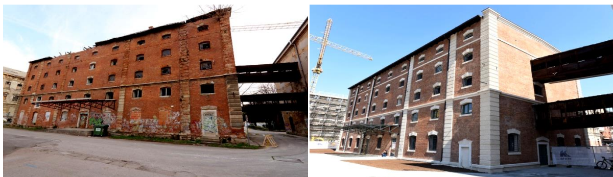
Slika 5. Dječja kuća prije obnove (lijevo) i Dječja kuća nakon obnove (desno)