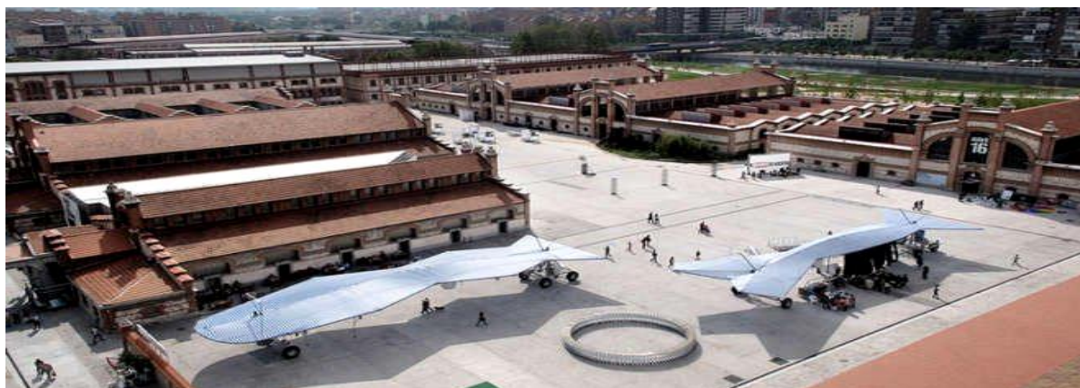
Slika 3. Matadero – centar kulture