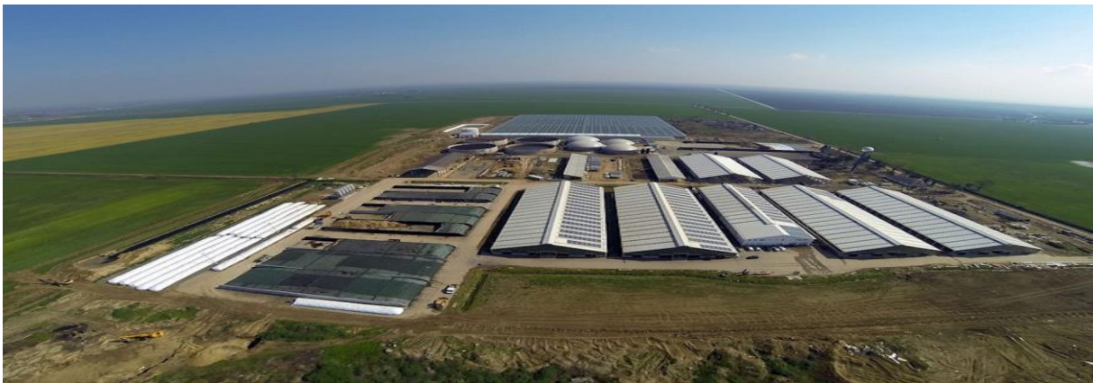
Slika 12. Mitrovac farma