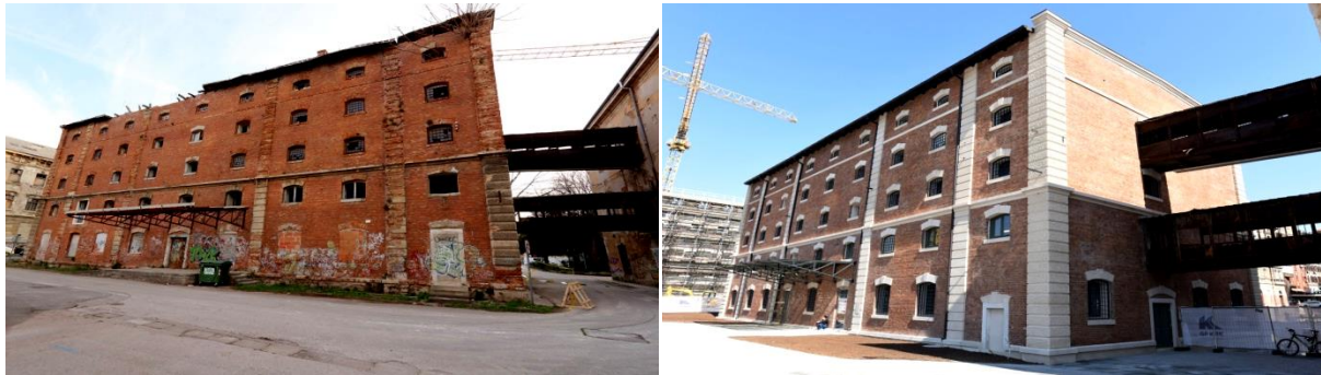
Slika 5. Dječja kuća prije obnove (lijevo) i Dječja kuća nakon obnove (desno)