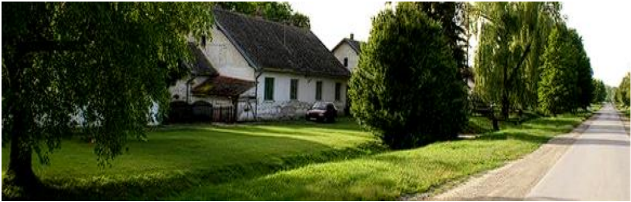
Slika 17. Pustara Kozjak