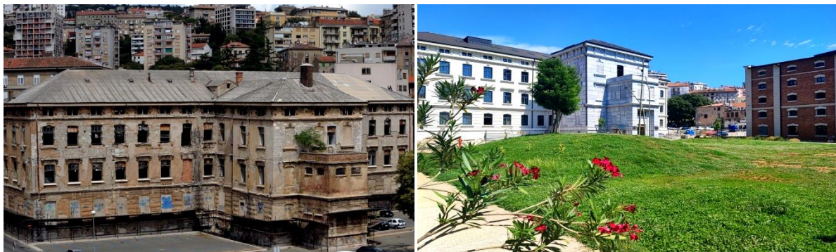
Slika 6. Gradska knjižnica prije obnove (lijevo) i Gradska knjižnica nakon obnove (desno)