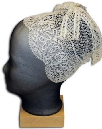
Slika 4. Poculica

U Međimurju su žene preko gornjeg dijela tijela prebacivale rubac. Rubac je bio velik i obično cvjetnog uzorka koji se prekrižio na prsima i vezao na leđima, a na nogama su žene umjesto opanaka nosile čizme ili visoke cipele koje su bile na vezanje. Motive kao što su rubac i čizmice možemo često vidjeti u tekstovima međimurskih popevki jer su to bili pokloni koje su muškarci nosili svojim izabranicama (Miholić, 2009).