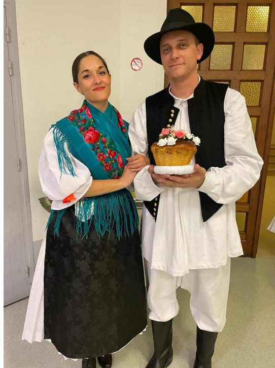
Slika 5. Narodna nošnja Međimurja

Na fotografiji je prikazana narodna nošnja međimurskog kraja. Muškarac u rukama drži bidru, tradicionalni kolač iz Međimurja. Kolač se radio od tradicionalnih namirnica koje su karakteristične za međimurski kraj kao što su orasi, mak i sir. Narodni običaj bio je da u vrijeme svatova mlade djevojke ( snehe ) plešu s bidrama na glavi za plodnost mladog bračnog para, a mnoga kulturno-umjetnička društva i danas njeguju taj tradicijski ples.