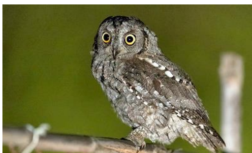
Slika 6. Ćuk

Da bi motivirali djecu za pjevanje pjesme Ćuk sedi možemo ih najprije upoznati sa izgledom te ptice tako da im pokažemo fotografiju ćuka.