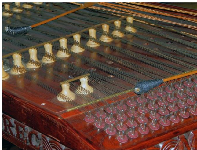
Slika 2. Cimbal (Podravske širine)

štapićima koji se nazivaju cape. Svirao se tako da se stavio na stol ili na poseban stalak, a u hodu bi ga svirač držao obješenog oko vrata. Cimbal su izrađivali samouki seljaci koju su ujedno bili i svirači. Cimbal se osim u sastavu mužikaša svirao i solistički ili kao pratnja pjevačima (Miholek 2016).