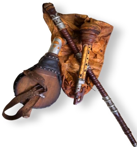
Slika 3. Četrveroglasne dude s laktačom (Hrvatska tradicijska glazbala, 2016)