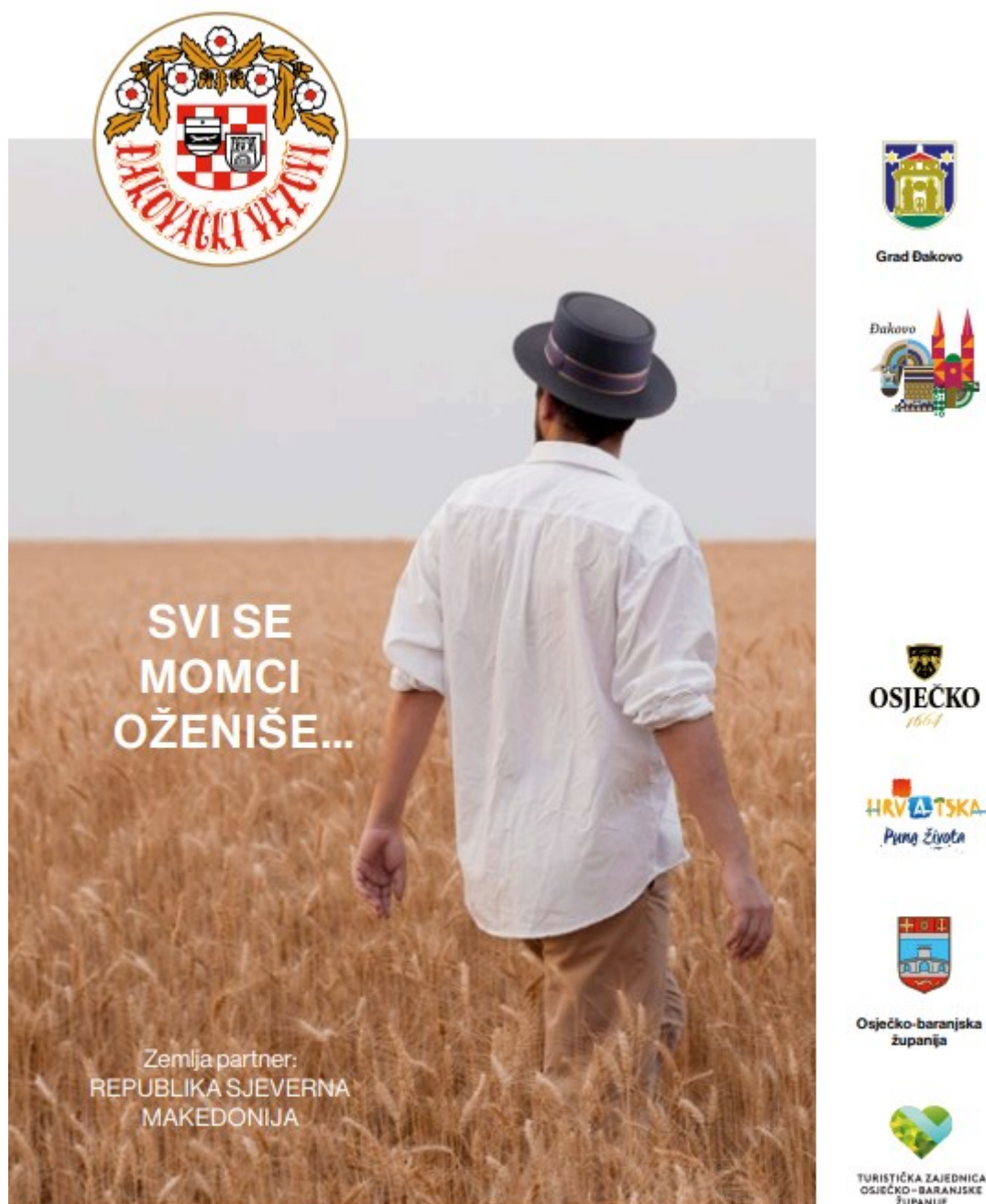
Slika 13. Naslovna stranica programa 57. Đakovačkih vezova