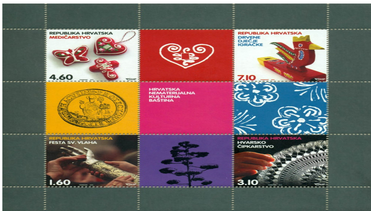
Slika 1. Hrvatska nematerijalna kulturna baština - poštanska marka

U nastavku slijede primjeri nematerijalne kulturne baštine Hrvatske koji su pod zaštitom UNESCO-a, što zorno prikazuje izdana poštanska marka.