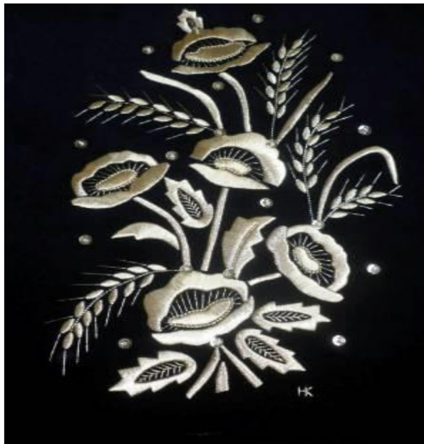
Slika 10. Cvjetni motiv - zlatovez

Vezilje su nastojale što vjernije prenijeti motive na platno, koji karakteriziraju kraj u kojem se veze motiv.