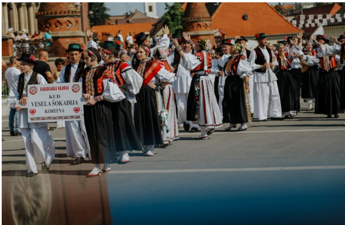
Slika 28. Svečana povorka 57. Đakovačkih vezova

s približno 2500 sudionika, 40 ukrašenih svatovskih zaprega te više od 50 jahača i jahačica. U povorci su se predstavile regije poput Slavonije, Baranje, zapadnog Srijema, Like, Međimurja, Podravine, Vrlike, Cetinske krajine, Konavala, a i strane skupine iz Sjeverne Makedonije, SAD-a, Meksika, Njemačke, Bosne i Hercegovine te mnogi drugi. Uz prepoznatljive zvuke tamburica, pjesmu i ples, povorka je oživjela grad Đakovo, privukla brojne posjetitelje i stvorila nezaboravan doživljaj. Topot konja dopunjavao je taj velebni spektakl, dok su sudionici demonstrirali svoju predanost očuvanju tradicije i kulture. Gosti su također dali svoj doprinos raznolikosti programa, što je dodatno obogatilo Đakovačke vezove i promoviralo raznolikost kulturnog nasljeđa. 69