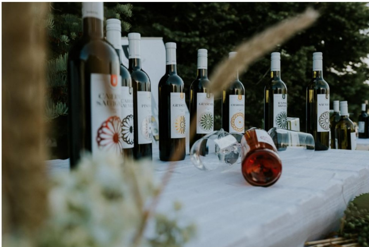
Slika 16. Dani otvorenih vinskih podruma

Osim glavnih odrednica programa, nalazi se i niz događanja koja su povezana s tradicijom, uključujući promociju dječjih radova na temu vezova te izložbe koje prikazuju narodne običaje.