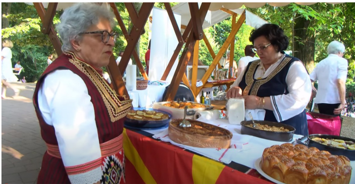
Slika 20. Gastronomska ponuda Sjeverne Makedonije

Osim toga, bile su organizirane radionice tradicionalnih zanata, gdje su posjetitelji mogli učiti vještine duboko ukorijenjene u makedonskoj tradiciji. Ove radionice omogućile su interakciju između posjetitelja i majstora zanata te pružile priliku za učenje i dijalog o kulturnoj baštini. Republika Sjeverna Makedonija također je predstavila svoje proizvode, omogućavajući posjetiteljima da se upoznaju s raznim proizvodima (slika 20.) koji odražavaju autentičnost i kvalitetu ove zemlje partnera. Ova kulturna razmjena između Đakovštine i Republike Sjeverne Makedonije dodatno je obogatila Đakovačke vezove (slika 21.).