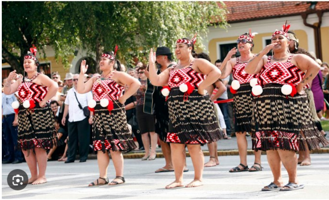
Slika 4. Maori s Novog Zelanda

U nastavku slijedi slika Maora s Novog Zelanda, koji su 2013. bili sudionici na Đakovačkim vezovima.