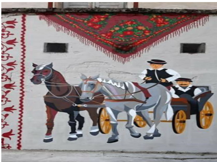
Slika 12. Motiv konjske zaprege