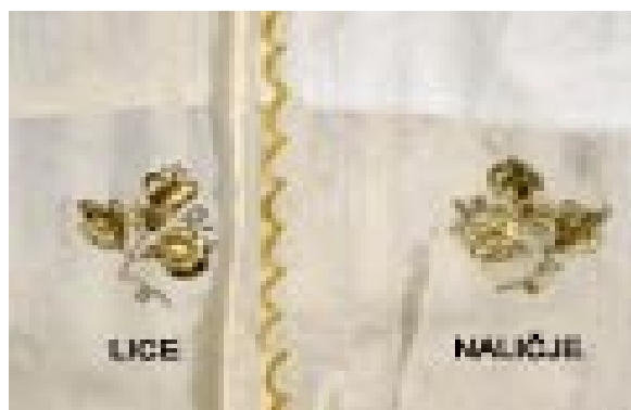
Slika 7. Zlatom naskroz