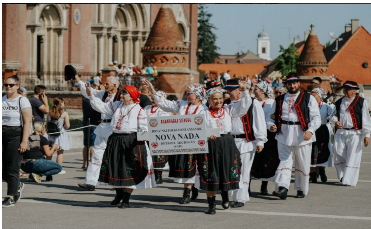
Slika 27. Svečana povorka 57. Đakovačkih vezova

Ovi prizori odvijali su se tijekom svečanog mimohoda 57. Đakovačkih vezova (slika 27.), koji je prolazio kroz Mali park, korzo, trg, ispred Katedrale i Dvora, sve do Strossmayerova perivoja. 68