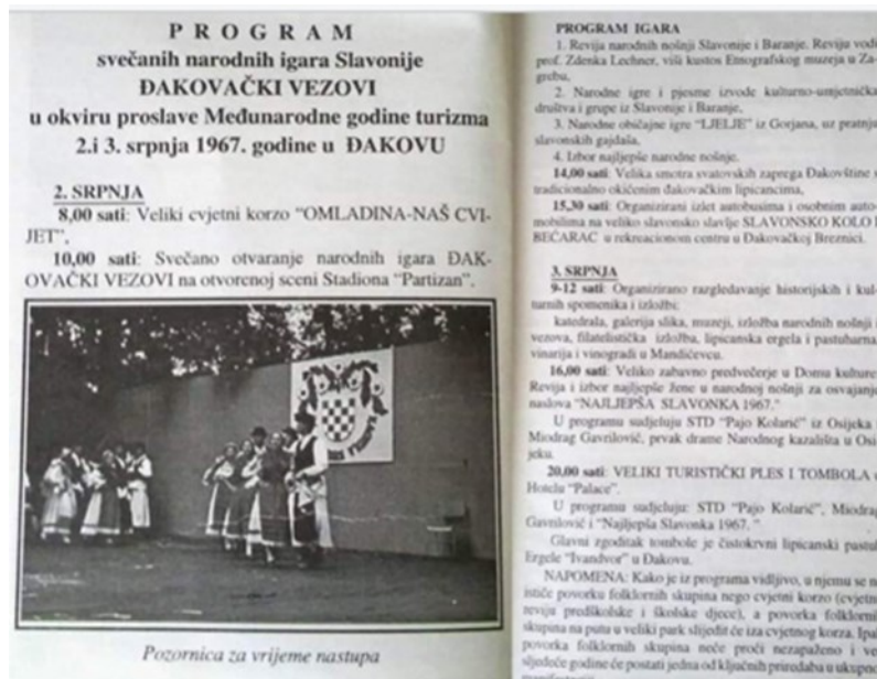
Slika 2. Program prvih Đakovačkih vezova

Prvi Đakovački vezovi održali su se 2. i 3. srpnja 1967. povodom međunarodne godine turizma te se održavaju sve do danas, a na inicijativu doktora Zvonimira Benčevića. Može se reći kako bez njega ne bi niti bilo te manifestacije. Program u prvim danima ne razlikuje se puno od današnjeg te sadrži smotru i mimohod folklornih skupina, svatovske zaprege i konjanike, izbor najljepše djevojke i snaše u nošnji, kulturne i zabavne sadržaje te njegovanje i očuvanje izvornog folklor. Jedina je razlika u tome što današnji program traje ipak duže zbog dodanog sadržaja. U nastavku slijedi fotografija s programom prvih Đakovačkih vezova.