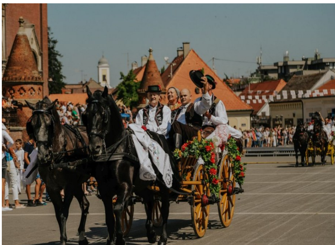
Slika 26. Povorka zaprega na 57. Đakovačkim vezovima

Poznati po folklornom bogatstvu, Đakovački vezovi također predstavljaju priliku za smotru konja uzgojenih u seljačkim domaćinstvima udruženim u Konjogojske udruge. Tijekom povorke Đakovačkih vezova (slika 26.) svatovske zaprege prolaze gradom, prateći zvukove topota konja i pružajući posjetiteljima jedinstveno iskustvo. Uz to, ljubitelji konjičkog sporta imaju priliku uživati na hipodromu, gdje se svake godine održavaju konjička natjecanja. Natjecanja u skakanju preko prepona te vožnja dvoprega i četveroprega pružaju priliku konjima da pokažu svoju ljepotu, dok vlasnici izražavaju svoj ponos i diku. Posjetitelji grada Đakova imaju priliku posjetiti Državnu ergelu Đakovo i Ivandvor u bilo koje doba godine, gdje mogu uživati u prekrasnim slavonskim pejzažima i diviti se lipicancima, koji su ponos i simbol ovog kraja. 67