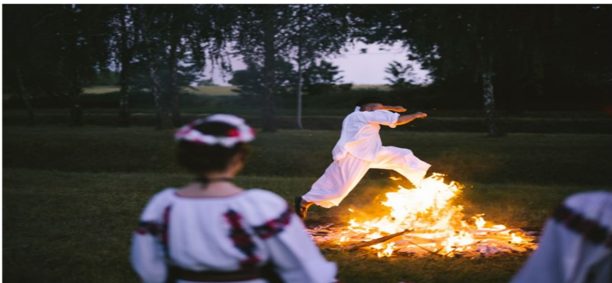
Slika 14. Ivanjski krijesovi

Običaj Ivanje jedan je od najpoznatijih ljetnih običaja tradicionalno obilježavanih povodom blagdana svetog Ivana Krstitelja, na dan uoči ljetnog suncostaja, odnosno najdužeg dana u godini. Ovaj običaj, poznat i kao Ivanjski kresovi ili Ivanjdan, rasprostranjen je diljem Europe, ali se posebice njeguje među slavenskim narodima, gdje se često smatra starim slavenskim običajem. Središnji element ovog običaja jest paljenje vatre u noći, uz ples i preskakanje vatre, često nazvane „krijes“, u pratnji glazbe. Ovaj običaj ima duboko ukorijenjeno vjerovanje da je važan za zaštitu zdravlja ljudi i domaćih životinja te za plodnost poljoprivrednih usjeva. „Ivanjski kresovi“ već dugi niz godina postaju neizostavan dio Đakovačkih vezova. Tako je bilo i ove godine, 21. lipnja, kada se na pozornici u Strossmayerovu parku održalo 23. izdanje ovoga tradicionalnog događaja. Nastupilo je nekoliko kulturno-umjetničkih društava, uključujući KUD „Bektež“ iz Bekteža, KUD „Ledina“ iz Gašinaca, KUD „Drenjanci“ iz Drenja, KUD „Sloga“ iz Satnice Đakovačke i KUD „Lipa“ iz Semeljaca. Ovaj događaj bio je prilika za zajedničko slavlje i očuvanje kulturne baštine, okupljajući ljude različitih generacija u duhu tradicije i veselja. 62