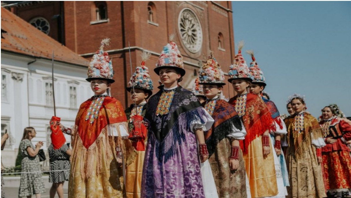
Slika 29. Gorjanske ljelje

vezova, pa tako i ove godine sa svojim raskošnim narodnim ruhom, što je prikazano u nastavku.