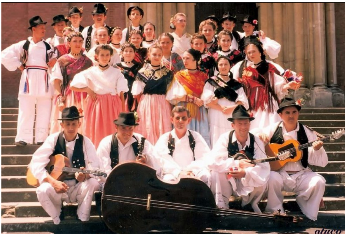
Slika 5. KUD „Matija Gubec“ iz Slavanskog Kobaša

nastavlja pridonositi kulturnom životu Slavanskog Kobaša i okolice te čuvati bogato nasljeđe i tradiciju ovog područja, prikazano slikom 5.