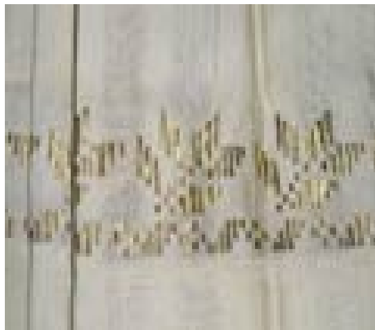
Slika 6. Vez ubjeranjem

provlače kroz niti osnove. Na ovaj način uglavnom se ukrašavalo žensko ruho, a posebno rubine i oplećka te ručnici. Tom tehnikom dobivaju se geometrijski motivi te se na takve odjevne predmete rijetko dodaju ukrasi, za razliku od druga dva osnovna veza. Rubina koja je tako ukrašena naziva se pulana rubina ili pulanka. 51