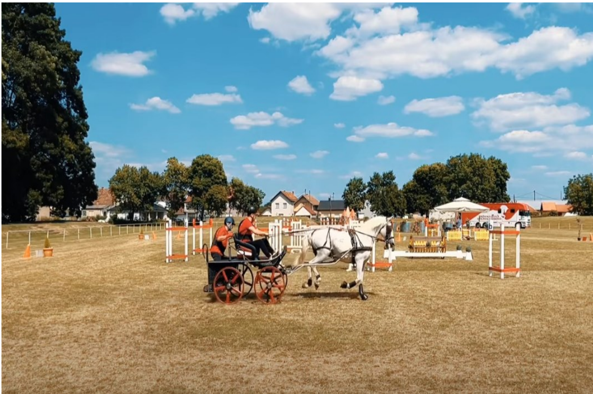
Slika 25. „Finale Croatia Cupa” za jednoprege i dvoprege

Svečano otvaranje Đakovačkih vezova bilo je obogaćeno nastupima jahača i vozača zaprega s lipincima. Ova manifestacija, koju su službeno podržali Državna ergela i privatni uzgajivači, redovito uključuje svečanu povorku koja prikazuje bogato ukrašene tradicijske svatovske zaprege,iskusne vozače i vješte jahače svih uzrasta. Prošlogodišnja povorka na 56. Đakovačkim vezovima brojila je 44 svatovske zaprege i 62 jahača iz Slavonije, Baranje i Srijema. Osim toga, otvorenje Vezova dodatno se obogaćuje nastupima vještih jahača lipicanaca koji donose i predstavljaju službene zastave, čime se dodatno ističe ljepota ove tradicije. 66