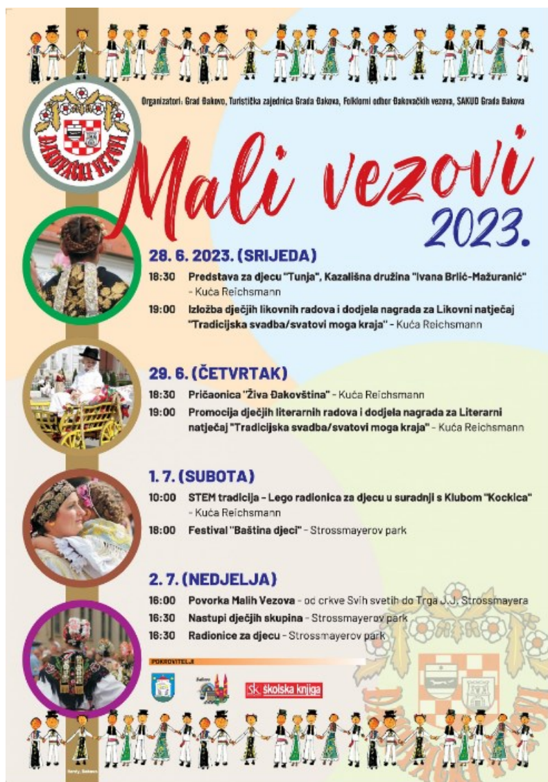
Slika 17. Program malih vezova

Kasnije tog dana, u 18 sati, održan je Festival „Baština djeci“ u Strossmayerovu parku. Završni dan, 2. srpnja, obilježila je velika povorka koja je krenula od crkve Svih svetih i završila na Trgu J. J. Strossmayera u 16 sati (slika 17.). Nakon povorke u Strossmayerovu parku različite skupine izvele su svoje nastupe u isto vrijeme, a djeca su sudjelovala u raznim radionicama. Sve ove aktivnosti pridonijele su šarolikosti i bogatstvu Đakovačkih vezova te su omogućile djeci da se upoznaju s tradicijom i nasljeđem svojeg kraja na zabavan i edukativan način.