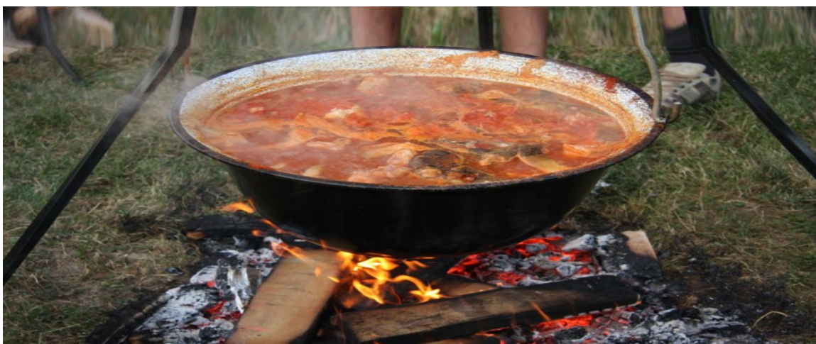
Slika 18. Kuhanje čobanca