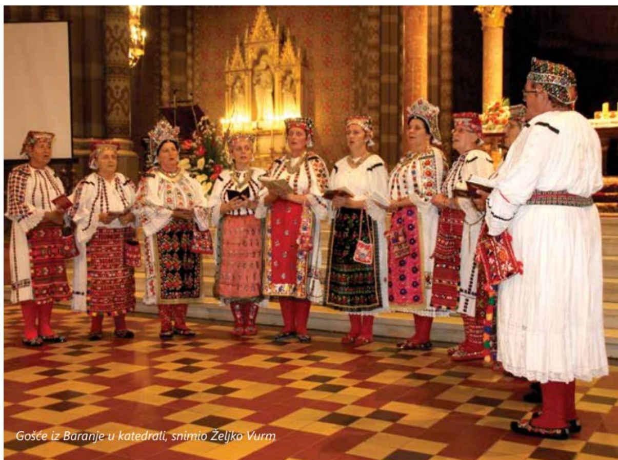
Gošće iz Baranje u katedrali, snimio Željko Vurm

Ovaj segment Đakovačkih vezova ima duboko kulturno i vjersko značenje, čuvajući važan dio nematerijalne kulturne baštine Slavonije, Baranje i drugih regija Hrvatske gdje se ova tradicija njeguje. 64