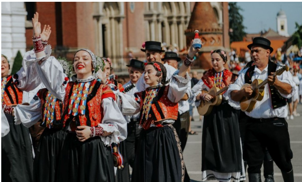
Slika 3. Mimohod sudionika na Đakovačkim vezovima

na sve prisutne. 44 U nastavku slijedi slika koja prikazuje bogatstvo narodnog ruha sudionika: