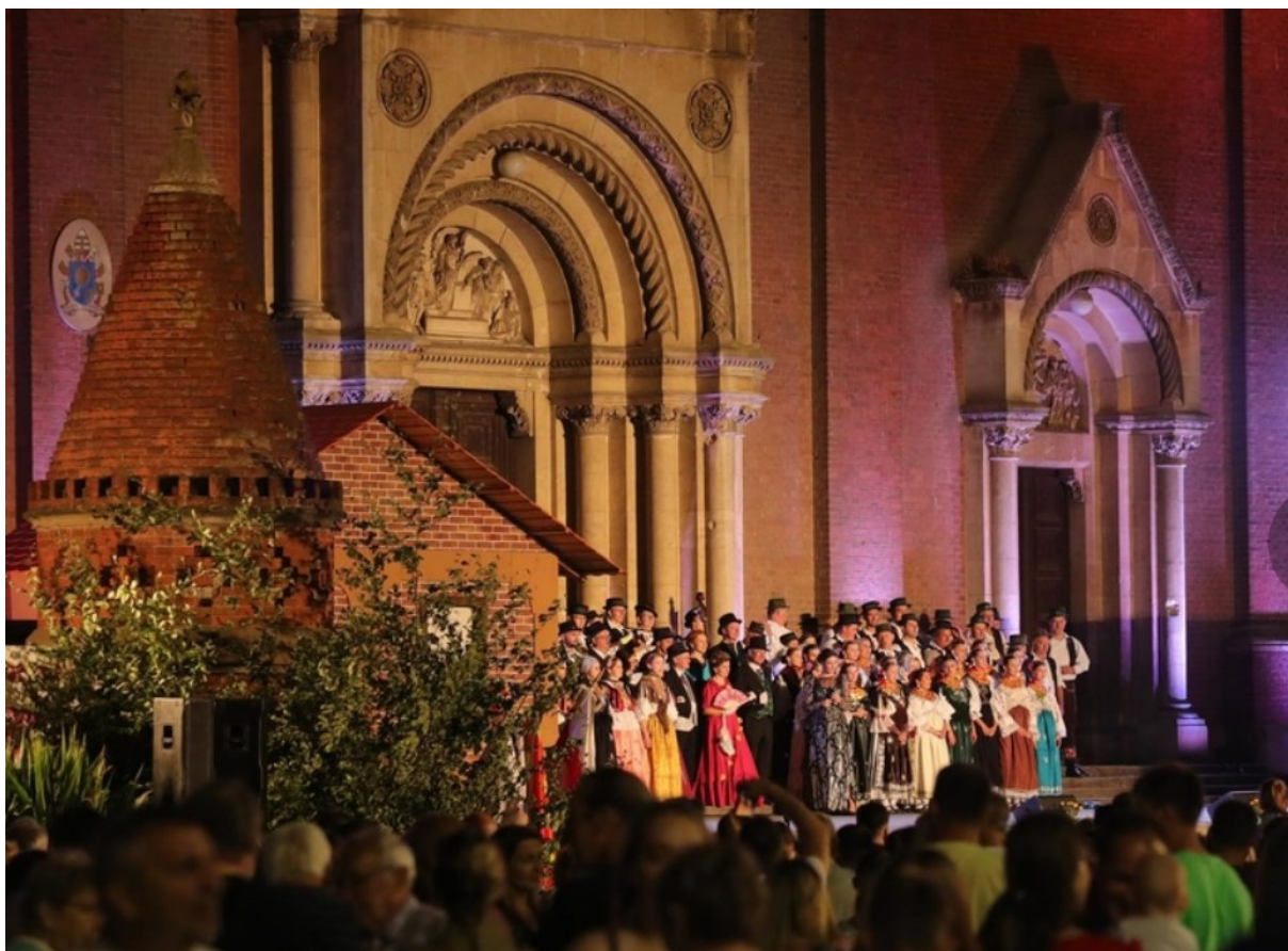
Slika 24. Otvorenje 57. Đakovačkih vezova - scenska slika