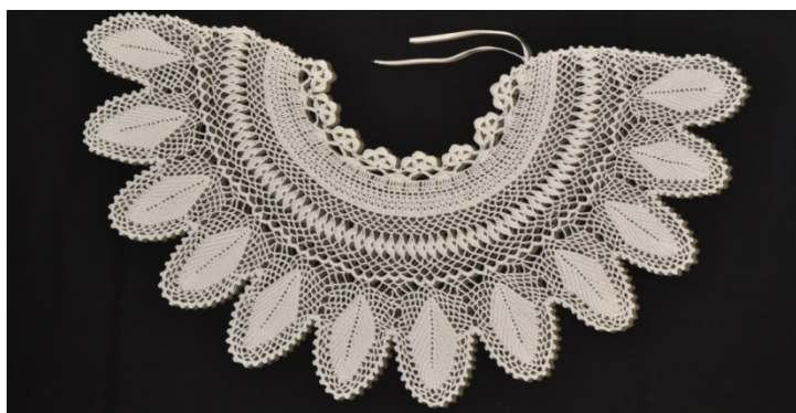
Slika 9. Šling

drvenim trukovima. Mustra se prenosila na bijelo platno tako da se u vruću vodu razmutilo ljepilo tutkalo koje je kasnije vezivalo boju za tkaninu, a tada se u smjesu dodavala modra farba (modrilo) i promiješalo. Zatim se na gumenom jastučiću boja premazala četkom i dva puta drveni truk otisnuo se o gumenu jastučić i tada vješto prenosio na platno. Drugi način prenošenja mustri na platno jest s pomoću šablona-papira, koji je sličan pergamentu. Motivi mustre na šablonima izbušeni su sitnim rupicama kroz koje se prenosila plava boja – modrilo – u prahu na platno, a zatim se špricala špiritusom kako bi se boja vezala za platno. 57