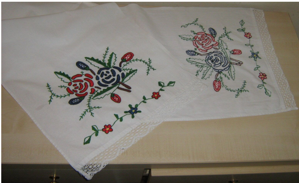
Slika 11. Slavonski ručnik, ručno vezen rad

je tipično za taj kraj. Tako su se na ručnike vezli motivi konja, seoskih kola, đerma, cvijeća i tome slično.