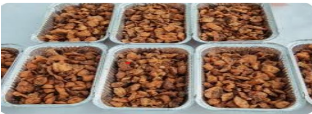
Slika 19. Čvarci

Izvor: Đakovački vezovi ( https://djakovacki-vezovi.hr/ , pristupljeno 28. lipnja 2023.)