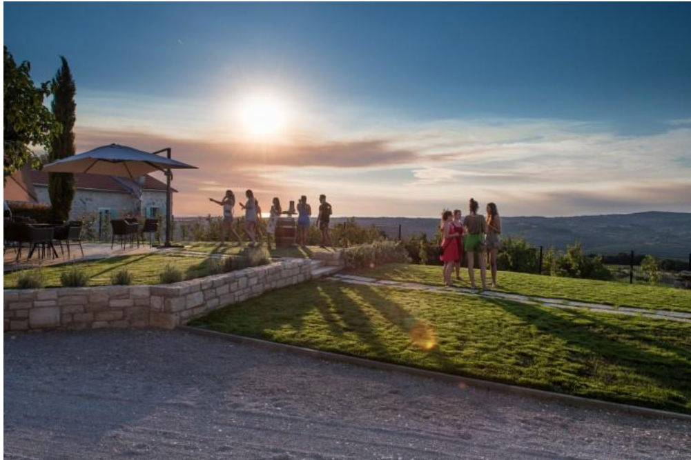
Slika 4. Vinarija Rossi