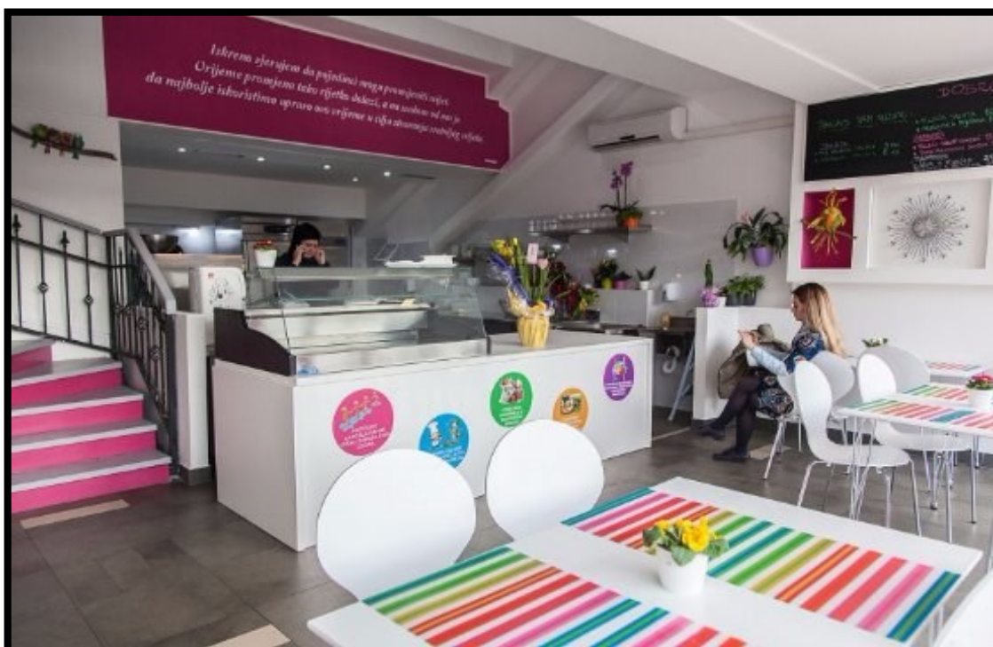
Slika 5.: Bistro Punkt, Pula