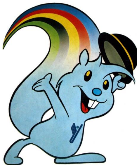
Slika 4. Maskota Univerzijade 1987., vjeverica Zagi