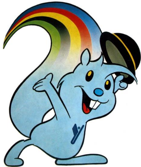
Slika 4. Maskota Univerzijade 1987., vjeverica Zagi