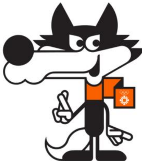
Slika 2. Maskota Zimskih olimpijskih igara Vučko