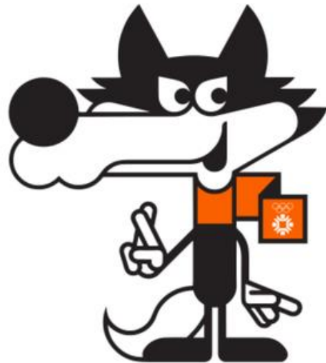
Slika 2. Maskota Zimskih olimpijskih igara Vučko