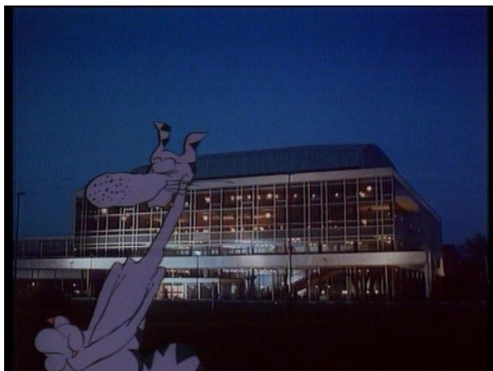
Slika 6. Maskota Eurovizije 1990., Eurocat ispred dvorane Vatroslava Lisinskog