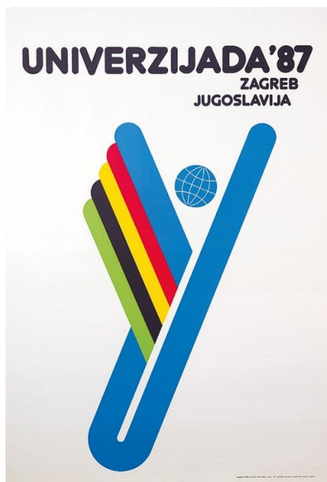
Slika 3. Znak Univerzijade 1987.

Zagrebu je dodijeljena organizacija Univerzijade već 13. svibnja 1984. kada ju je u Veneciji izvršni odbor FISU dodijelio Univerzitetkom savezu za fizičku kulturu Jugoslavije. Nakon ove odluke, već je 26. lipnja Skupština grada Zagreba na sjednici