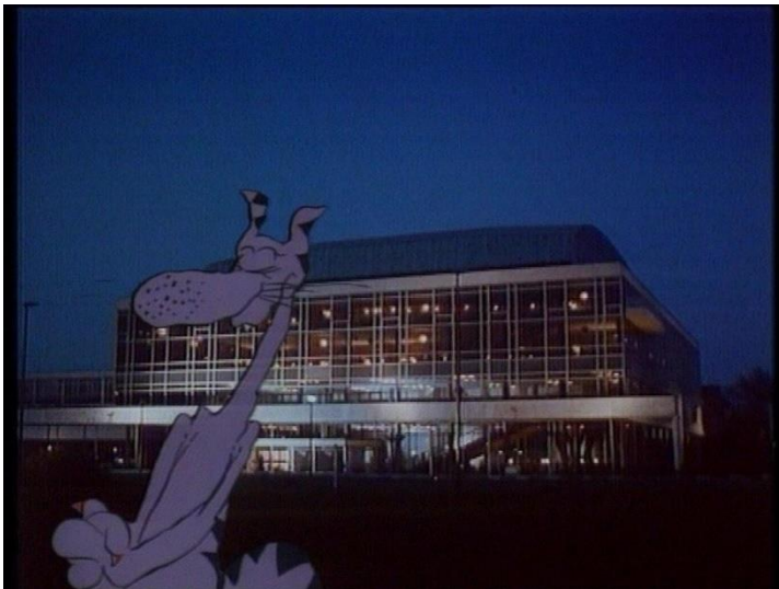
Slika 6. Maskota Eurovizije 1990., Eurocat ispred dvorane Vatroslava Lisinskog